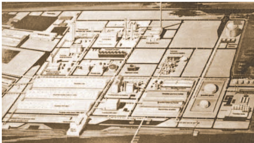
Maketa tvornice gnojiva u Kutini

Ipak potaknuti činjenicom da su od prvog prikaza jednoga velikog gradilišta prošla puna tri desetljeća, odlučili smo kao svojevrsan prilog proslavi 65. obljetnice časopisa, koju pripremamo za kraj ove godine, prikazati što smo svojedobno pisali o nekim gradilištima i što se s tim građevinama u međuvremenu dogodilo, posebno je li ostvarena njihova osnovna namjena i jesu li uopće završene. Vjerujemo da će to ujedno biti i jedan poseban i zanimljiv prikaz suvremenoga hrvatskog graditeljstva.