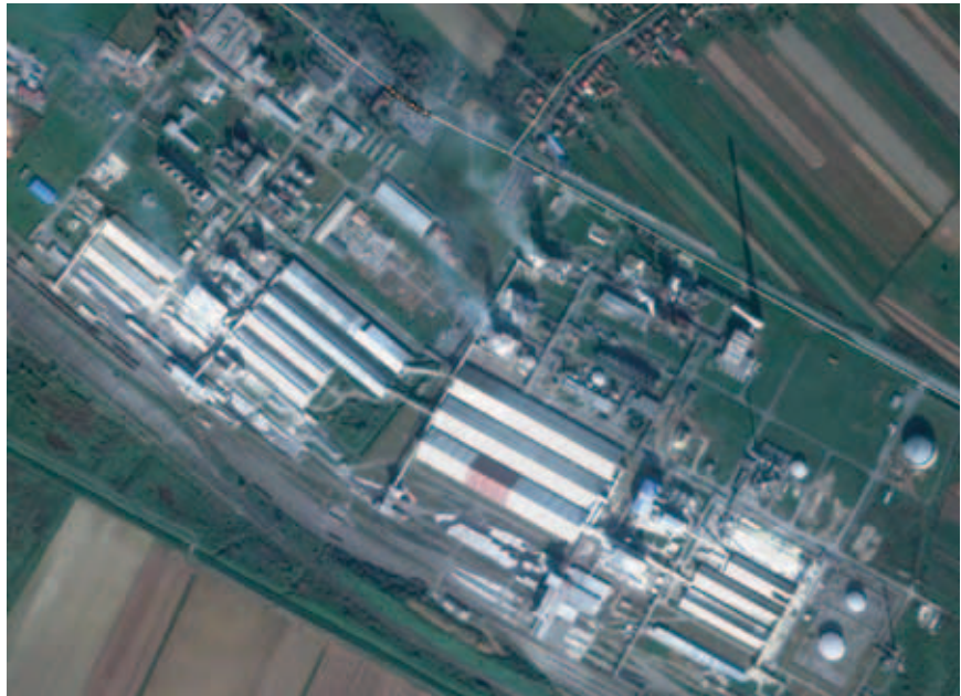
Sadašnji pogled iz zraka na kompleks Petrokemije u Kutini

Problema je bilo i s inflacijom, zapravo s ugovorenom kliznom skalom od 20 po-