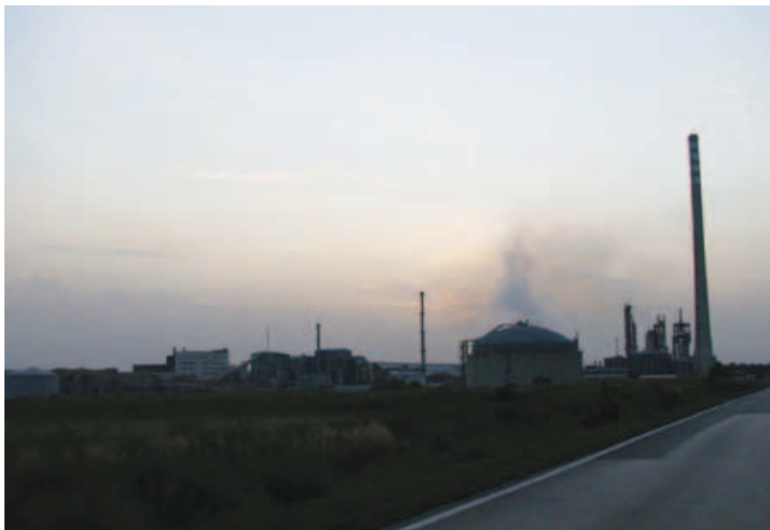
Kompleks Petrokemije u zimskoj izmaglici

stanicama te tlačnim cjevovodom. Izgrađeno je i odlagalište za neutralizaciju silikofluorovodične kiseline, južno od željezničke pruge, ali i odlagalište otpadnoga fosfornog gipsa južno od željezničke pruge.