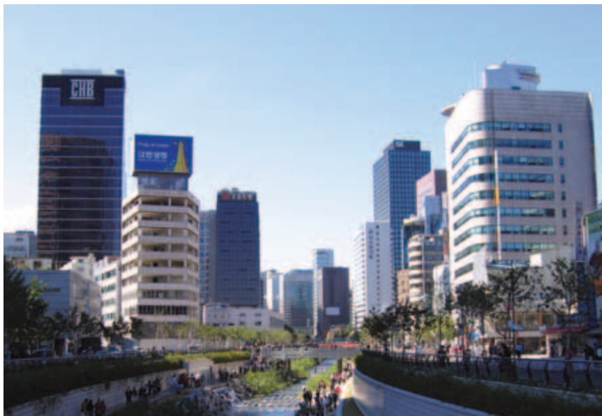
Obnovljeni se potok dobro uklopio u poslovno središte

Tako je dobiveno je 8,4 km suvremenoga javnoga rekreacijskog prostora namijenjenog isključivo biciklistima i pješacima kojima je omogućen izravan kontakt sa svježom i čistom vodom, čak i prijelaz preko "improviziranih" prijelaza. Čista je voda u novom potoku omogućila bujanje novog života i postala staništem mnogih životinjskih vrsta, ali i pridonijela oporavku cijeloga ekološkog sustava. Tako se prema podacima gradskih vlasti znatno povećao broj vrsta, poput riba (s negdašnjih 4 na 25), ptica (od 6 šest na 36) i kukaca (s 15 na 192). Uklanjanje nešto više od 4 km autoceste koja je dijelila središte grada smanjilo je onečišćenje zraka zbog smanjenja prometa koji se i spontano preusmjerio na druge prometnice, ali i ukupnu temperaturu u području oko revitaliziranog potoka. Prema meteorološkim podacima ljetne su temperature oko Cheonggyecheona sada i do pet stupnjeva manje jer su beton i asfalt zamijenjeni