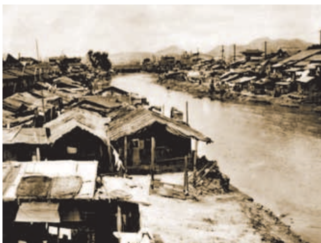
Negdašnje improvizirane kućice na obalama Cheonggyecheona

S vremenom oko slavljenoga gradskog potoka počeli su se razvijati sirotinjski