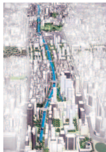
Planirana trasa obnovljenoga Cheonggyecheona

km duga) s kojom su uklonjene i sve improvizirane nastambe. Stoga je područje negdašnjega gradskog vodotoka bilo potpuno promijenjeno, čak je i isticano kao primjer uspješne industrijalizacije i modernizacije. Jedina su uspomena na negdašnji slavni vodotok bile male trgovine, radionice, ulični re-