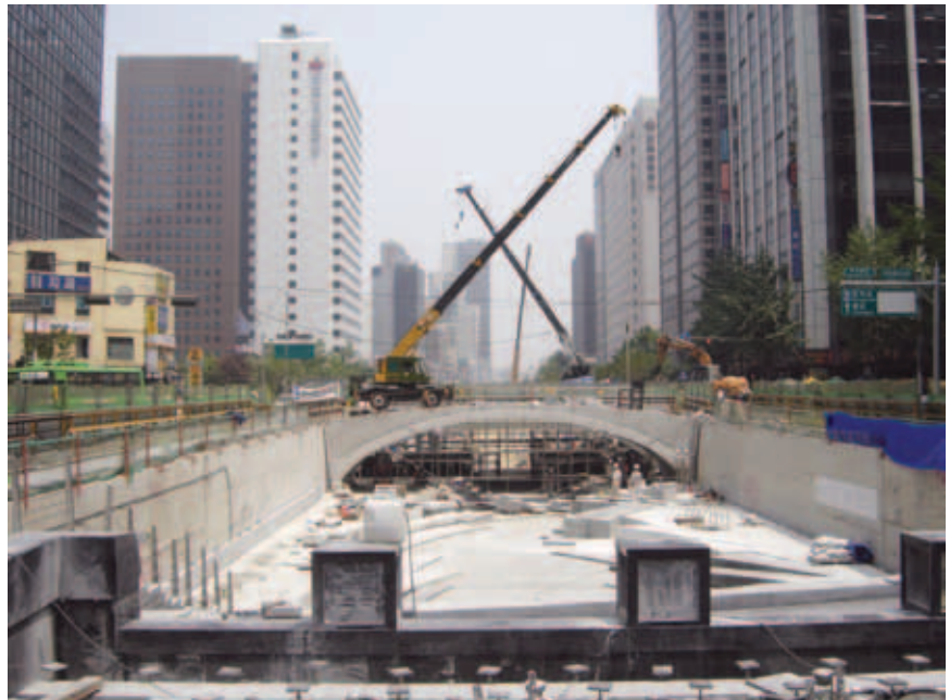
Radovi na obnovi vodotoka

Gradska je uprava utemeljila posebne tvrtke za istraživanje, gradnju i kontrolu cijelog projekta, ali i za rješavanje sporova s ostalim zainteresiranim stranama, posebno sa sindikatima trgovaca. Također su utemeljena posebna tijela koja su vodila brigu o prometnim gradskim problemima tijekom rekonstrukcije i građenja. Dakako da je ovaj vizionarski projekt povećanja kvalitete života i vraćanja prirode u grad te uvođenja