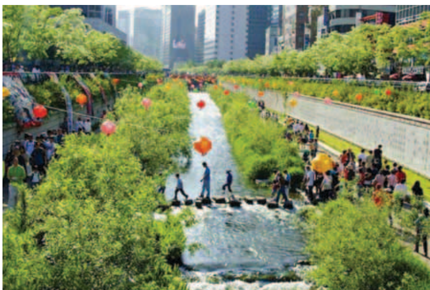
Uz potok se okupljaju turisti i cijele obitelji

iz sezone u sezonu, posebno zbog katastrofalnih poplava koje nastaju tijekom intenzivnih oluja u sezoni monsuna. Projektom je omogućeno prihvaćanje najvećih količina vode prema stogodišnjim mjerenjima monsunskih kiša kako bi se ublažile ili sasvim izbjegle poplave. Stoga je i zadržana zatečena razina negdašnjeg potoka, a na mnogim je mjestima korito i produbljeno. Uz blagotvorni učinak koji je revitalizacija vodotoka imala za prenatrpani gradski okoliš, otvoreni je gradski prostor