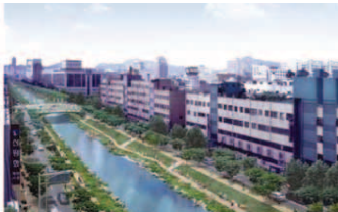
Donedavni i sadašnji izgled vodotoka Cheonggyecheon

a njegove su se obale stalno ojačavale pa su s vremenom izravnani i njegovi zavoji. Ipak cijelo se vrijeme gradska kanalizacija izravno izlivala u vodotok, što je uzrokovalo brojne sanitarne i zdravstvene probleme, posebno u kišnim monsunskim razdobljima kada se Cheonggyecheon često izljevao izvan korita i zagađenom vodom naplavljavao okolne stambene četvrti.