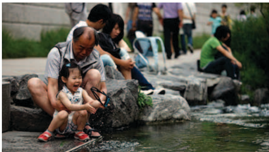
Cijeli je projekt omogućio izravan doticaj građana s rijekom

sto, a smanjile su se i ljetne temperature okolnih područja.