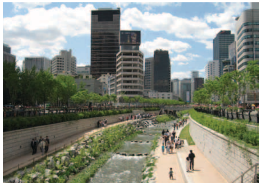
Detalj nove gradske šetnice i okupljališta