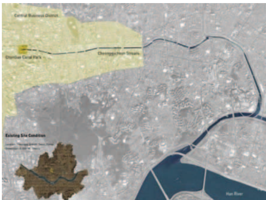
Položaj Cheonggyecheona na karti Seula

Potok je prirodno tekao kroz povijesno središte Seula te bio hvaljen zbog čiste vode, ali i za brzu dostavu raznovrsnih plodova. Stoga je u prošlosti bio ponos korejskoga glavnog grada i smatran jednim od najvažnijih gradskih sadržaja. Redovito se produbljavao i čistio,