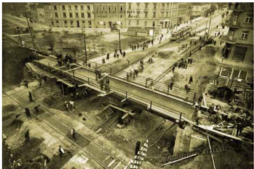
Gradnja nadvožnjaka preko Savske ceste u Zagrebu, Waagner-Biró A.G. Beč-Graz (Hrvatski željeznički muzej, zbirka fotografija)

Do 1918. pruga Zidani Most – Zagreb – Sisak imala je status glavne pruge drugog reda i prometno je najvećim dijelom bila vezana uz državnu magistralnu prugu Beč – Ljubljana – Trst. S obzirom na solidnu izvedbu, i to u građevnom smislu i u pogledu osiguranja, iskorištavanje je pruge u prvim desetljećima teklo bez većih poteškoća. Problemi su se osjećali jedino u prometu mostom preko rijeke Save kod Zagreba koji je postao preslab za prihvatanje svih vlakova Društva južnih željeznica i Mađarskih državnih željeznica (MÁV) koje su se zajednički koristile dionicom do Zaprešića za sve vlakove koji su kretali iz Zagreba. Posebno se to osjetilo 1913. nakon što je MÁV u promet uveo lokomotive,