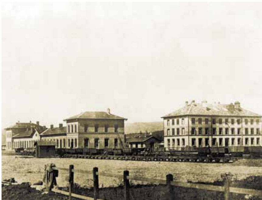
Zagreb Zapadni kolodvor s kolosiječne strane iz 1862.

Jednokolosiječna pruga s trasom između Zidanoga Mosta, Zagreba i Siska, odnosno do savske luke u Galdovu, bila je dugačka 127,58 km, a granicu između Slovenije i Hrvatske prelazila je na rijeci Sutli. Uzduž cijele pruge bilo je deset kolodvora, od kojih je pet bilo na slovenskom a pet na hrvatskom području. Na slovenskom su dijelu izgrađeni kolodvori Steinbrück (danas Zidani Most), Lichtenwald (danas Sevnica), Reichenburg (danas Brestanica), Videm Gurkfeld (danas Krško) i Rateče (danas Brežice), a na hrvatskom Zaprešić Brdovec (danas Zaprešić), Agram Südbahnhof (Zagreb Južni kolodvor, danas Zagreb Zapadni kolodvor), Gorica (danas Velika Gorica), Lekenik i Sissek (danas Sisak). Sve prijamne zgrade bile su građene tipski, s karakterističnim rubovima od crvene opeke oko pročelja, vrata i pro-