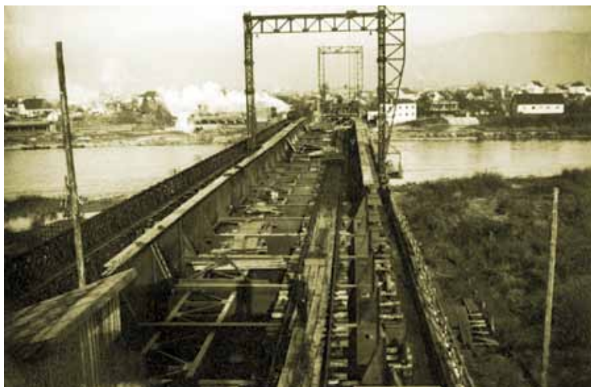
Gradnja novoga željezničkog mosta preko rijeke Save kod Zagreba 1937.–1939.

Zbog vlasničke promjene željezničkih pruga i podržavljenja od 1. siječnja 1924., ni gradnja novoga kolodvora ni bilo kakvi zahvati nisu bili ostvareni, a i od drugih planiranih ulaganja ostvaren je tek manji dio. Tako je 1920. bio izgrađen ranžirni kolodvor na Črnomercu, čime je teretni prijevoz u Zagreb Južnom kolodvoru odvojen od putničkog, a 1929. u promet su predani jednokolosiječni nadvožnjaci na Savskoj i Samoborskoj cesti. Oni su zamijenili željezničko-cestovne prijelaze u razini koji su znatno