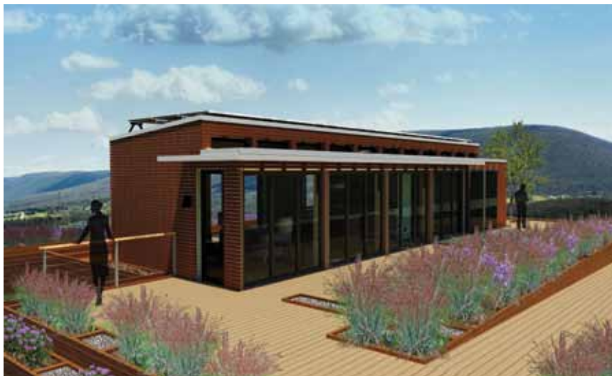
Zero energy house - prototip Velika Britanija

uskладиštene sunčeve energije. Očito je da uporaba toplinske crpke troši nešto više električne energije koja joj je potrebna za rad, stoga se u pasivnoj kući troši nešto više struje nego drugdje. No pri sadašnjim cijenama energenata za kućanstvo (električna energija i fosilna goriva) proizvodnja topline toplinskom pumpom ugodnija je od proizvodnje topline iz fosilnih izvora. Veća potrošnja električne energije manji je trošak u usporedbi s troškom za tradicionalno grijanje. Za proizvodnju električne energije u termoelektranama još će dugo biti potrebni fosilni energenti, ali iako je njihova iskoristivost viša, štetne su emisije zbog kontroliranog postupka mnogo manje nego kad ta goriva izgaraju u individualnim ložištima.