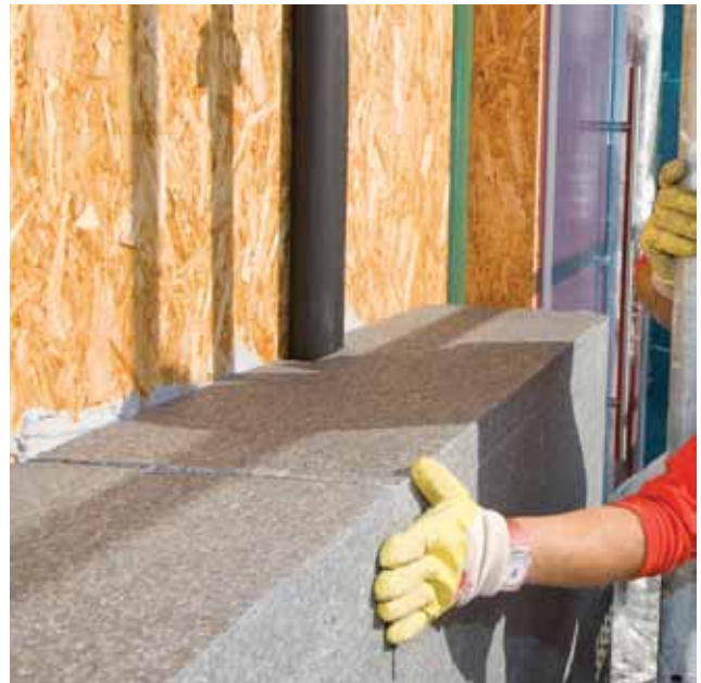
Dobra toplinska izolacija vrlo je važna za standard pasivne kuće

Veliki dio toplinskih gubitaka u građevinama otpada na prozračivanja, ali to nipošto ne znači da se zgrade ne bi trebale prozračivati radi osiguranja potrebne kvalitete zraka. Kako bi se održala dopuštena razina ugljikova dioksida i drugih štetnih tvari, treba u zatvorenom prostoru svakog sata osigurati 25 do 35 m 3 svježeg zraka po jednoj osobi. To ujedno znači da bi svaka tri