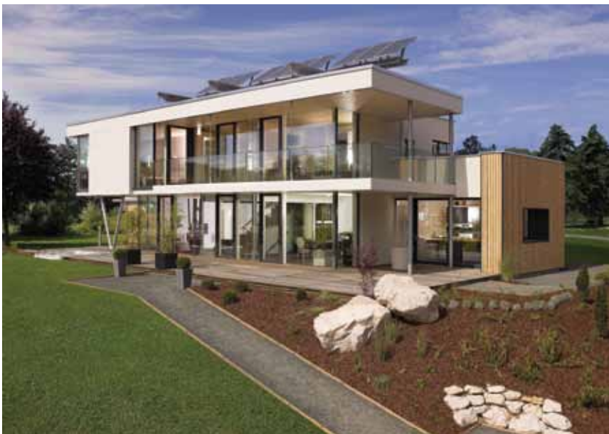
Pasivna kuća u Darmstadtu pokraj Frankfurta

Iako se u Građevinaru dosta pisalo o niskoenergijskim i pasivnim kućama (osnovna je razlika u potrošnji energije – niskoenergijska 30 kWh/m 2 , a pasivna kuća 15 kWh/m 2 ), nije naodmet ponešto i ponoviti. Ne postoji globalno prihvaćena definicija niskoenergijske kuće. Zbog velikih razlika u nacionalnim standardima, niskoenergijska kuća izgrađena prema standardima jedne države ne mora biti niskoenergijska prema standardima druge države. U Njemačkoj niskoenergijska kuća ( Niedrigenergiehaus ) ima ograničenje u potrošnji energije za grijanje prostorija od 50 kWh/m 2 na godinu. U Švicarskoj je termin niskoenergijska kuća određen Minergie standardom i za grijanje prostorija ne smije se upotrijebiti više od 42 kWh/m 2 na godinu. Trenutačno se kod prosječne niskoenergijske kuće u tim državama dostiže otprilike polovica tih iznosa, odnosno između 30 kWh/m 2 na godinu i 20 kWh/m 2 na godinu za grijanje prostorija. U Hrvatskoj se prilikom određivanja niskoenergijske kuće za grijanje prostorija uzima vrijednost od 40 kWh/m 2 na godinu (u nas je klima mnogo povoljnija od one u Njemačkoj i Švicarskoj). Ta bi vrijednost u praksi zbog povoljnije klime morala na jugu biti i znatno niža.