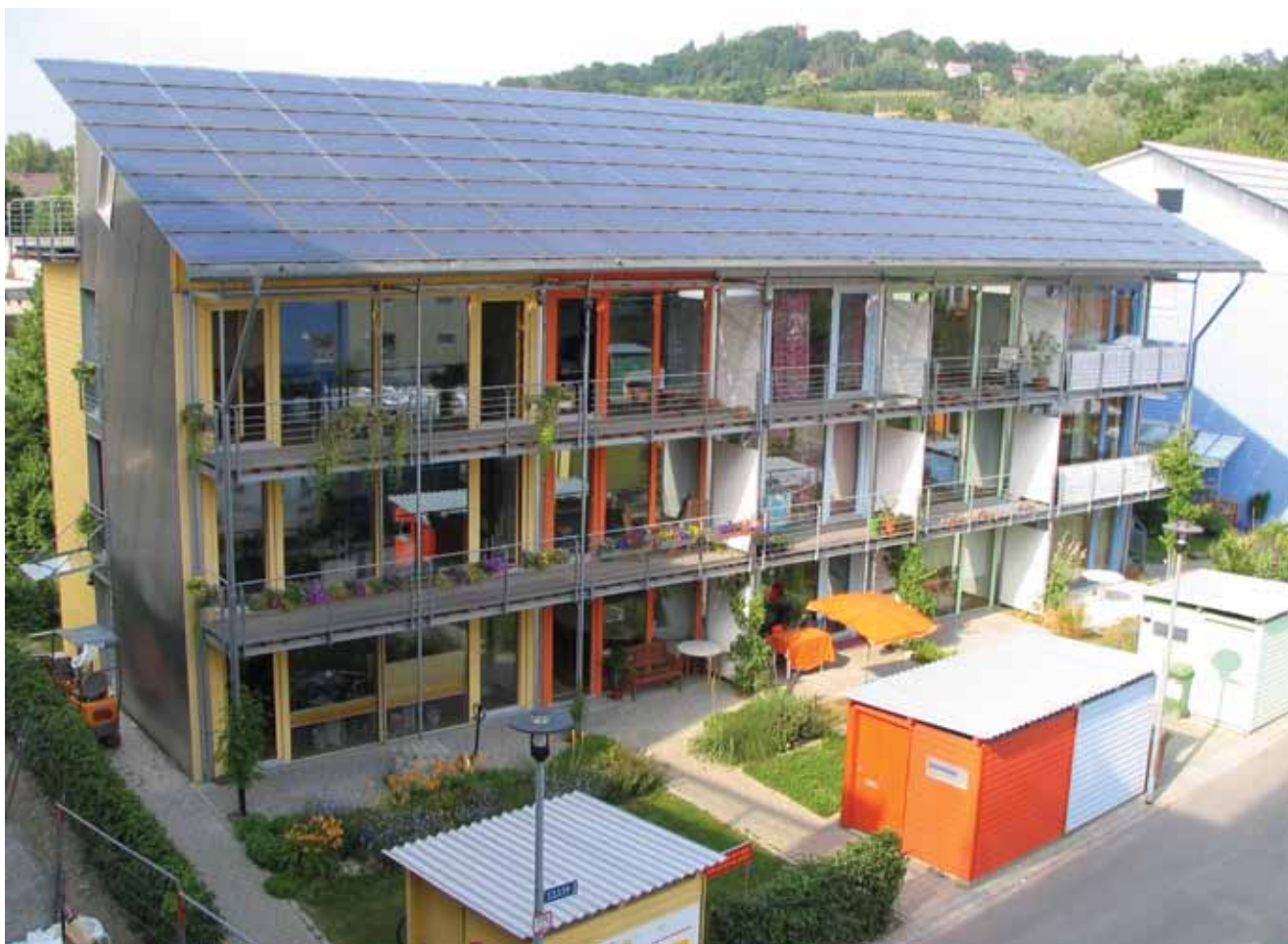
Prva višestambena "plus energetska" zgrada u Darmstadtu

druga obična kuća. Čak ni ljeti kad uobičajenu kuću zatvaranjem osiguravamo od pregrijavanja, a zimi se prozori ionako nedovoljno otvaraju jer se kuća može brzo ohladiti. Otvarati prozore u pasivnoj kući nije potrebno, ali nije ni zabranjeno pa ih stanari mogu otvarati kada god to požele. Često je to potrebno kada se pojave brojni posjetitelji ili kad dođe do "manje nesreće" na štednjaku. Postoje pasivne kuće u kojima se puši, pa stoga valja više puta otvarati prozore. Time se zacijelo izgubi nešto topline, ali se unatoč tome sustav pasivne kuće ne narušava.