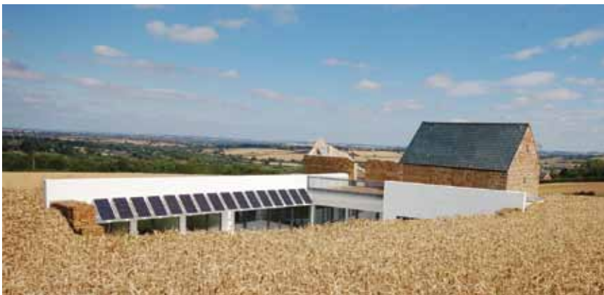
Pasivna kuća u Švicarskoj, takve su kuće ekološki prihvatljive i održive

U pasivnoj je kući, međutim, zrak uvijek svjež o čemu brine tzv. kontrolirano prozračivanje s vraćanjem topline otpadnog zraka. Zrak dolazi izvana i u prijenosniku se topline grije toplinom iskorištenog zraka koji napušta kuću. Svježi se vanjski zrak i topli otpadni zrak pritom miješaju. Ljeti postoji mogućnost da se takvim sustavom zgrada i hladi. Svježi se topli zrak što dolazi izvana hladi iskorištenim zrakom iz unutrašnjosti građevine. Potrebno je svakako istaknuti da uređaj za prozračivanje nije isto što i klima-uređaj koji cijelo vrijeme ujednačava kvalitetu istog zraka. Stoga su neosnovane i zapravo sasvim neumjesne primjedbe da je pasivna kuća zatvoren sustav koji ne omogućuje doticaj unutarnjih prostora i okoline. Toliku količinu svježega zraka koliko ima pasivna kuća nema ni jedna