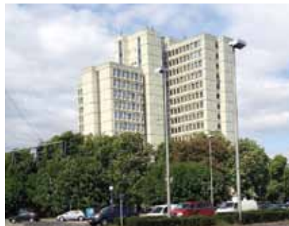
Zgrada Chromosa u Zagrebu u kojoj je sjedište HKIG-a

Kroz Komoru i djelovanje njezinih članova ovlaštenih inženjera građevinarstva pokušavalo se ukloniti ili što više smanjiti pružanje usluga projektiranja ili nadzora bez ovlaštenja, nelojalna konkurencija i javno nadmetanje cijenama, pogodovanje nestručnom i neodgovornom obavljanju usluga, nedodirljivost privatnih investicija, te preuzimanje kompleksnih poslova uz "najamne" uvjete.