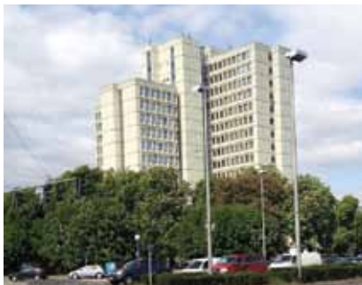
Zgrada Chromosa u Zagrebu u kojoj je sjedište HKIG-a

Kroz Komoru i djelovanje njezinih članova ovlaštenih inženjera građevinarstva pokušavalo se ukloniti ili što više smanjiti pružanje usluga projektiranja ili nadzora bez ovlaštenja, nelojalna konkurencija i javno nadmetanje cijenama, pogodovanje nestručnom i neodgovornom obavljanju usluga, nedodirljivost privatnih investicija, te preuzimanje kompleksnih poslova uz "najamne" uvjete.