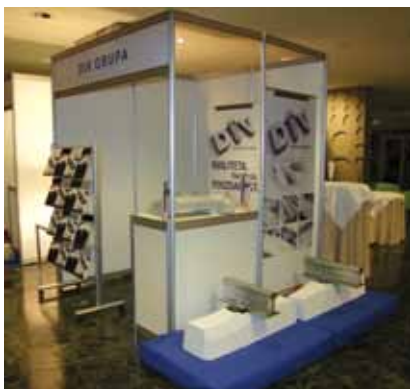
Izložbeni prostor tvrtke DIV d.o.o. na Saboru hrvatskih graditelja

O tvornici vijaka DIV iz Samobora slušali smo često u posljednje vrijeme u vezi s kupnjom Brodogradilišta Split . Inače DIV grupacija je bila srebrni sponzor Sabora hrvatskih graditelja, a posjeduje tradiciju dužu od 120 godina i trenutačno je jedna od vodećih tvornica vijaka u Europi. Naime posluje na osam lokacija u osam država i ima više od 1000 zaposlenih djelatnika. Konstantnim je ulaganjima proširila kapacitete, a uvođenjem novih tehnologija tvrtka se i još razvija pa planira i daljnji rast.