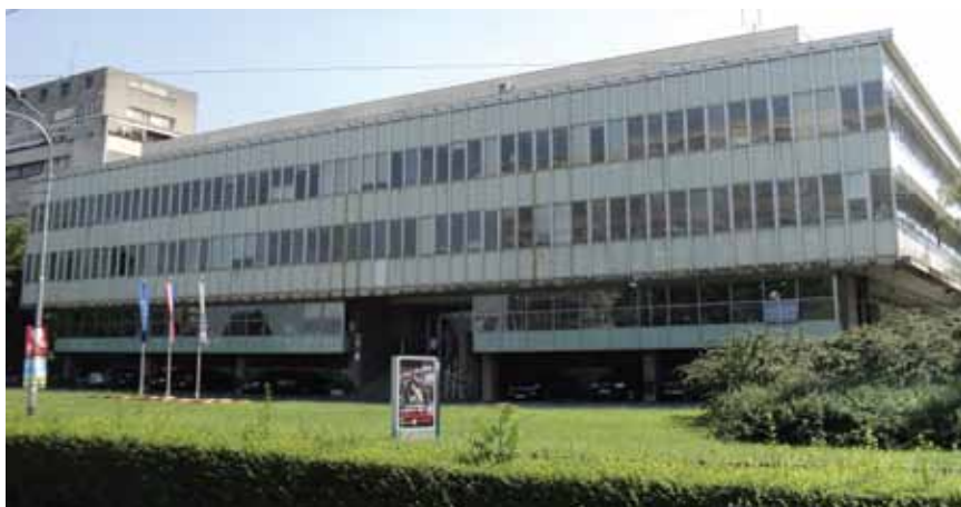
Upravna zgrada Hrvatskih voda u Ulici grada Vukovara u Zagrebu