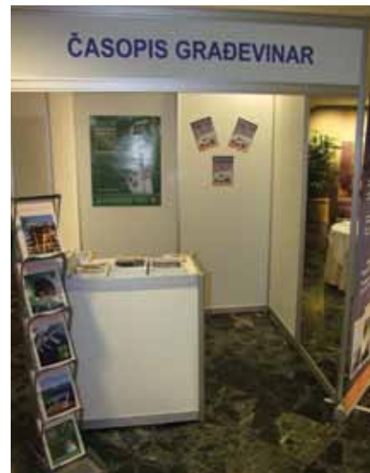
Izložbeni prostor Građevinara na Saboru hrvatskih graditelja

Valja istaknuti da je na posebnom štandu bio predstavljen i časopis Građevinar . Časopis je to s dugogodišnjom tradicijom, a sljedeće godine slavi svoj 65. rođendan. Časopis je mjesečnik, a posljednjih tridesetak godina nije iza-