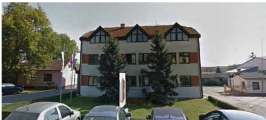
Sjedište Radnika d.d. u Križevcima

Radnik d.d., sadašnja tvrtka za građevinarstvo i građevinska industrija iz Križevaca, vjerojatno je osnovana 1947. Danas Radnik izvodi sve vrste građevinskih radova bez obzira na opseg i složenost, a pritom primjenjuje najsuvremenija dostignuća graditeljske tehnologije.