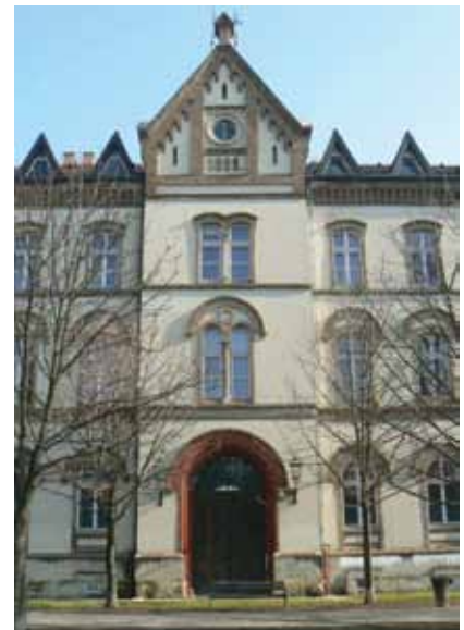
Sjedište Ministarstva graditeljstva i prostornoga uređenja

Ustrojstvene su jedinice: Kabinet ministricе, Samostalna služba za unutar-nju reviziju, Glavno tajništvo, Uprava za graditeljstvo, stanovanje i komunalno gospodarstvo, Uprava za prostorno