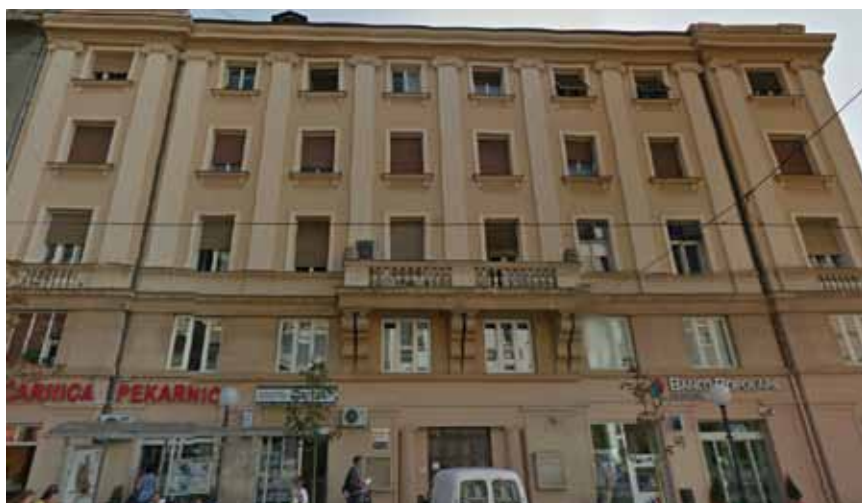
Zgrada u Draškovićevoj ulici u Zagrebu u kojoj je na prvom katu sjedište Hidroprojekt-inga

Djelatnost je organizirana u nekoliko dijelova, poput tehničkih poslova, proizvodnje, mehanizacije, središnjega laboratorija, ekonomskih poslova te općih pravnih i kadrovskih poslova. Viadukt raspolaže s brojnom i raznovrsnom građevinskom mehanizacijom koju sačinjavaju građevinski strojevi različitih namjena, motorna vozila za prijevoz osoba, tereta i za specijalne namjene te raznovrsna postrojenja za proizvodnju i ugradnju asfalta, betona, armirano-betonskih i betonskih elemenata te betonske galanterije. Održavanje se građevinske opreme obavlja preventivno u terenskim radionicama, a remont u centralnoj radionici u industrijskoj zoni