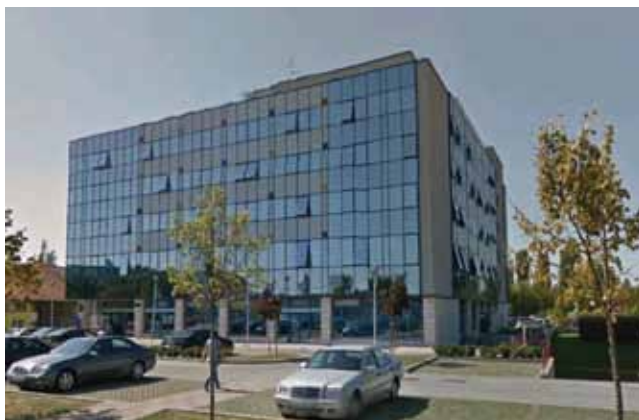
Sjedište Ministarstva znanosti, obrazovanja i sporta

Hrvatske vode su pravna osoba za upravljanje vodama koju je osnovala Republika Hrvatska, a na tu se posebnu pravnu osobu (sui generis) primjenjuju propisi što vrijede za ustanove. Sjedište je te tvrtke u Ulici grada Vukovara 220 u Zagrebu, a voditelj je poslovanja gene-