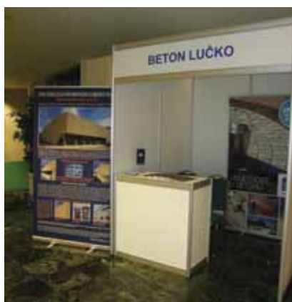
Izložbeni prostor tvrtke Beton – Lučko d.o.o. na Saboru hrvatskih graditelja

dinstvena na tržištu. To je ekonomičan proizvod jednostavan za primjenu, a ujedno ekološki rješava zaštitu od buke. Naime štiti od buke u urbanim sredinama uporabom recikliranih materijala te smanjuje odlaganje otpada i emisije CO 2 . Inovativno rješenje Ruconbara prepoznato je i od strane EU komisije. Naime, ovaj projekt se sufinancira iz EU programa CIP ECO INNOVATION.