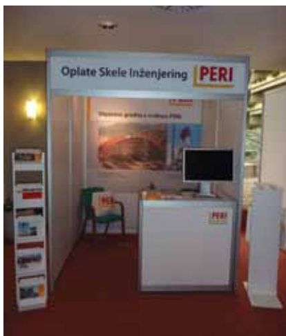
Izložbeni prostor tvrtke Peri na Saboru hrvatskih graditelja

budio je pozornost tržišta patentom za penjajuće i prijenosne oplatne sustave. Peri je djelovao samo na njemačkom tržištu do 1974. kada su osnovane prve dvije tvrtke u Švicarskoj i Francuskoj. Od 1990. poduzeće se strateški širi pa se sada ubraja u 50 vodećih bavarskih tvrtki koje su posljednjih godina ostvarile velik porast prometa i broja zaposlenih. Peri ima 51 tvrtku i 110 proizvodnih lokaliteta na više od 65 nacionalnih tržišta širom svijeta. Sjedište je ostalo u Weißenhornu koji je 170 km udaljen od Münchena.