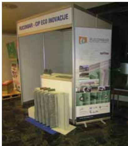
Izložbeni prostor Ruconbara na Saboru hrvatskih graditelja

U prizemlju je bio i štand Ruconbara , proizvoda za zaštitu od buke čiju je izradu koordinirao Građevinski fakultet Sveučilišta u Zagrebu, a bili su uključeni Beton – Lučko d.o.o. , Institut IGH d.d. , Gumilmpex-GRP d.d. i Zoo Zagreb . Ruconbar je proizvod koji vrlo dobro upija buku i za nju je prava ekološka barijera. Sloj za upijanje proizveden je od recikliranih otpadnih guma. Tehnologija proizvodnje laganog betona s recikliranim gumenim granulatom predstavlja inovativnu tehnologiju za proizvodnju kvalitetnih barijera protiv buke koja je je-