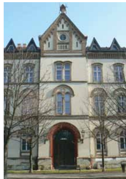
Sjedište Ministarstva graditeljstva i prostornoga uređenja

Ustrojstvene su jedinice: Kabinet ministricе, Samostalna služba za unutar-nju reviziju, Glavno tajništvo, Uprava za graditeljstvo, stanovanje i komunalno gospodarstvo, Uprava za prostorno