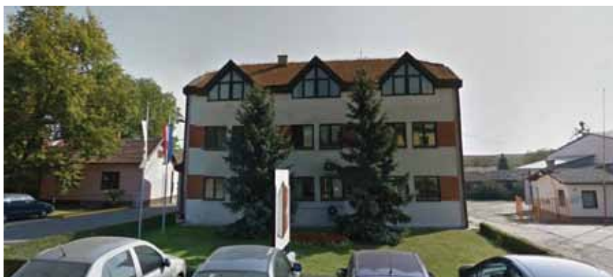
Sjedište Radnika d.d. u Križevcima

Radnik d.d., sadašnja tvrtka za građevinarstvo i građevinska industrija iz Križevaca, vjerojatno je osnovana 1947. Danas Radnik izvodi sve vrste građevinskih radova bez obzira na opseg i složenost, a pritom primjenjuje najsuvremenija dostignuća graditeljske tehnologije.