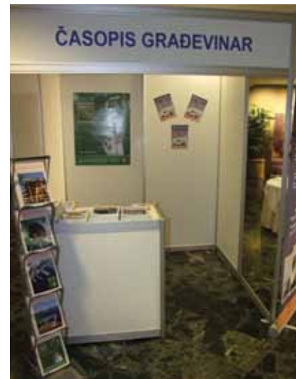
Izložbeni prostor Građevinara na Saboru hrvatskih graditelja

Valja istaknuti da je na posebnom štandu bio predstavljen i časopis Građevinar . Časopis je to s dugogodišnjom tradicijom, a sljedeće godine slavi svoj 65. rođendan. Časopis je mjesečnik, a posljednjih tridesetak godina nije iza-