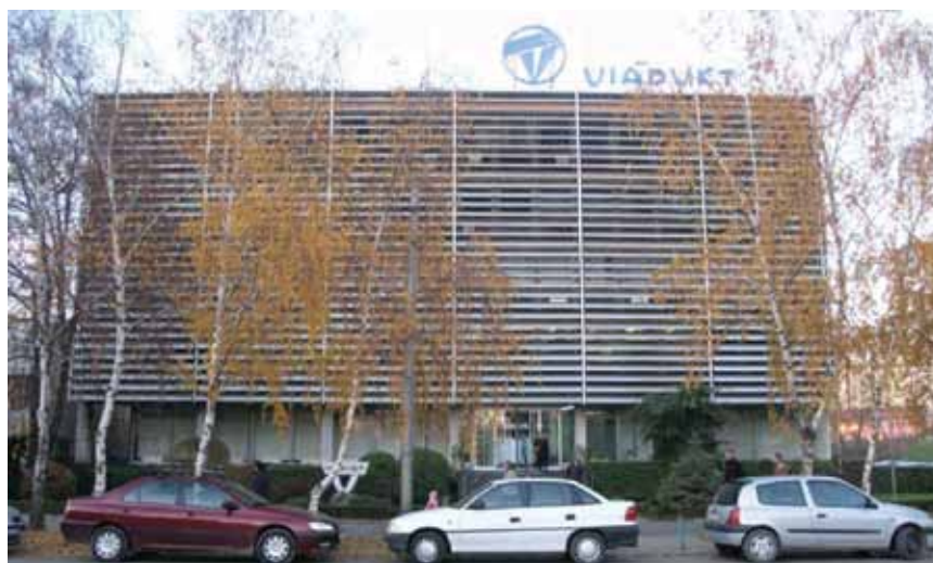
Sjedište Viadukta na početku Kranjčevićeve ulice u Zagrebu