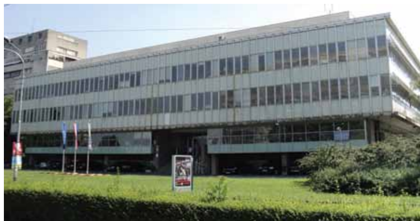
Upravna zgrada Hrvatskih voda u Ulici grada Vukovara u Zagrebu

Hidroprojekt-ing u vlasništvu je svojih zaposlenika, pa poslove vode stručni i specijalizirani inženjeri iz raznih područja, a najveće su poslove, posebno u posljednjem desetljeću obavljali u vodoopskrbi i odvodnji otpadnih voda. Projektirali su velike regionalne vodoopskrbne sustave te izrađivali studije,