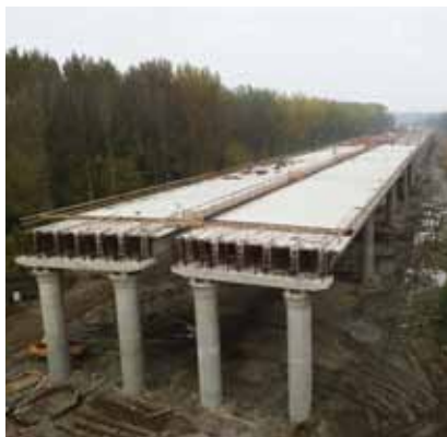
Most preko Drave pokraj Osijeka koji dijelom gradi Hidroelektra Niskogradnja

Hidroelektra je građevinsko poduzeće osnovano 1946. sa sjedištem u Zagrebu, a ubraja se u najpoznatije hrvatske građevinske tvrtke. U procesu je restrukturiranja Hidroelektra d.d. utemeljena pod