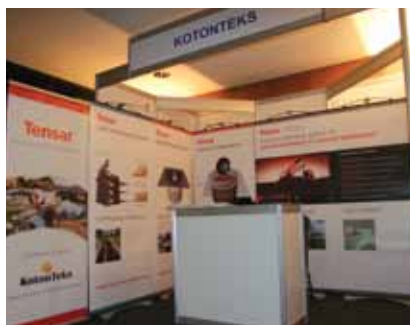
Izložbeni prostor tvrtke Kotonteks d.o.o. na Saboru hrvatskih graditelja