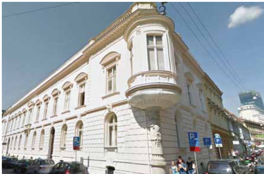
Palača na uglu Berislavićeve i Gajeve u Zagrebu u kojoj je sjedište HSGI-a

Hrvatski savez građevinskih inženjera (HSGI), organizatora i glavnog sponzora svih Sabora hrvatskih graditelja nije potrebno posebno predstavljati. Sa svojih više od 2500 članova najbrojnija je udruga Hrvatskoga inženjerskog saveza i u sadašnjem organizacijskom