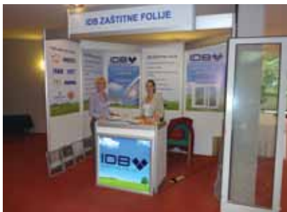
Izložbeni prostor tvrtke DB zaštitne folije d.o.o. na Saboru hrvatskih graditelja

za UV-zaštitu, za zaštitu od pogleda, za zaštitu od zasljepljivanja, za zaštitu od krhotina te dekorativnim folijama i folijama za autoindustriju. Folija za zaštitu od sunca omogućuje da se može uživati u vrućim danima jer ovisno o upadu sunčevih zraka pruža zaštitu od zasljepljivanja i osjetno smanjuje temperaturu u pregrijanim prostorijama. Posebice je to izraženo u stanovima u potkrovlju i s velikim staklenim površinama te u uredskim zgradama s velikim staklenim pročeljima i u zimskim vrtovima. S takvim se folijama dodatno štedi energija i smanjuje potreba za klimatizacijskim i drugim rashladnim uređajima. Postoje i posebna rješenja za poslovne prostorije, muzeje, dječje vrtiće, ordinacije, laboratorije, javne zgrade i uredske komplekse.