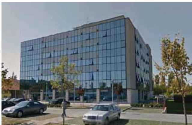
Sjedište Ministarstva znanosti, obrazovanja i sporta

Hrvatske vode su pravna osoba za upravljanje vodama koju je osnovala Republika Hrvatska, a na tu se posebnu pravnu osobu (sui generis) primjenjuju propisi što vrijede za ustanove. Sjedište je te tvrtke u Ulici grada Vukovara 220 u Zagrebu, a voditelj je poslovanja gene-