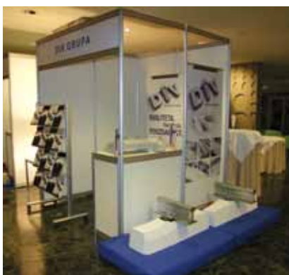
Izložbeni prostor tvrtke DIV d.o.o. na Saboru hrvatskih graditelja

O tvornici vijaka DIV iz Samobora slušali smo često u posljednje vrijeme u vezi s kupnjom Brodogradilišta Split . Inače DIV grupacija je bila srebrni sponzor Sabora hrvatskih graditelja, a posjeduje tradiciju dužu od 120 godina i trenutačno je jedna od vodećih tvornica vijaka u Europi. Naime posluje na osam lokacija u osam država i ima više od 1000 zaposlenih djelatnika. Konstantnim je ulaganjima proširila kapacitete, a uvođenjem novih tehnologija tvrtka se i još razvija pa planira i daljnji rast.