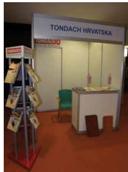
Izložbeni prostor tvrtke Tondach Hrvatska d.d. na Saboru hrvatskih graditelja