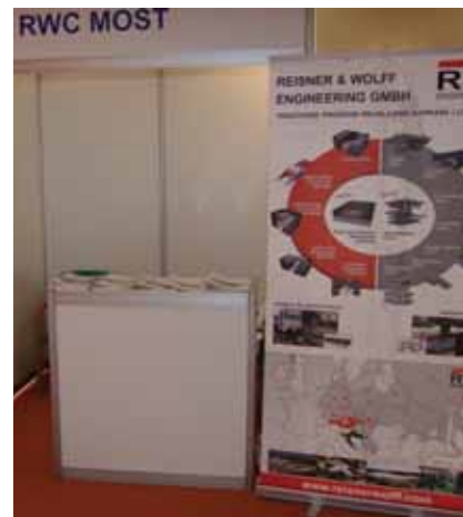
Izložbeni prostor tvrtke RWC most d.o.o. na Saboru hrvatskih graditelja

Reisner & Wolff je 1978. preuzeo i prijelazne naprave tvrtke Rheinstahl AG koja je bila prva prijelazna vodonepropusna naprava profila ( Sustav 3W ), a nakon prestanka proizvodnje čelika i strojeva preuzeo je proizvodnju opreme za mostove pod imenom Reisner & Wolff Engineering (RWE) koji se od 1990. počeo širiti u istočnoj Europi. MAN je 1995. prodao licencu jednoj francuskoj grupaciji koja je potom propala pa je RWE postao središnja europska grupacija