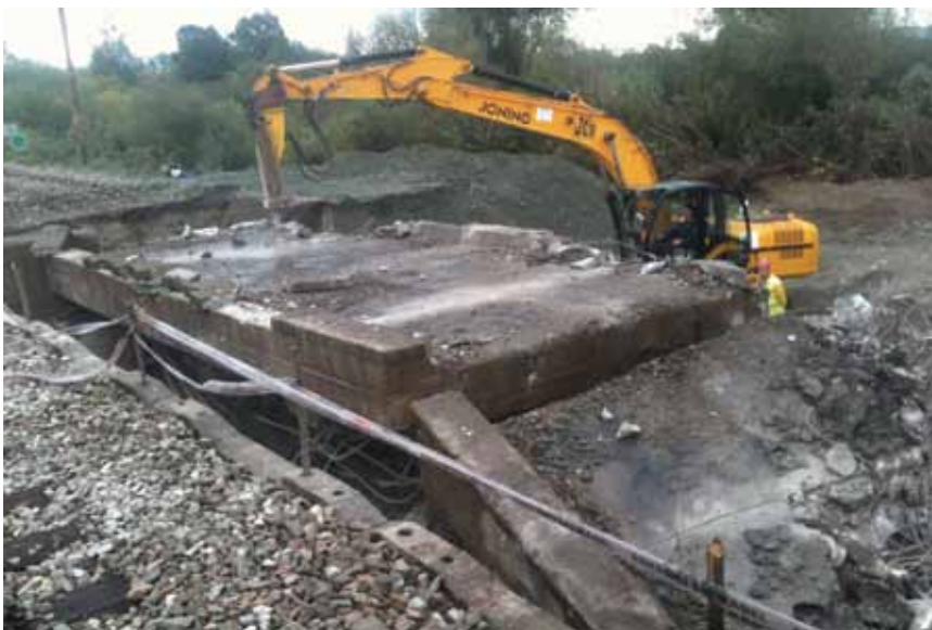
Uklanjanje miniranih ostataka južnog kraka mosta

tonskoj ploči mosta kroz koje se planiralo provući užad za izvlačenje željezničkim dizalicama. Preko privremene konstrukcije promet bi tekao brzinom od 20 km/h, a nakon što se izvuku ploče mosta zatvorio bi se sav promet. Tada su se u što kraćem vremenu trebali demontirati provizoriji i tračnice te ugraditi nasip, pragove i tračnice. Promet bi u početku tekao smanjenom, a potom redovitom brzinom.