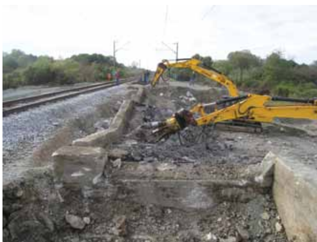
Završetak drobljenje armiranobetonske konstrukcije sjevernog kolosijeka

jeme promet je tekao 20 km/h. Priprema za miniranje započela je u 4 sata ujutro kada je zatvoren promet i isključen napon