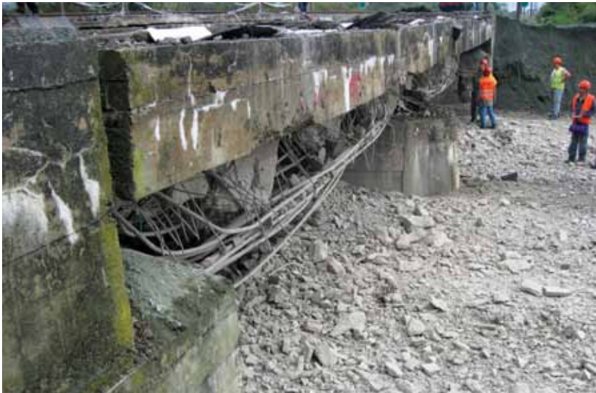
Minirani južni krak mosta