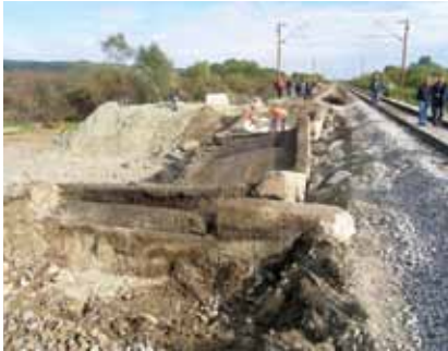
Stanje sjevernog kraka mosta nakon miniranja

njihove dozvole prišli su djelatnici HŽ-a da pregledaju i ocijene moguća oštećenja kolosijeka i kontaktne mreže te dozvole otvaranje prometa. Potom su svi što su brže mogli stigli na minirani most da razgledaju rezultat miniranja.