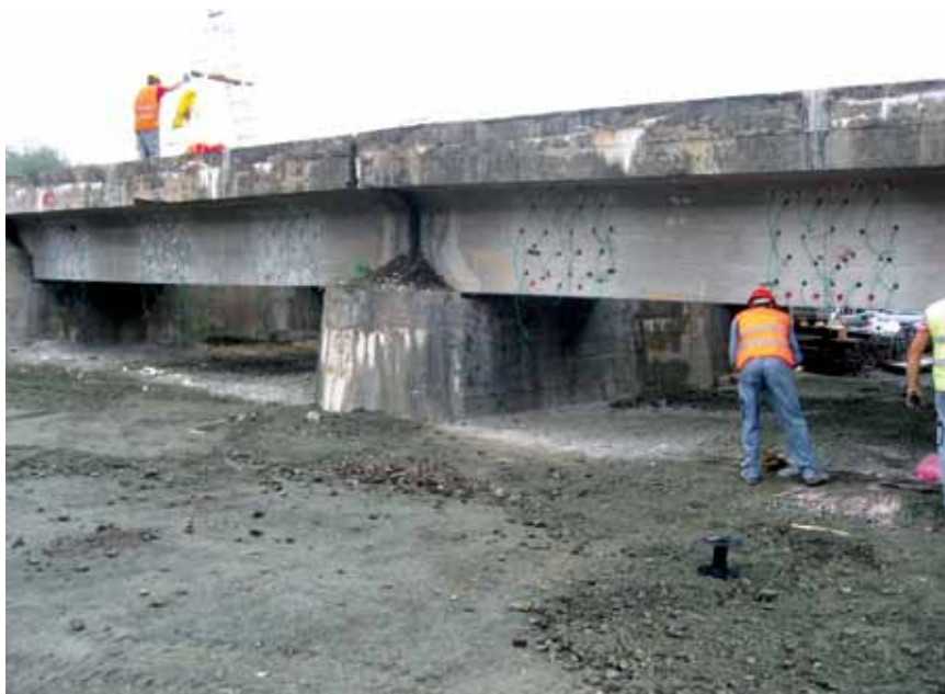
Južni krak mosta pripremljen za miniranje

Stanje mosta zadovoljava kategoriju nosivosti D4 (22,5 t/osovini odnosno 8