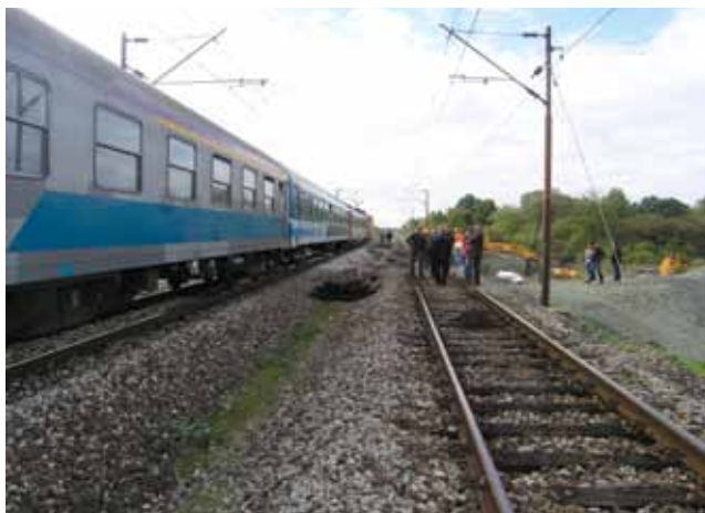
Prolazak prvog vlaka južnim kolosijekom nakon miniranja