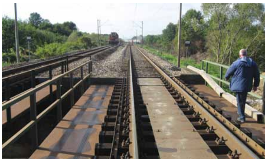
Trenutak nakon eksplozije