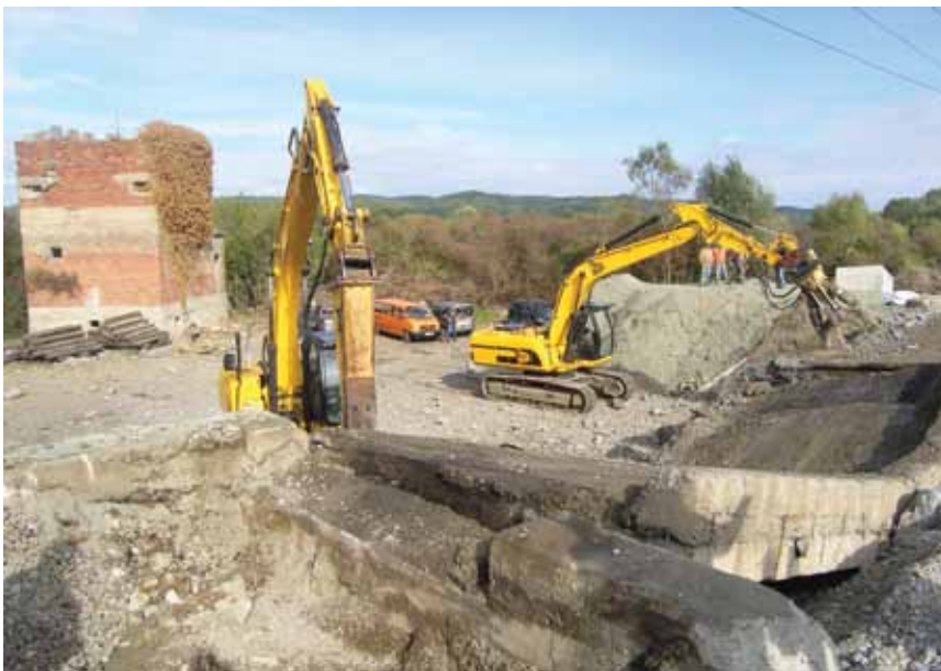
Početak drobljenja armiranobetonske konstrukcije

Velik problem i ovog gradilišta bila je njegova nedostupnost, a to je bio i jedan od razloga zašto su se na kraju odlučili za miniranje jer teški strojevi nisu ni mogli doći na gradilište malim i razrovanim poljskim putovima. Radovi su se i u prvom i u drugom slučaju obavljali u nekoliko etapa. Najprije su pružnim vozilima dovezli potreban materijal za ugradnju u nasip, a potom su tjedan dana prije izbušili rupe za miniranje kako bi pri zatvaranju prometa uštedjeli što više vremena. Cijelo je to vri-