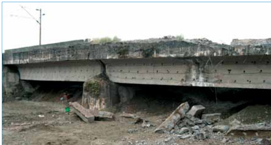
Sjeverni krak mosta pripremljen za miniranje

Povukli smo se na prije spomenuti čelični most Mijure koji je za sve sudionike i znatiželjnike bio svojevrsna promatračnica. Prema tom se čeličnom mostu povuklo i pružilo vozilo s djelatnicima HŽ-a koji su zaduženi za isključivanje napona i uzemljenje kontaktne mreže. Sljedeći su trenuci bili puni iščekivanja kada će se dogoditi eksplozija. Ipak kada se konačno dogodila, dakako da smo je propustili snimiti. Dogodilo se to približno u 14:15 sati. Mnogu su odmah htjeli potrčati do miniranog mosta, ali je ipak trebalo pričekati dok stručnjaci za miniranje sve ne pregledaju radi mogućih neeksploziviranih ostataka. Nakon