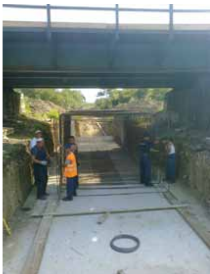
Pripremni radovi za zamjenu čeličnog mosta Mijure

Zbog straha od kašnjenja produžili smo poljskim putem prema mostu koji se minira i koji je udaljen približno kilometar. Usput smo prošli pokraj mosta koji se također kompletno obnavlja. Riječ je o čeličnom mostu Mijure koji je ime vjerojatno dobio po nekom bivšem vodotoku ili bujičnom potoku i koji se nalazi točno na sredini između rijeke Orljave i mosta koji treba minirati. No kako se radi o čeličnom mostu, ovdje je tehnologija zamjene sasvim drukčija. Ispod postojeće čelične konstrukcije gradi se novi armiranobetonski propust koji će se nakon završetka zatrpati nasipnim materijalom do visine čelične konstrukcije. Potom će se tijekom manjih zatvaranja pruge (približno 24 sata) hidrauličkim prešama ukloniti postojeća čelična konstrukcija, dograditi nasip i ponovno ugraditi kolosijek.