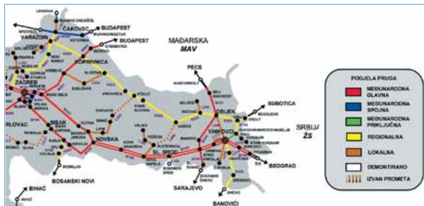
Željezničke pruge na sjeveru Hrvatske s dvokolosiječnom prugom od Novske do državne granice

Trasa od Novske do državne granice sa Srbijom u cijelosti je dvokolosiječna i prema odlukama o razvrstavanju željezničkih pruga (NN 81./06. i 13./07.) ima službeni naziv M105 Novska – Vinkovci – DG, a duga je 185,1 km. Na pruzi je 17 kolodvora i 22 stajališta. Zbog velikih oštećenja za Domovinskog rata na dijelovima se trase vozi tek brzinom od 40 km/h. Najprije je obnovljena kontaktna mreža i željezničko-cestovni prijelazi u razini. Početkom 2012. puštena je u promet obnovljena dionica pruge Vinkovci – Tovarnik, duga 33,5 km i vrijedna gotovo 60 milijuna eura (u financiranju je sudjelovala i Europska Unija), tako da je taj dio ponovno osposobljen za najveću dopuštenu brzinu. Rekonstrukcija dionice Novska – Okučani, koja je također teško stradala u Domovinskom ratu, započeta je ove godine i trebala bi biti završena do kraja 2013. Rekonstrukcija obuhvaća obnovu i modernizaciju 16,8 km pruge te rekonstrukciju kolodvora