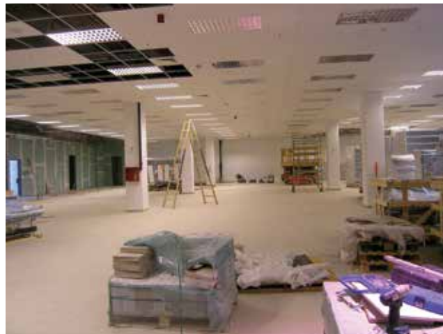
Prostor za buduće trgovačke sadržaje

meta, čak to nisu osjetili ni u posljednje vrijeme kada se Strossmayerova ulica rekonstruira. Ugovor o gradnji inače predviđa i hortikulturno uređenje okoliša, a ukupna je ugovorena cijena građevinskih radova 33 milijuna kuna bez PDV-a.