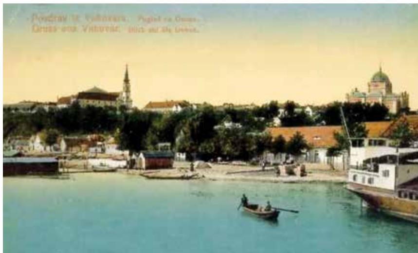
Vukovar s početka 20. stoljeća – u prednjem planu dio grada gdje je izgrađen nasip i glomazne građevine poput Name

Moramo priznati da smo se u svojim izvještajima o vukovarskoj obnovi najviše koncentrirali na obnovu tzv. Novog Vukovara. Naime današnji se Vukovar, uz prigradska naselja koja su se potpuno spojila s gradom (Mitnica, Sajmište, Lužac...), sastoji od tri dijelom odvojene i prepoznatljive cjeline koje su nastajale u različitim vremenima – Stari Vukovar, Novi Vukovar i Borovo naselje (do Domovinskog rata samostalno).