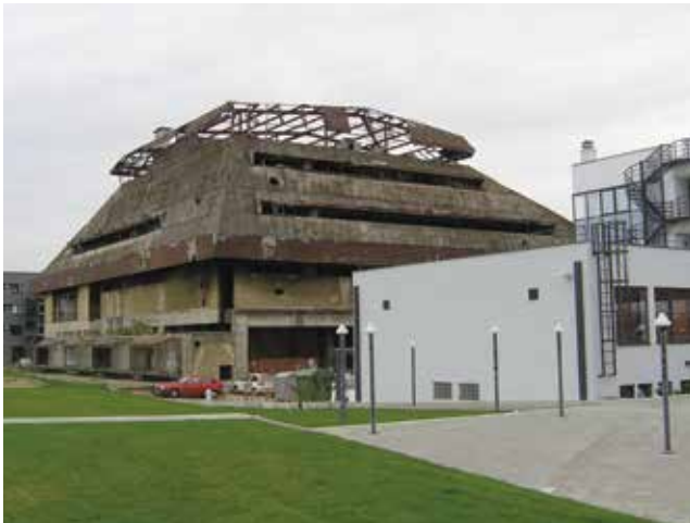
Zgrada Name snimljena za gradnje hotela Lav 2008. godine