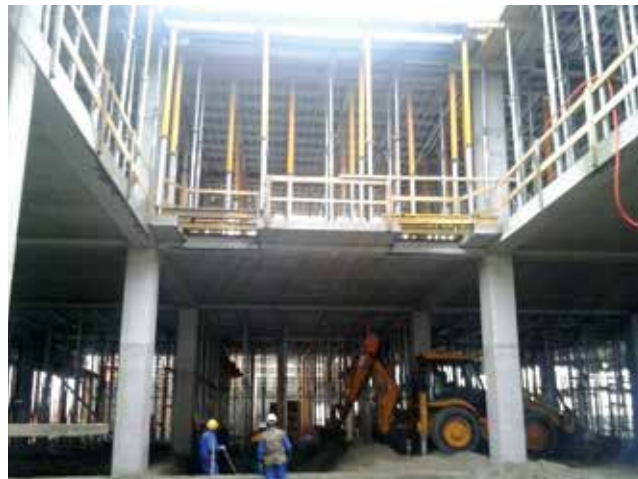
Radovi na gradilištu u studenom 2012.