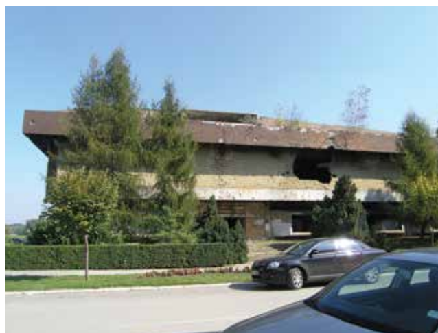
Pogled na Namu iz ulice Josipa Jurja Strossmayera