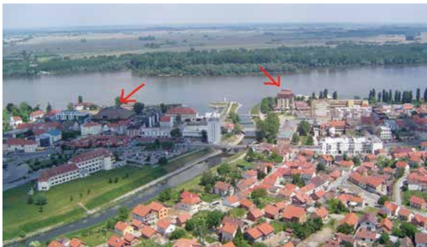
Pogled iz zraka na ušće Vuke – devastirana zgrada Name (lijevo) i hotel Dunav (desno)

Nakon oslobođenja grada 1687. preostalo je naseljeno tek pedesetak kuća, a od starog naselja uglavnom nije bilo ni tragova. Tada se u opustošeni vukovarski kraj počelo naseljavati starosjedilačko i novodoseljeno hrvatsko stanovništvo, a u neka su opustjela mjesta došli i pravoslavni Srbi. Tijekom 18. i 19. st. doselio se i veći broj Nijemaca, a potom i Mađara, Židova, Rusina, Slovaka, Ukrajinaca... Vukovar postaje sjedište goleme Srijemske županije između Dunava i Save koja se protezala od Osijeka do Zemuna. Velike posjede dobivaju ili kupuju brojni feudalci, a grofovi Eltz, pripadnici njemačkog praplemstva, postaju vlasnici vukovarskog vlastelinstva i grade raskošan dvorac na lijevoj obali Vuke. Tako u 18. st. Vukovar postaje dvojni grad koji tvore zbijeni stari dio na