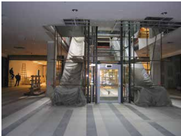
Pokretna su stubišta u prizemlju već ugrađena