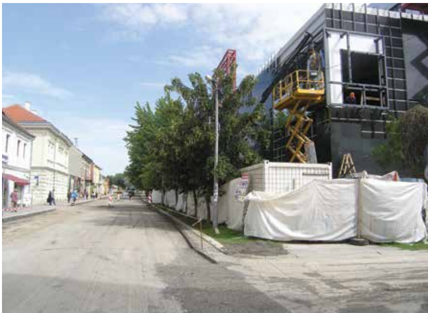
Rekonstrukcija ulice Josipa Jurja Strossmayera i novi trgovački centar

Prije početka sastanka svi su se njegovi sudionici prošetali novom zgradom. Zaključili smo da je veći dio radova već