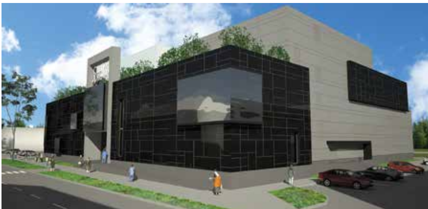
Prikaz novoga trgovačkog centra s dunavske strane

težnu trgovačku namjenu, a posjedovat će manji trgovački centar s prodavaonicom robe dnevne potrošnje, lokale koji će biti izgrađeni do određenog stupnja gotovosti, ugostiteljske sadržaje i kinodvorane. Zapravo će se u skladu s europskim uzorima prodavati sve vrste roba prehrambenog i neprehrambenog asortimana, bez zapaljivih tekućina i plinova. Tako će u prizemlju biti prodavaonica robe dnevne potrošnje sa skladištem i