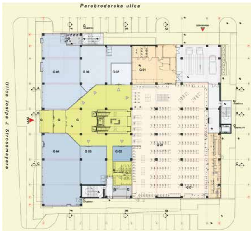
Tlocrt novoga trgovačkog centra na mjestu negdašnje Name

Građevina je bila samostojeća katnica (P + 3 i s dodatnom etažom za strojarnicu) kvadratnog tlocrta i monolitne okvirne betonske konstrukcije. U rasteru od 8,2 x 8,2 m bili su izvedeni armiranobetonski stupovi (50 x 50 cm), a na njih su se oslanjale glavne grede u oba smjera. Na njih su se potom oslanjale i