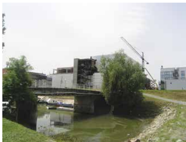
Novi će se centar skladno uklopiti u okoliš