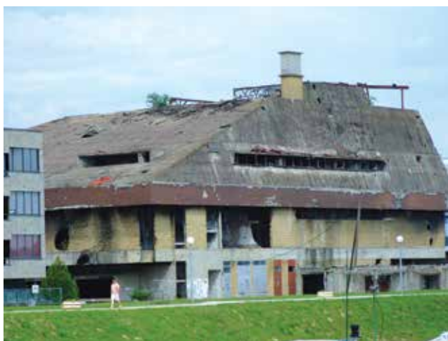
Zgrada Name s dunavske strane

Temeljito prateći obnovu okolnih zgrada, od Hrvatskog doma , preko Ružičkine rodne kuće (s druge strane ulice), novoga obližnjega hotela Lav , zgrade Agencije za plovne putove na Otoku športova te dugotrajnu obnovu nedalekog dvorca Eltz, sa zebnjom se nametalo pitanje kada će oštećeno i glomazno "ruglo" od Namine zgrade konačno doći na red. Valja reći da je za cijeli blok tih zgrada bila važna gradnja zgrade Bloka 21 A za stradalnike Domovinskog rata, arhitekata Vinka Penezića i Krešimira Rogine, inače nagrađena i godišnjom nagradom Vladimir Nazor kao najbolje arhitektonsko ostvarenje u Hrvatskoj za 2002. Ta zgrada s jugoistočne strane omeđuje Namu (sa sjeverne je hotel Lav , sa zapadne Strossmayerova ulica, a s istočne Dunav odnosno zimovnik za čamce), a Vukovarci je zbog dominantne boje pročelnog stakla i stanarske populacije nazivaju Crnom udovicom . Može se reći da tu zgradu građani Vukovara baš i ne vole previše, a razlog je vjerojatno u tome što je odviše smjela za barokno i neoklasicističko okruženje, ali možda i zbog izvedbenih i projektantskih manj-