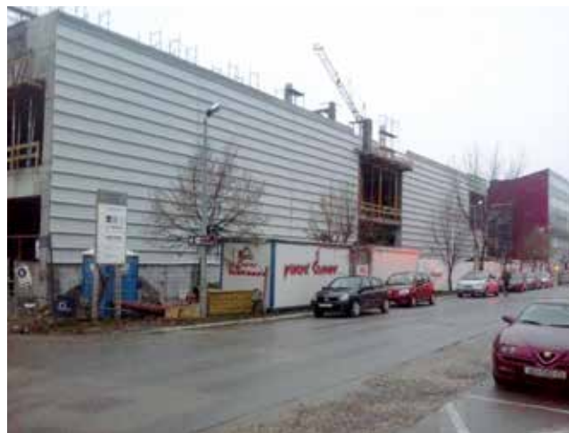
U siječnju 2013. se već počela postavljati potkonstrukcija pročelja