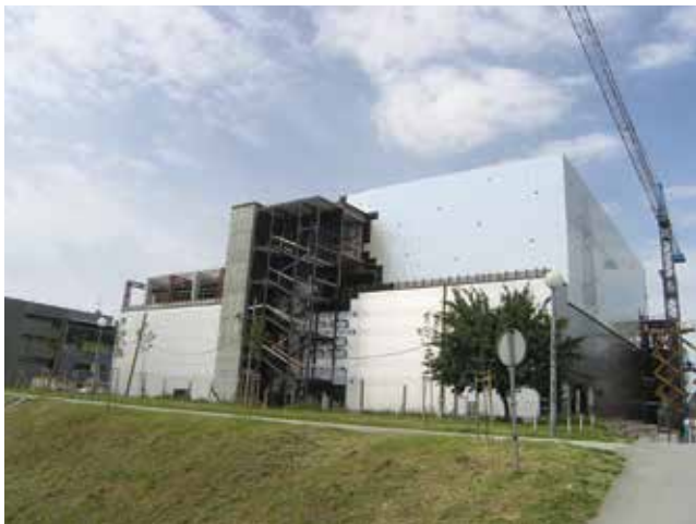
Pogled na gradilište novoga trgovačkog centra s Otoka športova