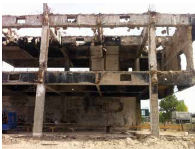
Ogoljeli ostaci okvirne konstrukcije