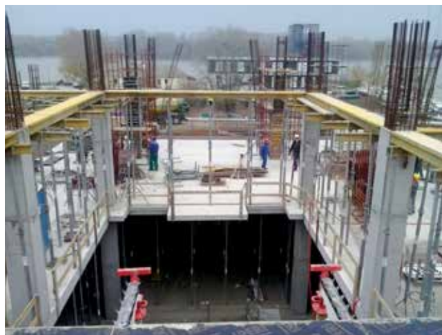
Radovi na prvom katu s Dunavom u pozadini

Sadašnji su trgovački centri znatno fleksibilniji i prilagodljiviji jer se i način prodaje uvelike promijenio. Još do prije dvadesetak godina kupovali smo u kvartovskim prodavaonicama, sada su se svi naviknuli na kolica, a za petnaestak godina možda ćemo sve što poželimo dobivati izravno na kućnu adresu. Stoga će možda praksa nadživjeti sadašnje trgovačke građevine,