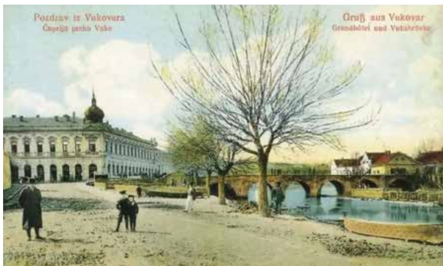
Razglednica središta Vukovara sa starim mostom preko Vuke

No zato je druga polovina 19. st. bila zlatno doba vukovarske povijesti. Tome je pridonijelo uvođenje parobroda pa je Vukovar imao redovitu vezu s Budimom i Bečom te Rumunjskom, a vukovarska je luka postala važna uvozno-izvozna postaja. Izrađena je prva katastarska