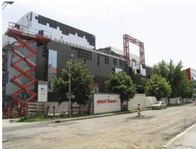
Gradnja glavnog pročelja novoga trgovačkog centra

pa se stoga projektiraju i grade tako da se po potrebi mogu prenamijeniti. Amortizacija je takvih građevina znatno manja nego u stanogradnji, pa se stoga projektira i gradi mnogo jeftinije, a primjenjuju se i jeftiniji materijali. A upravo je najteže projektirati i graditi što jeftinije, a pritom zadržati potpunu funkcionalnost.