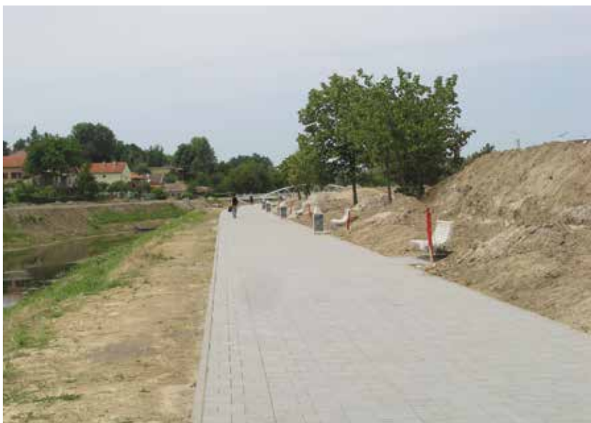
Staza uz Vuku prema novome pješačkom mostu

Naknadno smo doznali da je grad raspisao natječaj s visokim novčanim nagradama za naziv novoga trgovačkog centra. Čini se da je gradu, u kojem je osim zgrada bilo potpuno poharano i gospodarstvo, postojala potreba za jednim takvim sadržajem kojim se konačno i zaključuje obnova tog dijela središta grada. Uočili smo da svi s ponosom ističu činjenicu da je Vukovar jedini grad između Slavonskog Broda i Osijeka koji će imati suvremena Cinestar kina. Ponos uopće ne iznenađuje jer je taj lijepi grad na Dunavu i prije u svemu prednjačio, posebno u gospodarstvu te komunalnoj infrastrukturi i urbanističkom uređenju. Uostalom svoju je posebnost do kraja iskazao i u Domovinskom ratu.