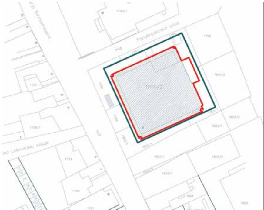
Tlocrt zgrade Name na katastarskoj podlozi

Kao što je poznato robnu su kuću Nama u Zagrebu osnovali austrijski trgovci češkog podrijetla Carl Kastner i Herman Öhler koji su 1873. otvorili prvu robnu kuću u češkom gradu Opavi (njem. Troppau). U Zagreb su stigli 1883. (u Graz gdje je sada sjedište tvrtke K&Ö tek 1887.) i bili su najprije u Ilici na broju 50. Nakon što su promijenili nekoliko adresa konačno su došli na priželjkivano mjesto, u Ilici na broj 4, u prizemlje hotela K caru austrijanskom . Nekoliko su godina bili u najmu, a potom su otkupili cijelu zgradu. Nakon što su uspješno zadržali svoje poslovanje tijekom I. svjetskog rata, uspjeli su 1928. trgovinu proširiti na sva četiri kata zgrade i potpuno preurediti pročelje, a nedugo potom proširili su se i na susjedni ho-