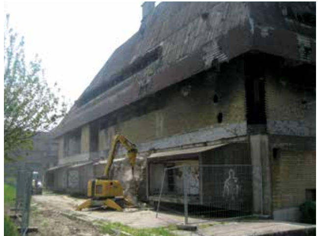
Početak rušenja vukovarske Name