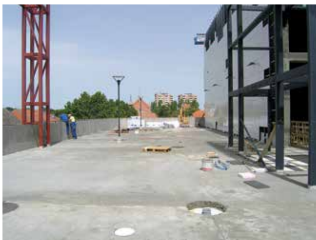
Terasa novoga trgovačkog centra s dvorcem Eltz u pozadini