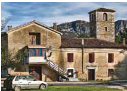
Ostaci pavlinskog samostana u zaselku Kloštar naselja Polje Čepić

svjetovni dio. Taj je dio Čepića nazvan prema "purgerima" (od njem. burger – pripadnik plemstva i građanstva njemačkih slobodnih kraljevskih gradova) koji su uz obale jezera i po okolnim padinama tijekom 15. i 16. st. podigli niz utvrđenih ljetnikovaca.