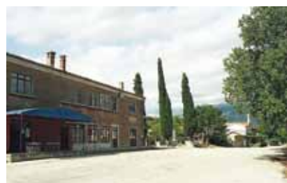
Središte naselja Polje Čepić

Diotalevo iz talijanskoga grada Riminija koja je srušila stari kaštel i na istom mjestu podignula novi. Ipak i taj je kaštel teško stradao u Uskočkom ratu početkom 17. st. pa je temeljito obnovljen u baroknom stilu. Premda su posljednji ostatci kaštela uklonjeni pri isušivanju jezera u tridesetim godinama prošloga stoljeća (kamen je navodno iskorišten za gradnju okolnih cesta i mosta na Raši), izgled mu se može rekonstruirati prema Valvasorovoj veduti iz 1680. kada je bio u vlasništvu obitelji Auer-sperg, gospodara susjednog Kožljaka.