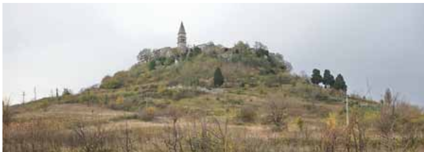
Pogled s juga na utvrđeni Pićan

Pićan je svoj status zadržao i nakon pada pod franačku vlast krajem 8. st., da bi se u 9. i 10. st. razvio u bogatu gradsku općinu koja se spominje u zaključcima Rižanskoga sabora. Za vladavine njemačkog kralja i rimsko-njemačkog cara Otona III. (983.-1002) došao je pod vlast akvilejskih patrijarha, koji su u 12. st. pićanski feud dodijelili grofu Meinhardu ili Menhardu Schwarzenburgu iz Crnoga grada, utemeljitelju Pazinske knežije, a zatim njegovim rođacima grofovima Goričkim.