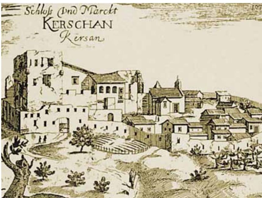
Kršan na prikazu J. W. Valvasora

Nasuprot općinskoj kući i u sjeveroistočnom uglu utvrđenoga grada nalazi se kaštel koji je dijelom izgrađen na