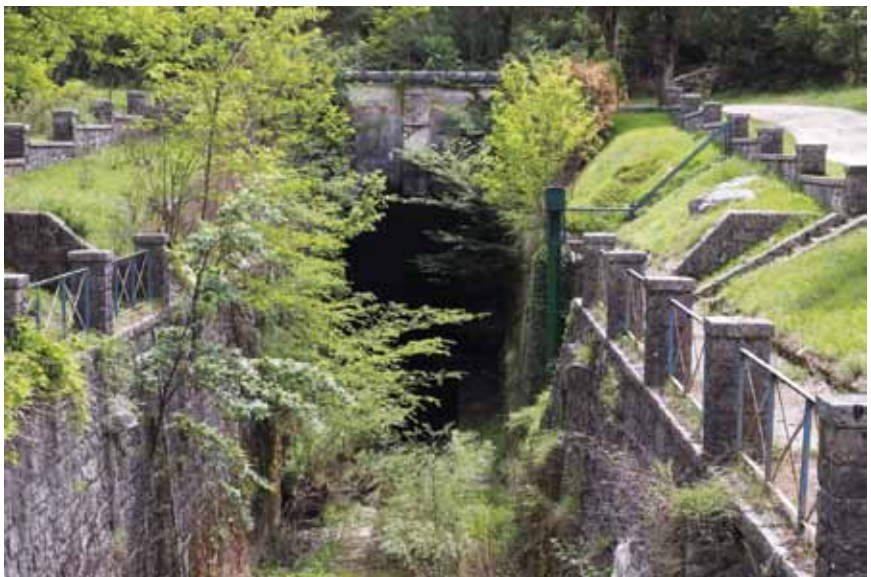
Ulaz u tunel između Kožljaka i Kršana

bilo obraslo trstikom i šašem te bogato ribama (posebno jeguljom i šaranom) i ptičjim vrstama (divlja patka, bijela roda, labudovi i sl.), ali su poslije malarični komarci uzrokovali bolesti i smanjivanje okolnoga stanovništva.