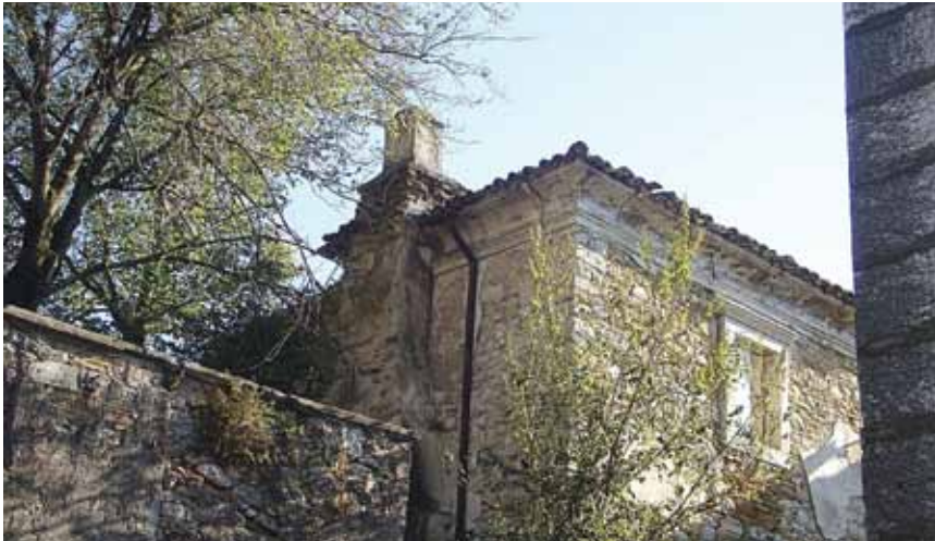
Detalj iz Pićana

Ipak liturgijska je srebrnina relativno skromna, a u crkvi je sedam srebrnih visećih svijećnjaka (kandila) koji potječu iz mletačkih radionica 18. st., a u sakristiji i župnom dvoru su četiri kaleža iz istog izvora. Najvrjedniji su liturgijski predmeti pozlačeni ostenzorij iz 16. st., križ-relikvijar germanske proizvodnje iz 16. st. i dvostruke posudice za sveto ulje. Valja svakako istaknuti da je Pićana bogat mnogim legendama, a najzanimljivije su one povezane sa sv. Niceforom, zapravo s dva sveca istog imena. Jedan je prvi pićanski biskup (vjerojatno od 524.), a drugi mučenik iz 3. st. i oba se u Pićanu zajednički slave 30. prosinca. Prema legendi Nicefor mučenik je prvokršćanski svetac iz Antiohije koji je pogubljen za Valerijanovu progona kršćana. Navodno je car Konstantin Veliki svečeve tjelesne ostatke stavio na lađu i naredio da se svecu izgradi i