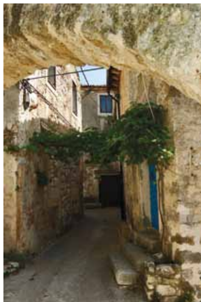
Jedna plominska ulica

renesansnom i zemljom ispunjenom platformom za topove. Gradska je loža manja jednokatna barokna građevina pravokutnog tlocrta, izgrađena 1650. na sjeverozapadnoj strani u produžetku župne crkve. Sastoji se od arkadno otvorenog prizemlja i prostorija na kat.