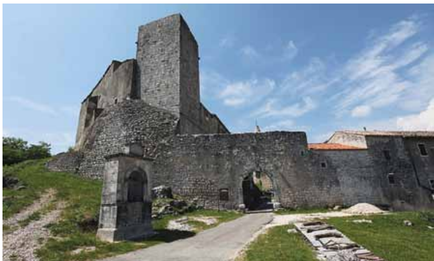
Ulaz u utvrđeni Kršan

Samostan su i crkva poslije često mijenjali gospodare, tako su ipak u relativno dobrom stanju sačuvani u zaseoku Kloštru koji je tako i dobio ime. Tipičan je to pavlinski samostan s crkvom, gotičko-renesansnim zvonikom i tri jednokatna samostanska krila s klaustrom koja okružuju dvorište s cisternom. U prizemlju je hodnik klaustra otvoren s tri luka, a na katu s pet manjih. Crkva je uoči II. svjetskoga rata srušena do visine prizemlja i na nju su nadograđene dvije etaže za veliku stolarsku radionicu pa joj je danas očuvano samo pročelje. U zaselku Kloštru nalazio se tzv. crkveni dio Čepića, a u susjednoj Purgariji