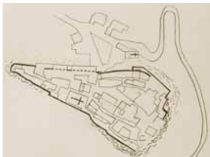
Tlocrt gradića Pićana