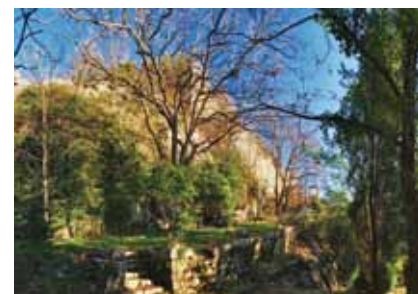
Ruševine kaštela Kožljak

Na zapadnu se stranu gradske jezgre naslanja veliko utvrđeno podgrađe čiji obrambeni zidovi okružuju tri umjetne terase međusobno povezane strmim stubištima. Obrambeni je zid podgrađa najbolje očuvan na donjoj terasi, gdje