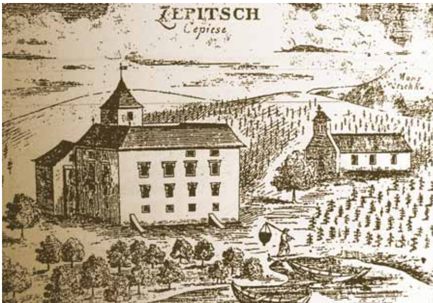
Kaštel u Čepiću na prikazu J. W. Valvasora

svjetovni dio. Taj je dio Čepića nazvan prema "purgerima" (od njem. burger – pripadnik plemstva i građanstva njemačkih slobodnih kraljevskih gradova) koji su uz obale jezera i po okolnim padinama tijekom 15. i 16. st. podigli niz utvrđenih ljetnikovaca.