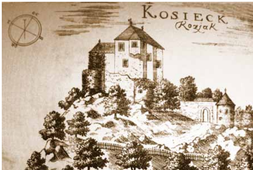
Kožljak na veduti J. W. Valvasora