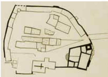
Tlocrt grada Kršana

Poslije se kao gospodari spominju de Fini, Auersperg, Rampelli, Benvenuti dell Argenti i Josip de Sussani koji je 1850. u kršanskom kaštelu pronašao kršanski prijepis Istarskoga razvoda