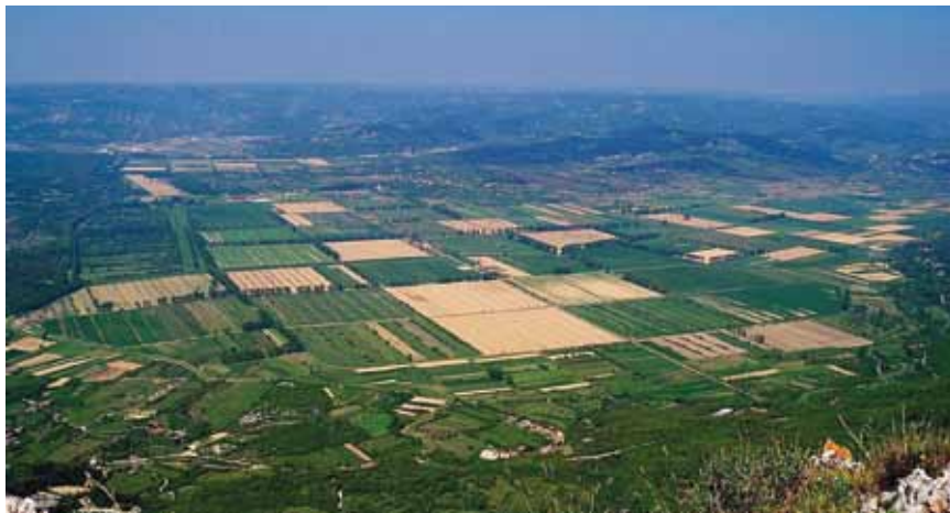
Panoramski snimak Čepičkog polja

djelstvu i stočarstvu. Valja ipak dodati da se u posljednje vrijeme razmišlja o stvaranju novoga manjeg jezera za navodnjavanje na najnižem dijelu polja, na retenciji odnosno rezervnom akumulacijskom prostoru koji služi za obranu od poplava [1].