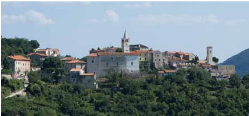
Plomin snimljen sa zapada

naselja svjedoči i prapovijesna gradinska urbanistička struktura koju je preuzelo i srednjovjekovno naselje. Riječ je o tipičnome istarskome srednjovjekovnom gradiću nepravilna elipsoidnog tlocrta koji je opasan srednjovjekovnim (13.-14. st.) i renesansnim (16.-17. st.) obrambenim zidovima. Danas su sačuvani tek manji dijelovi na tri strane gradića, a preostalo je srušeno u 18. i 19. st. ili uklopljeno u okolne stambene kuće. Kroz cijelo naselje vijuga dugačka ulica na koju se spajaju brojni poprečni prolazi i uličice s nizovima renesansnih i baroknih zgrada.