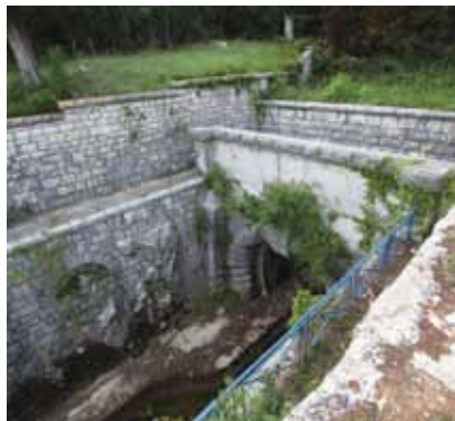
Tunelski portal u Plominu

To se isušeno jezero nalazi u jugoistočnoj Istri, u podnožju zapadnog i u jugozapadnog dijela planinskoga masiva Učke. Dno je polja blago nagnuto, a najniža je točka polja na 24 m n. v., u južnom dijelu udoline nedaleko od Kožljaka, na mjestu gdje je prirodno ponirala rječica Boljunčica (Boljunščica). Boljunčica je u ledenom dobu nanosima začepila prirodni ponor i polje pretvorila u jezero (odatle valjda nazivi jezera i polja) u kojem se voda znala zadržavati i tijekom cijele godine. Površina je jezera varirala je od 5,4 do 8,6 km 2 , dubina od 1 do 2,5 m, a za najvišeg je vodostaja voda otjecala u rijeku Rašu. Jezero je