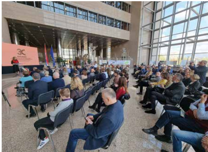
Sudionici proslave u prostoru Nacionalne i sveučilišne knjižnice

stvom prvog ravnatelja Tomislava Brodarića i uz koordinaciju Zlatka Dražetića nad stručnim timom Zavoda i timom vanjskih suradnika Zagrebačka županija je u veljači 2002. donijela prvi Prostorni plan Županije.