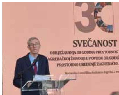
Župan Zagrebačke županije Stjepan Kožić

ma dostupni građanima do razine njihove čestice. U proljeće 2025. Zavod je izradio svoj prvi prostorni plan u cijelosti izrađen u novome sustavu ePlanovi, a riječ je o Trećim izmjenama i dopunama Prostornog plana uređenja za Općinu Pokupsko.