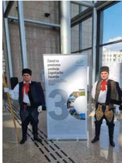
Detalj s proslave u Nacionalnoj i sveučilišnoj knjižnici

prostoru Zagrebačke županije te izvješća za gradove i općine.