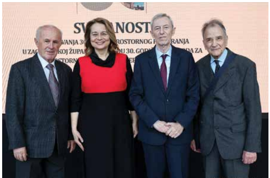
Bivši ravnatelji, sadašnja ravnateljica Zavoda za prostorno uređenje Zagrebačke županije sa županom Zagrebačke županije

Prostorni planeri vjeruju da se susret urbanog i ruralnog najbolje uočava na primjerima bogate kulturno-povijesne baštine, na primjerima ruralnih i manjih gradskih cjelina, od kojih su neki predstavljeni na izložbi. Za glazbeni dio svečanosti pobrinuli su se Martin Kosovec koji je izveo dvije pjesme i Matej Kruljac, učenik 6. razreda osnovne škole i 4. razreda Glazbenog odjela Osnovne škole Stjepana Basaričeka u Ivanić-Gradu.