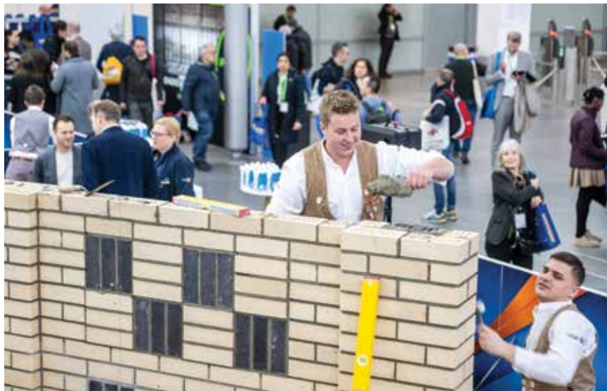
Demonstracije novih građevnih proizvoda i tehnika gradnje

na površini od 27.665 m 2 , zapošljavaju 50 radnika i stručnjaka. Asortiman proizvoda uključuje vanjsku stolariju poput prozora, balkonskih vrata, podizno-kliznih i otklopno-kliznih stijena u izvedbi drvo-drvo i drvo-aluminij te grilje, škure i rolete. Također, proizvode ulazna vrata od Variopur panela te unutarnja vrata od masivnog drva ili furnira. Niskoenergetski prozori i klizne stijene ispunjavaju visoke standarde zapadnoeuropskog tržišta, a većina proizvodnje izvozi se osobito na zahtjevna tržišta poput Austrije, Njemačke i Švicarske.