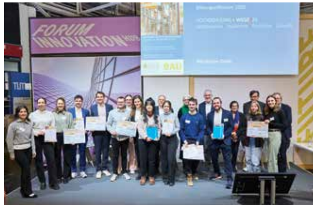
Zajednička fotografija dobitnika stručnih priznanja i nagrada