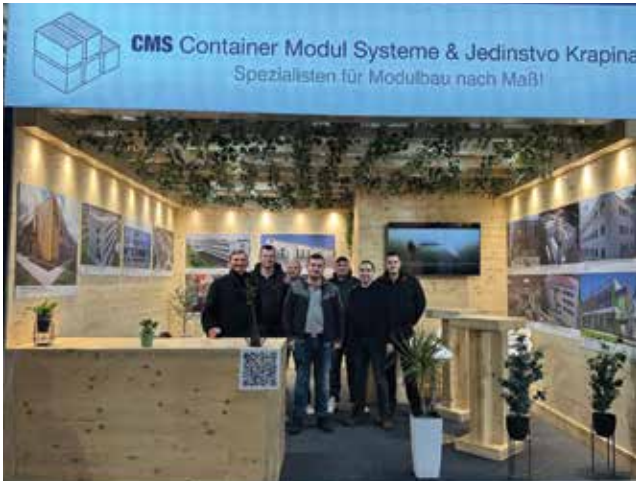
Izložbeni štand hrvatskih izlagača (Jedinstvo Krapina)