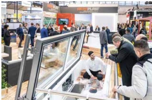
Posjetitelji sajma dobili su uvid u inovativna rješenja i tehnologije