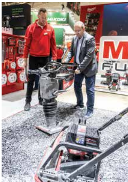
Demonstracije novih građevinskih proizvoda i tehnika gradnje

među kojima su većinom bili građevinski stručnjaci i arhitekti, istraživali su inovacije i trendove koje je predstavilo 2230 izlagača. Taj broj također bilježi lagani pad u odnosu na 2260 izlagača s prošlog sajma. Iako je trajanje ovogodišnjeg sajma skraćeno za jedan dan u odnosu na BAU 2023., posjetilo ga je više od 180.000 posjetitelja. To je nešto manje u usporedbi s prethodnim izdanjem, kada je broj posjetitelja iznosio 190.000. S druge strane, broj zemalja sudionica porastao je na 58, što je znatan skok u usporedbi s 49 zemalja koje su sudjelovale na BAU 2023.