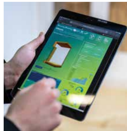
Jedan paviljon u cijelosti je bio posvećen digitalnim rješenjima u graditeljstvu

Tvrtka Lokve d.o.o. osnovana je 1952., a prvotna djelatnost bila joj je prerada drva u pilani. Godine 1973. počela je proizvodnja drvenih prozora, a 1994. prešla je u stopostotno obiteljsko vlasništvo, u koje su uključene tri generacije. Godine 2001. predstavili su prvi drvo-aluminijski prozor, a 2012. prozore za niskoenergetsku i pasivnu gradnju. Danas je tvrtka vodeći proizvođač drvenih i drvo-aluminijskih prozora u Hrvatskoj. Ima više od 120 zaposlenih. Proizvodni pogon prostire se na 15.000 m 2 , a tvrtka ima više od 70.000 m 2 zemljišta.