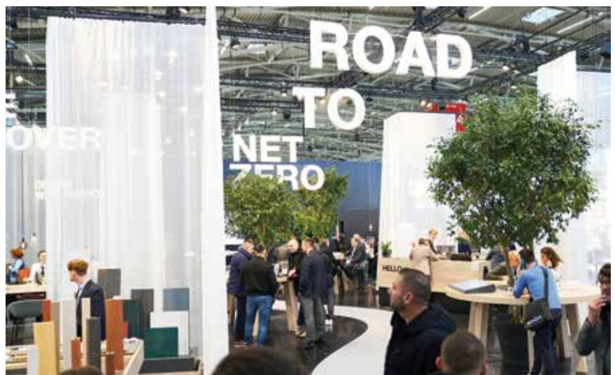
Jedna od ključnih tema bila je klimatski prihvatljiva gradnja

žnje, visokih troškova energije i manjka kvalificirane radne snage, vodeći svjetski sajam arhitekture, materijala i sustava BAU, održan od 13. do 17. siječnja 2025. u Münchenu, poslužio je kao ključni orijentir za sektor građevinarstva. Njemačko gospodarstvo