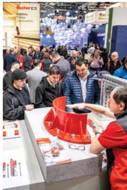
Detalj izložbenog prostora

Tvrtka KAZ d.o.o. aktivna je na tržištu od 1992. te se od tada bavi saniranjem kapilarne vlage na području Republike Hrvatske i šire. Dugogodišnje iskustvo stručnih zaposlenika u sanaciji vlage osigurava visoku kvalitetu radova. Tvrtka posjeduje modernu mehanizaciju i opremu te nudi ovjereno jamstvo za izvedene radove i materijale.