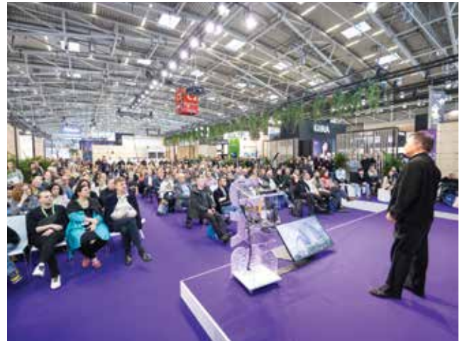
Na sajmu su održana zanimljiva stručna predavanja

Tvrtka Eutherm bavi se proizvodnjom visokokvalitetnih aluminijskih ulaznih vrata, koja se mogu izrađivati po mjeri te prema individualnim zahtjevima kupaca. Sjedište tvrtke je u Vinkovcima.