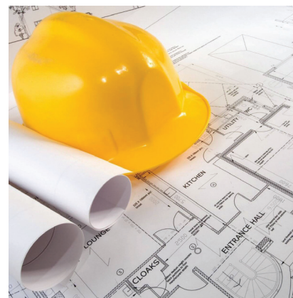
Neuobičajeno niske cijene ugrožavaju održivost građevinskih projekata

U praksi se vrlo rijetko traže objašnjenja neuobičajeno niske cijene pa se zato predlaže da naručitelji više koriste dane zakonske mogućnosti provjere cijene. Dodatno, problematika nuđenja sve nižih cijena usluga to je veća ako se zna kako su istodobno cijene građevnog materijala znatno porasle. Zato kalkulacije troškovnika pri pripremi ponude do početka operativnog rada na projektu, zbog odmaka vremena, više nisu održive.