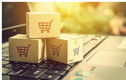
Složene procedure javne nabave otežavaju izbor optimalnog pružatelja usluga u graditeljstvu

Zakonom o javnoj nabavi propisano je kako relativni ponder cijene ili troška u odnosu na kvalitetu, odnosno tehničku sposobnost, ne smije biti veći od 90 %. Dakle, omjer je fleksibilan do 90 %. Zato bi, a kako bi se neizravno smanjio potencijalni dumping cijena, naručitelji trebali češće primjenjivati taj mehanizam tako da je ponder tehničke sposobnosti što veći u odnosu na cijenu jer to osim smanjivanja potencijalnog dumpinga primarno donosi veću kvalitetu usluge. Naprimjer, omjer već od 60 % u odnosu na 40 % u korist tehničke sposobnosti umanjio bi utjecaj dampinških ponuda na ishod odabira ponuditelja.