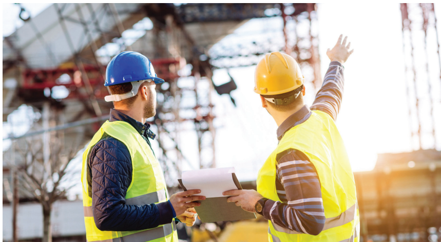
Potrebno je vrednovati reference suradnika kako bi se omogućilo ravnopravno natjecanje mladih inženjera

Problem provjere referenci osobito je izražen u slučajevima kada je referenca iz zemlje koja nije članica EGP-a ili nema trgovinski sporazum s EU-om. Naručitelji na raspolaganju imaju mogućnost raspisivanja dokumentacije o nabavi tako da napišu da se kao reference priznaju samo one s teritorija zemalja EGP-a i onih s trgovinskim sporazumom. Time bi se povećala transparentnost referenci ponuditelja i naručitelju olakšala provjera istinitosti referenci.