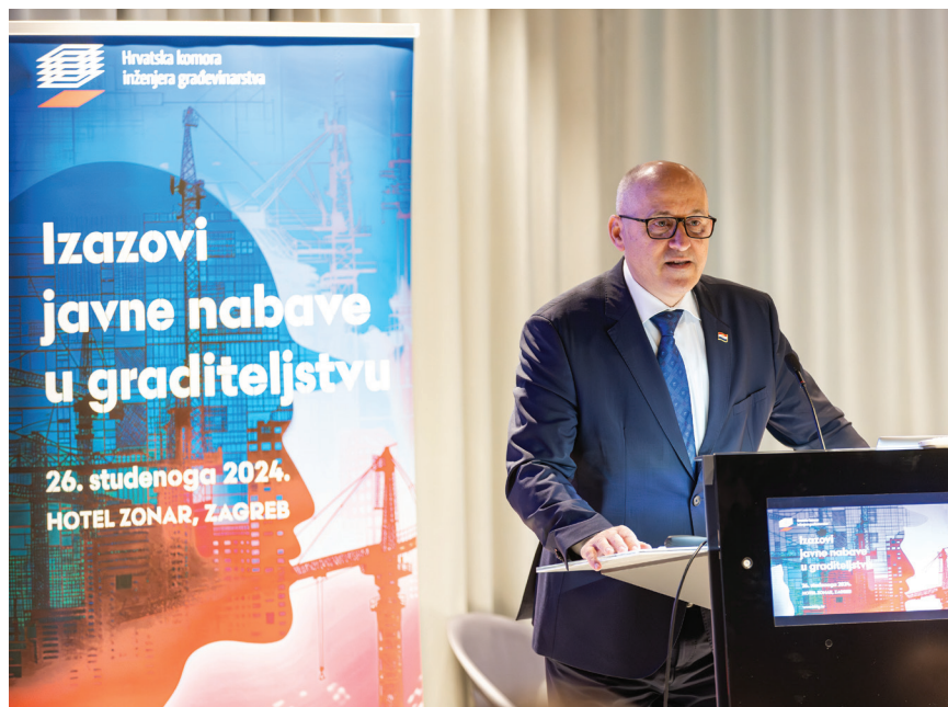
Branko Bačić, potpredsjednik Vlade i ministar prostornog uređenja, graditeljstva i državne imovine