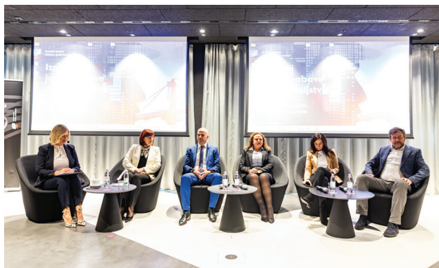
Zajednička fotografija panelista