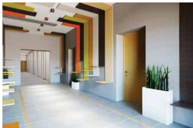
Današnji izgled uređenog prostora nakon obnove