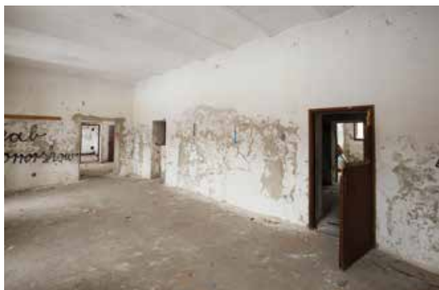
Prizemlje napuštene vojarne prije obnove

Centar znanja Međimurja mjesto je koje predstavlja svijetli primjer brownfield investicije, odnosno uspješne revitalizacije bivšega vojnoga kompleksa. Tehnička pomoć Europske komisije ključna je podrška projektu Centra znanja Međimur-