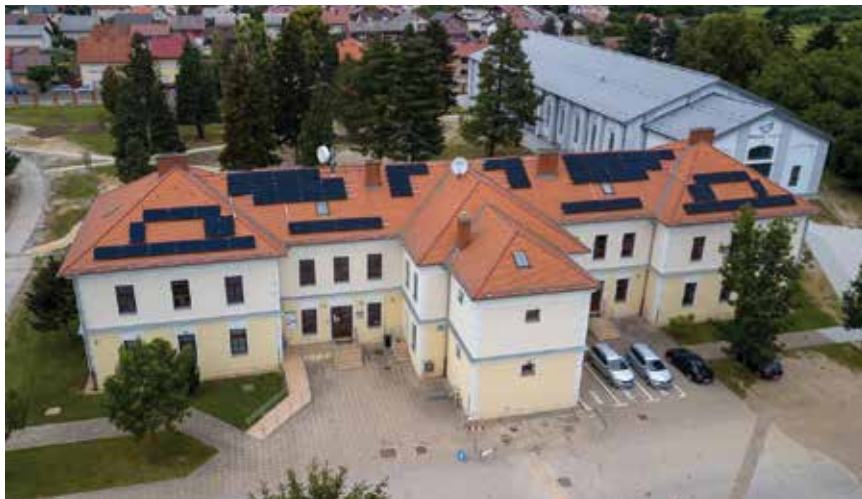
Fotonaponska elektrana na krovu zgrade TCIM1

ljena je elektrana snage 20 kW, dok je u Upravnu zgradu ugrađen sustav grijanja i hlađenja. Ukupno je ugrađen 191 solarni panel. Ugradnjom sustava grijanja i hlađenja eliminirano je korištenje fosilnoga goriva, poboljšani su uvjeti boravka, višak energije će se prodati, a nakon nešto više od mjesec dana otkako je elektrana puštena u pogon postignuta je ušteda od približno 1500 eura.