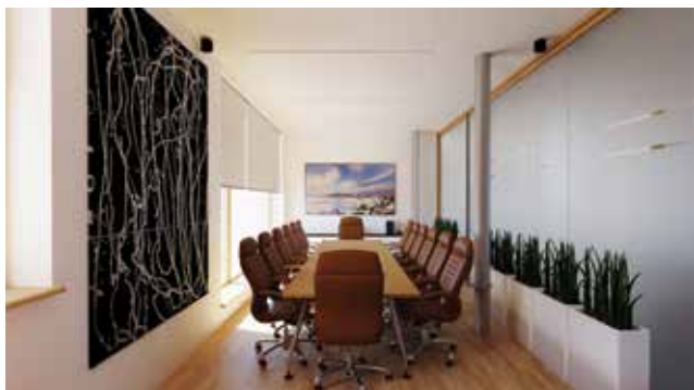
Vizualizacija sobe za sastanke i hodnika

Sredstva su iskorištena za adaptaciju potkrovlja zgrade TICM1 te rekonstrukciju zgrade TICM3. Nakon javne nabave za radove na rekonstrukciji potkrovlja zgrade TICM1 i potpisivanja ugovora s izvođačem Tekeli Projekt Inženjering d.o.o. u kolovozu 2018., započeli su radovi na rekonstrukciji. Proing d.o.o. obavljao je projektantski nadzor, dok je Rescon d.o.o. bio zadužen za stručni nadzor. U sljedećih deset mjeseci 400 m 2 neiskorištenoga prostora bivše vojne zgrade transformirano je u dodatnih 400 m 2 područja poduzetničkoga inkubatora TICM-a. Opremljeno je 16 ureda različitih veličina, prvi coworking/ predinkubacijski prostor te prostorije za sastanke i druženje, stvarajući radni prostor namijenjen stručnjacima, posebno iz područja informatike i drugih uslužnih sektora.