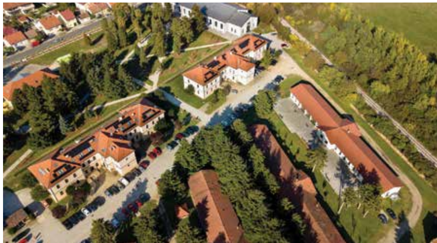
Pogled na kompleks vojarnje iz zračne perspektive

visokoobrazovne, poduzetničke i znanstvene institucije, a novi, neizgrađeni dio preko pruge prema Pribislavcu ( greenfield investicija) zamišljen je kao industrijska zona te je nazvan Poslovna zona Međimurje.