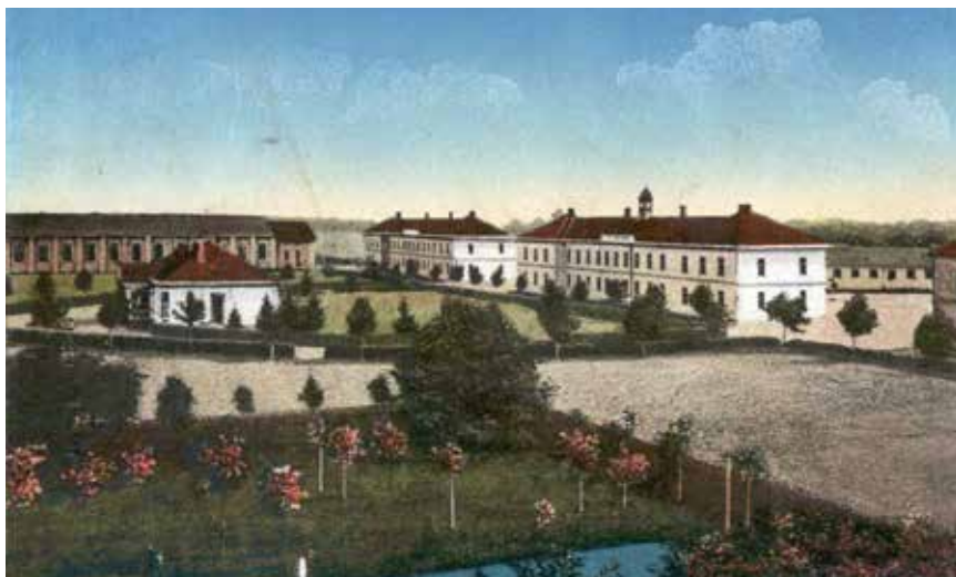
Vojarna u Čakovcu krajem 19. stoljeća

Od 2007. do danas u Centru znanja rekonstruirane su bivša zgrada zapovjedništva u kojoj djeluju Javna ustanova za razvoj Međimurske županije REDEA