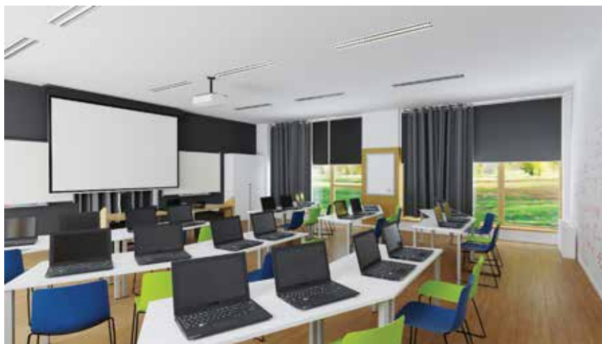
Vizualizacija informatičke učionice u Centru znanja

Tijekom rada na pilot-projektima stručnjaci će analizirati i ocjenjivati u kojoj se mjeri pilot-projekti uklapaju u temeljne vrijednosti NEB-a, a to su održivost, uključivost i estetika. Također će se voditi računa o NEB-ovim radnim načelima participativnoga dizajna, transdisciplinarnoga pristupa i angažmana na više razina. Ta suradnja omogućit će Međimurskoj županiji identifikaciju i prevladavanje potencijalnih prepreka kako bi se osiguralo da se Centar znanja Međimurske županije razvija u skladu s najvišim standardima Novoga europskog Bauhauusa, posebno kada se uzme u obzir činjenica da su klimatske promjene jedan od najvećih izazova s kojima se čovječanstvo susreće, što apostrofira važnost razvoja zelene infrastrukture. Čini se kako ta savjeta-