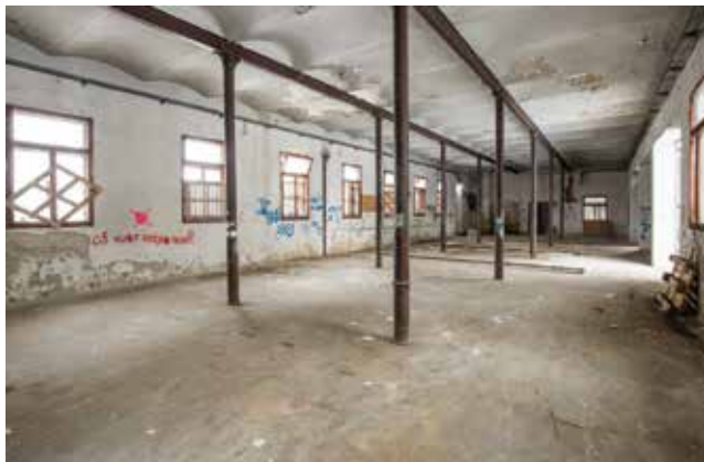
Zatečeno stanje zgrade prije obnove