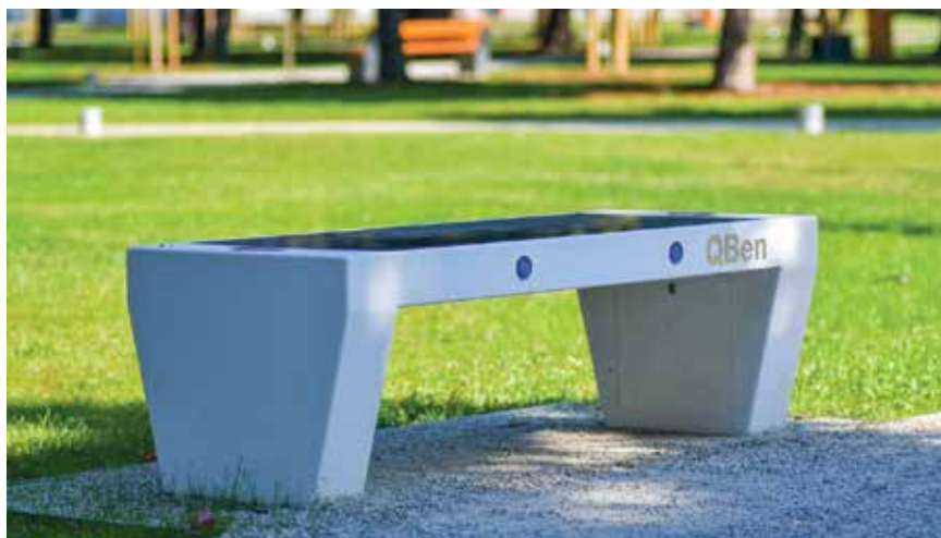
Uređenje parka u Centru znanja

davna podrška stiže u pravome trenutku, kada se započinje s projektiranjem novih investicija na prostoru bivše vojarne i