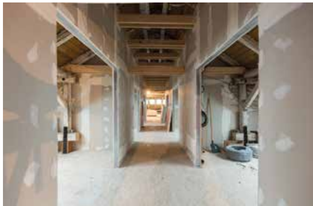
Detalji snimljen tijekom adaptacije potkrovlja zgrade TICM1

Radovi su trajali 33 mjeseca. U uredima u potkrovlju zgrade smjestila su se poduzeća koja obavljaju djelatnosti računalnoga programiranja, web i grafičkoga dizajna, razvoja informatičkih sustava, izgradnje cloud rješenja, automatizacije IT servisa, robotske automatizacije procesa, usluge fotografiranja i snimanja, postprodukcije snimljenog sadržaja te slične djelatnosti.