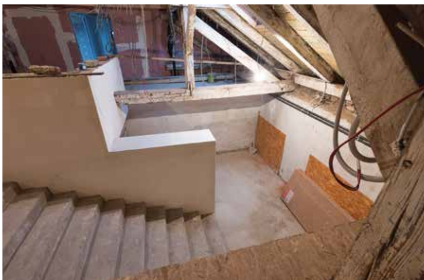
Obnova stepeništa u zgradi TICM3

Projekt proširenja poslovne infrastrukture u Centru znanja Međimurske županije obuhvatio je rekonstrukciju i opremanje prostora poduzetničkoga inkubatora u zgradi TICM3, otvorene u drugoj polovini 2020. S 18 ureda, izložbenim prostorom, sobom za sastanke i informatičkom učionicom površine 632,08 m 2 zgrada je privukla 11 poduzeća iz uslužnoga sektora. Investicija od 7,6 milijuna kuna (približno milijun eura) financirana je sredstvima Europske unije. Tim je projektom dodatno potvrđen uspjeh Tehnološko-inovacijskoga centra, koji je 2019. nagrađen za uspješnost priznanjem "Stvaratelji za stoljeća" u organizaciji Međunarodnoga ekonomskog foruma "Perspektive". Centar znanja postao je zanimljiv sustav koji potiče promjene i napredak. U kompleksu je svoj dom pronašlo više institucija važnih za regionalni razvoj Međimurja. Osim Javne ustanove za razvoj Međimurske županije REDEA i Tehnološko-inovacijskoga centra Međimurje (TICM) tamo su smještene i Međimurska energetska agencija (MENE), Metalska jezgra Čakovec, Međimursko veleučilište (MEV), Turistička zajednica Međimurske županije i MIN – Međi-