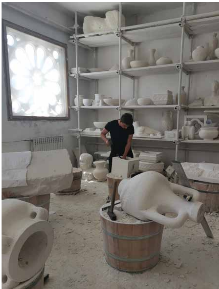
U Klesarskoj školi, osim hrvatskih, školuju se đaci iz europskih zemalja

Klesarska škola na Braču specifična je na području gotovo cijele Europe jer njeguje rimski način obrade kamena