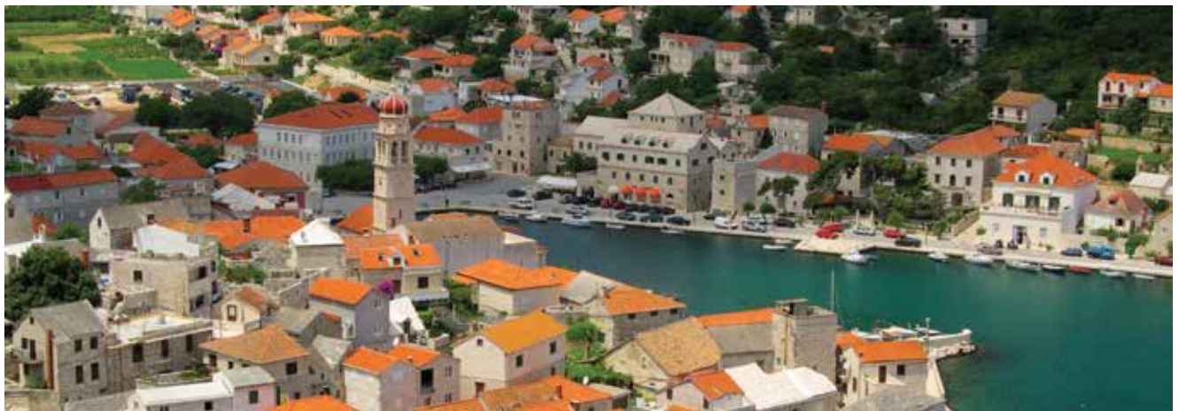
Pučišća na otoku Braču

U članku prikazani su povijest klesarstva u Hrvatskoj i zanimljivi projekti Klesarske škole, zbog koje su Pučišća na otoku Braču postala poznata i u globalnim medijima. To bračko naselje nastalo je na kamenu i od kamena. Uz Supetar, s približno 1700 stanovnika, najveće su bračko naselje nepatvorenih mediteranskih