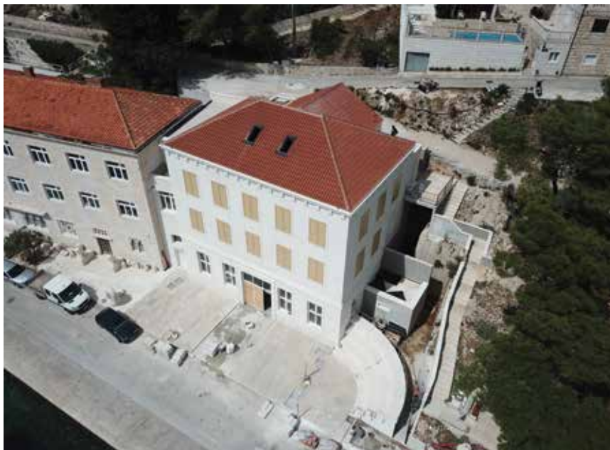
Projektom dogradnje aneksa školske zgrade osigurat će se bolji uvjeti rada i podignuti kvaliteta nastave

Ručna obrada kamena koja podrazumijeva uporabu starih rimskih alata temelj je praktične nastave, no zbog potreba tržišta rada za fleksibilnom radnom snagom Klesarska škola u sljedećim godinama namjerava nove naraštaje učenika osim za ručnu obradu obučavati za industrijsko-računalnu obradu kamena. Time bi bio ostvaren cijeli proces, od ideje i modeliranja preko izrade, ručne ili strojne, do ugradnje, pri čemu bi postojeće radionice ostale isključivo u funkciji ručne obrade