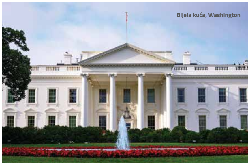
Bijela kuća, Washington

Na otocima Braču, Hvaru i Korčuli nalaze se bogati slojevi bijelo-žučkastoga vapnenca, pa je sama priroda pogodovala