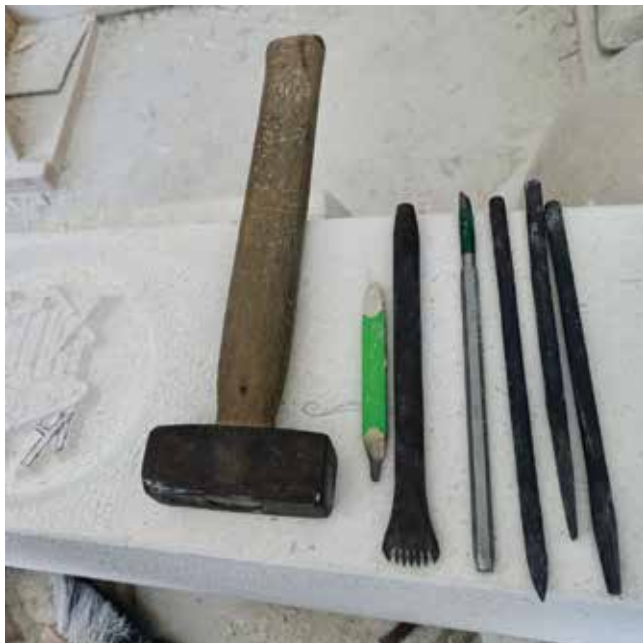
Brački kamen obrađuje se ručnim kovanim alatima