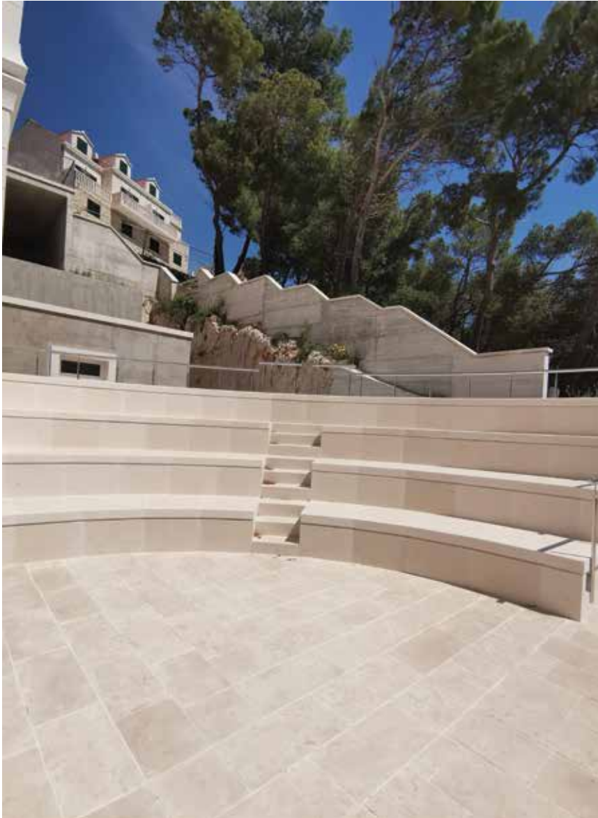
Polukružno gledalište ispred nove školske zgrade

te zastojima u radu uzrokovanima lockdownom zbog pandemije koronavirusa u proljetnim mjesecima 2020., ali dio odgovornosti snosi i glavni izvođač radova. Na gradilištu je preostalo izvođenje završnih radova i dijela instalaterskih radova u zgradi, što će ujedno biti treća (završna faza) projekta, a njen se završetak predviđa tijekom slijedeće godine.