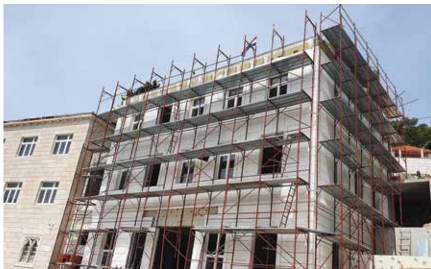
Oblaganje glavnog pročelja zgrade kamenim oblogama

Građevina je relativno pravokutnoga tlocrtnog oblika dimenzija 11,7 x 6 metara, sa spojnim hodnikom dimenzija 2,4 x 15,25 metara, koji se oslanja na postojeću zgradu. Sastoji se od prizemlja, dvaju katova i potkrovlja, a izvedena je kao