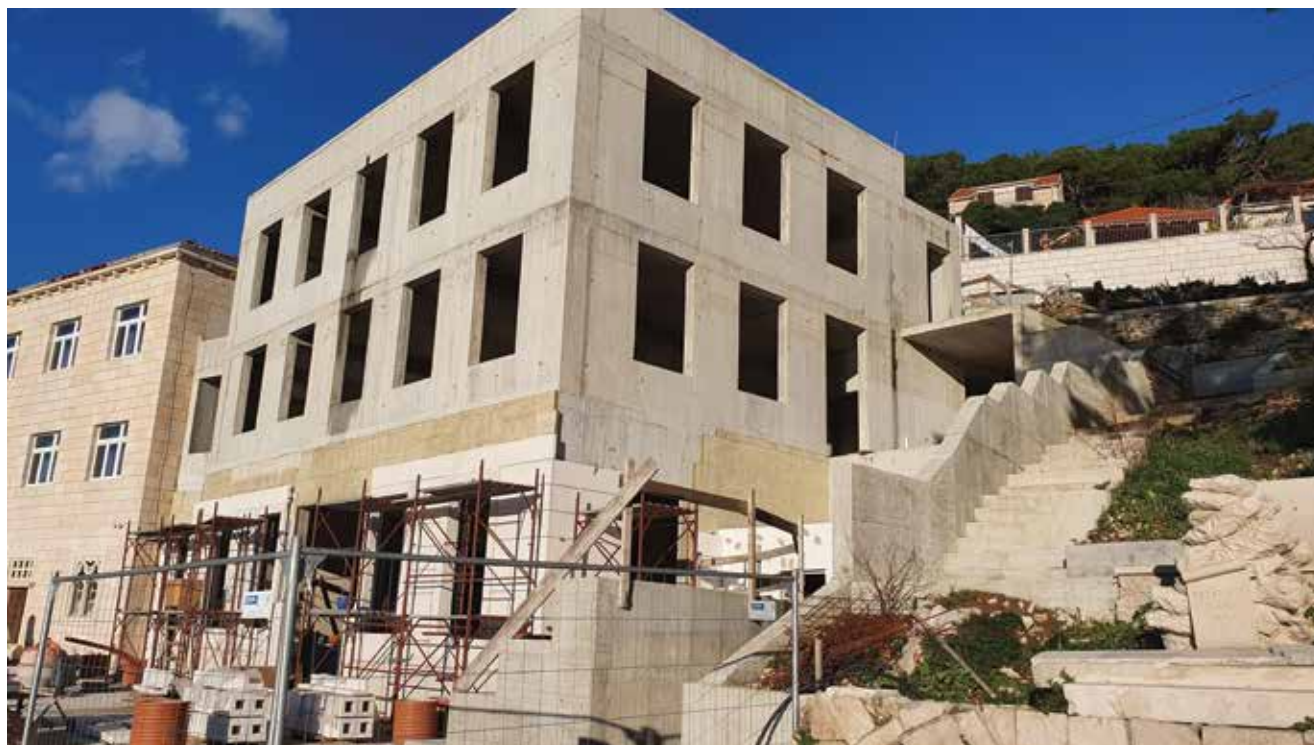
Detalj s gradilišta

fizikalno-mehaničkih svojstava. Za takve uvjete temeljenja, dopuštena nosivost tla iznosi od 0,6 do 0,7 MPa. Te je radove, kao i dogradnju aneksa školske zgrade, temeljenje i izvedbu armiranobetonske konstrukcije zgrade izvodila građevinska tvrtka MP Beton d.o.o. iz Solina, a kao glavni inženjer gradilišta bio je imenovan Smajl Bajraktarević, dipl.ing.građ. Druga faza projekta odnosila se na radove na kamenoj fasadi, uređenju krovista i dijelu instalacija. Ti su radovi trajali od 10. srpnja 2019. do 26. listopada 2020.