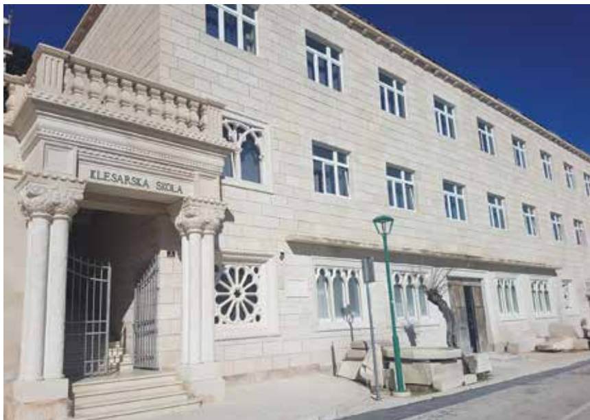
Klesarska škola u Pučišćima prva je i jedina klesarska škola u Hrvatskoj

U Pučišćima na otoku Braču dovršava se dogradnja prve i jedine klesarske škole u Republici Hrvatskoj, jedinstvenoj po ručnoj tehnologiji obrade kamena uporabom starih rimskih alata, zbog potreba tržišta rada za fleksibilnom radnom snagom Klesarska škola u sljedećim godinama namjerava nove naraštaje osim za ručnu obradu kamena obučavati i za njegovu industrijsko-računalnu obradu