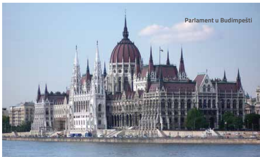
Parlament u Budimpešti

Od bračkog kamena izgrađene su neke od najpoznatijih svjetskih građevina