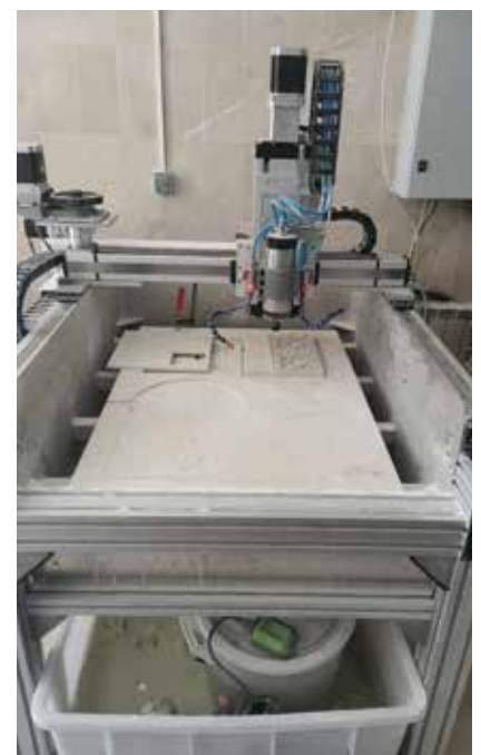
CNC stroj u radionici Klesarske škole

U članku su prikazani povijest, projekti i važnost prve i jedine Klesarske škole u Republici Hrvatskoj, koja aktivno radi na brojnim europskim projektima te sustavno podiže razinu kvalitete nastave i radnih uvjeta škole, čemu svjedoči i nova investicija u aneks školskoj zgradi. Nažalost, uz blage oscilacije u posljednjih deset godina škola bilježi kontinuirani pad broja učenika. Ipak, u aktualnoj školskoj godini upisano je 12 klesara, dok ih je posljednjih godina znalo biti samo po dvoje ili troje, pa se može zaključiti da se interes đaka prema klesarstvu ipak povećava. S obzirom na to da je riječ o cijenjenome i dobro plaćenome zanimanju, nadamo se da će u sljedećim školskim godinama njihov broj značajno rasti, jer su na tržištu rada itekako potrebni. Nekada težak i fizički vrlo iscrpljujući posao u kamenolomima zamijenile su nove tehnologije. Obnavljanje graditeljske baštine važan je posao za očuvanje naslijeđa te za učenje i usavršavanje zanata. Upravo je dugovječnost kamena kao prirodnoga materijala očuvala dostignuća ljudske civilizacije i graditeljstva te je njegova važna karakteristika koju moramo očuvati u modernome svijetu punome izazova.