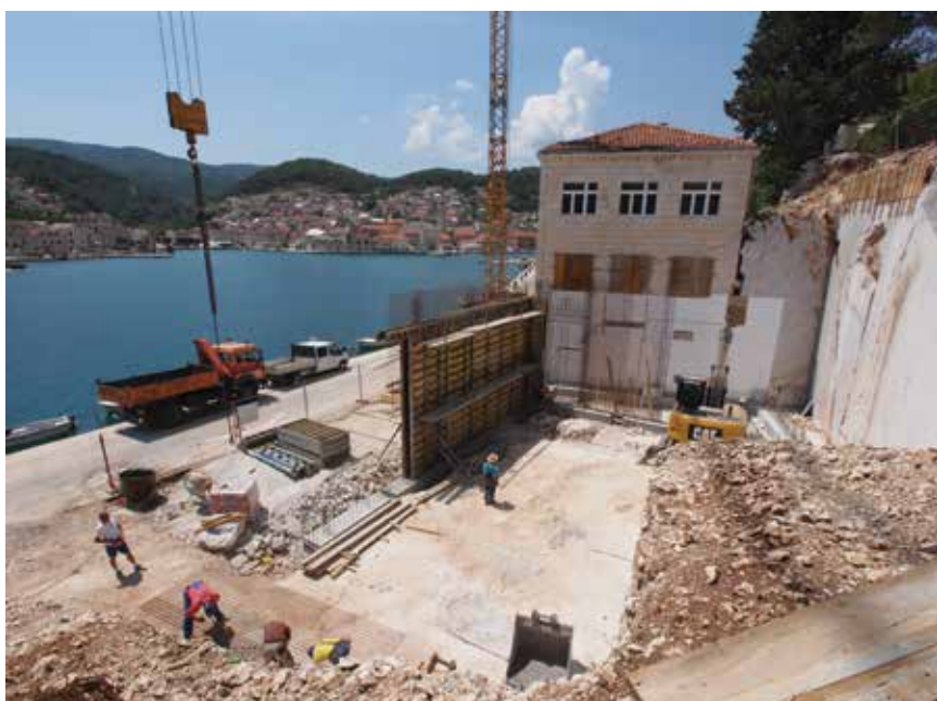
Radovi na iskupu stijenske mase pokraj Klesarske škole

su zgrada i njezin okoliš bili zapaljeni. Zgrada je otkupljena 1956. i preuređena u učenički dom. Dom je djelovao samostalno do 1963. kada je ujedinjen s Klesarskom školom. Godine 2000. izvedena je druga adaptacija kojom je u domu dobiveno 19 soba čiji je kapacitet 57 učenika. Većina soba danas su dvokrevetne ili trokrevetne s pripadajućom kupaonicom. Time su osigurani maksimalna privatnost i mir potreban za od-