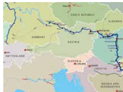
Sliv rijeke Dunav

najdjelotvornijih mjera ublažavanja poplavnih rizika koja štiti ljudske živote i imovinu. Međutim, kvaliteta hidroloških prognoza ovisi o nizu čimbenika poput meteorološke prognoze, količine i kvalitete meteoroloških i hidroloških podataka, razmjene podataka ili organizacijske strukture nacionalnih hidroloških i meteoroloških službi.