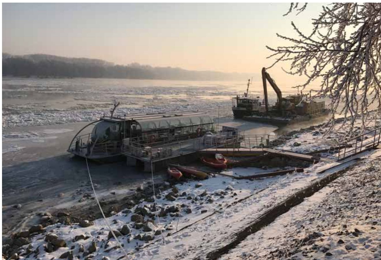
EU projekt DAREFFORT daje sveobuhvatan pregled nacionalnih sustava za prognoziranje poplava i leda

Međunarodni projekt “Jačanje suradnje na području prognoziranja poplava na dunavskom slivu – DAREFFORT” pokrenut je kao horizontalna inicijativa za provedbu