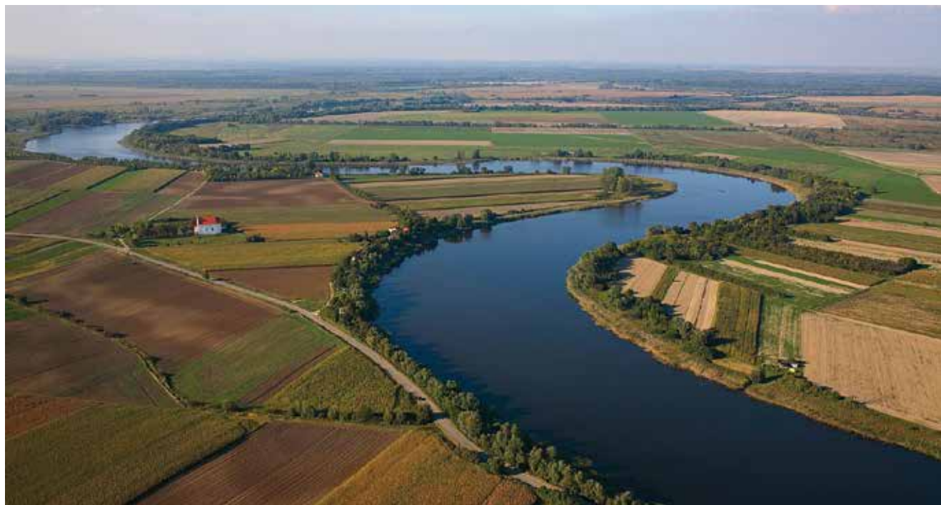
Pogled na rijeku Dunav

Partneri odnosno članovi projektnoga tima iz 12 država nisu predstavljali samo nacionalne institucije, već su uključivali i znanstvenike, ekonomiste te stručnjake iz ostalih relevantnih područja. Projektni partneri, pri čemu je vodeći partner bilo mađarsko vodoprivredno poduzeće Viziterv Environ , istražili su stanje nacionalnih prognostičkih kapaciteta i zajednički razvili svoje prijedloge za neophodan skup usklađenih podataka koje treba prikupiti i razmijeniti u stvarnome vremenu radi izrade prognoze. Iako je intenzivna suradnja zemalja u dunavskome slivu zajednički, općeprihvaćen cilj, problem su bile tehničke razlike te pravni i administrativni okvir nacionalnih tehnika za mjerenje podataka i prognoziranja. U sklopu projekta DAREFFORT partneri