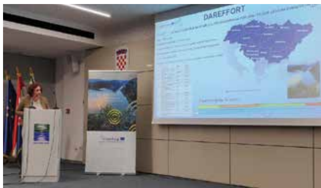
Detalj snimljen tijekom prezentacije projekta DAREFFORT

su također procjenjivali i vrednovali sadašnje prakse mjerenja čimbenika koji igraju važnu ulogu u pojavi poplava. Ta je procjena otkrila da u nekim zemljama ne postoje odgovarajuća sustavna mjerenja leda na rijekama i ekvivalentna snježne vode (engl. Snow Water Equivalent – SWE ) niti njihove distribucije, iako poplave u dunavskome slivu uglavnom nastaju kao kombinacija kiša i topljenja snijega u planinskim područjima. Taj će problem u budućnosti trebati rješavati poboljšanjem motrenja tih parametara i instaliranjem kompozitnih opservatorija, ali i primjenom novih procesa upravljanja podacima zasnovanima na fuziji podataka terenskih promatranja, satelitskih proizvoda i modelskih simulacija snijega. Hrvatska, koju su kao partner na projektu predstavljale Hrvatske vode , u suradnji s drugim podunavskim državama izradila je preporuke na svojem području radi uspostave Dunavskoga hidrološkog informacijskog sustava ( Danube Hydrological Information System – DanubeHIS ), što je temeljni korak ka fleksibilnoj i održivoj razmjeni podataka. Državni hidrometeorološki zavod je u tome projektu radio za Hrvatske vode kao nacionalni pružatelj prognostičkih podataka. Svim partnerima na projektu bilo je dostupno sučelje računalnoga programa koje pruža standardne podatkovne usluge te je izvor podataka za EFAS (engl. European Flood Awareness System ). Brzu provedbu sustava u državama dunavskoga sliva uključenima u Projekt pratili su i paketi e-učenja.