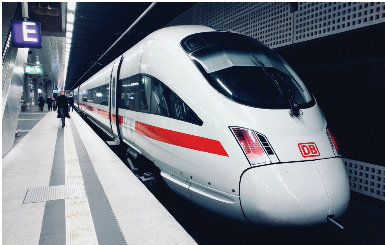
Tijekom 2021. u cijelosti će biti implementiran Četvrti željeznički paket

komisije za promet Adina Valean te povjerenica EK-a za koheziju i reforme Elisa Ferreira. Razgovarali su o izazovima koji stoje na putu uspostavljanju europskoga željezničkog prostora bez granica, koji promiče korištenje vlakova kao sigurnogae i održivoga prijevoznog sredstva. Posebno je istaknuto to da će 2021. bit će prva godina u kojoj će u cijelosti biti implementiran Četvrti željeznički paket, čime će biti napravljen velik iskorak prema stvaranju jedinstvenoga europskog željezničkog područja, učinkovitije željezničke mreže s boljom prekograničnom mobilnošću.