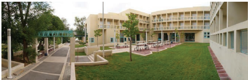
Studentski dom Hostel Split u neposrednoj blizini SD Bruno Bušić