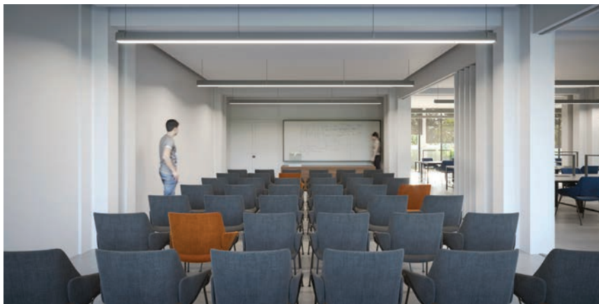
Vizualizacija novoobnovljene učionice u prizemlju

Na prvome katu smješteno je 35 trokrevetnih soba, dvije dvokrevetne sobe te četiri jednokrevetne sobe s pripadajućim sanitarnim čvorovima. Na svakome katu predviđena je i čajna kuhinja u zapadnome krilu, dok je u istočnome krilu zgrade predviđena manja učionica. Na sjevernome pročelju sve studentske sobe imaju balkone s pogledom na more, na lučicu Spinut i Poljud, dok je na južnoj strani u tijeku dogradnja pa će nakon završetka radova sve sobe imati balkone, osim onih u prizemlju, na jugoistočnoj strani studentskog doma. Na drugome i trećemu katu smješteno je po 39 trokrevetnih soba. Na dograđenome katu bit će smještena 41 dvokrevetna soba sa sanitarnim čvorom. Predviđe-