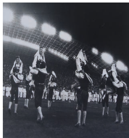
Detalj sa svečanog otvaranja VII. Mediteranskih igara, snimljeno 15. rujna 1979.

Bruno Bušić , i to na jednoj od najatraktivnijih lokacija grada, uz sam rub park-šume Marjan. S obzirom na to da se nalazi u neposrednoj blizini mora, lučice i borove šume, slučajnome prolazniku taj studentski dom na prvi pogled može djelovati poput hotela. U njegovu okružju nalaze se sportsko-rekreacijski sadržaji kao što su veslački klubovi Mornar i Gusar , jedriličarski klub Spinut , nogometni klub Dalmatinac , ronilački klub Spinut i nogometni stadion Poljud .