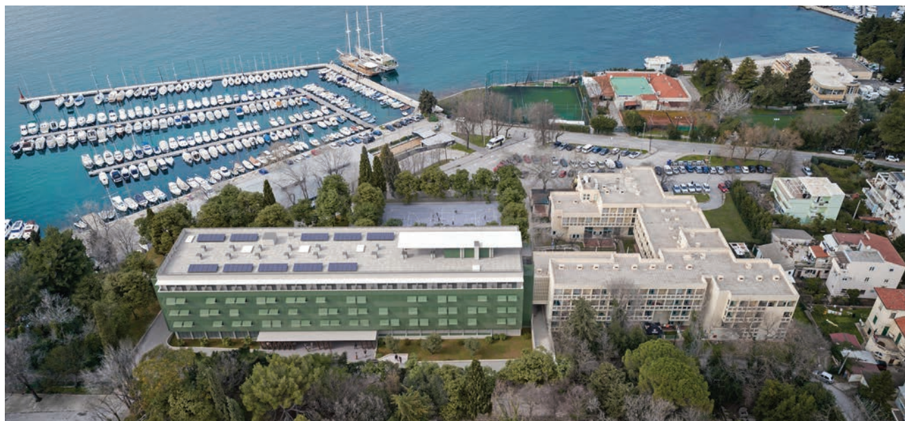
Pogled iz zraka na SD Bruno Bušić

409 ležaja. Od početka njegova korištenja do danas nisu izvođeni veći zahvati na zgradi. Zahvaljujući neposrednoj blizini prometnice, studentski dom povezan je s okolicom grada Splita i cjelokupnom mrežnom infrastrukturom. Autobusnom linijom povezan je sa Sveučilištem odnosno kampusom.