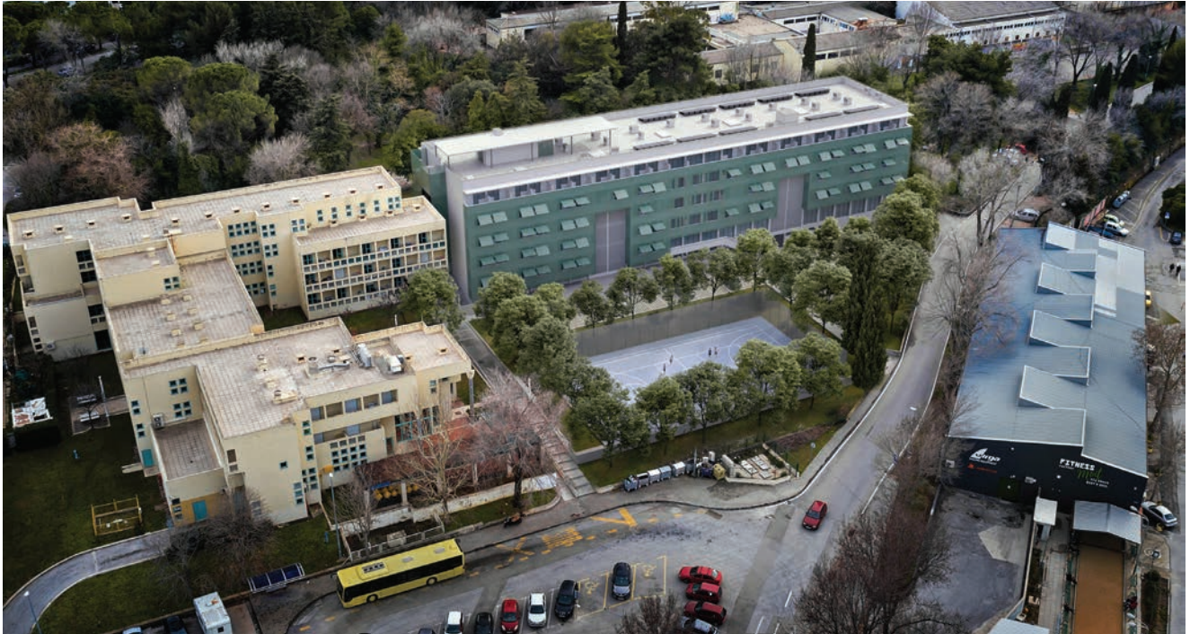
Vizualizacija studentskih domova nakon završene obnove

sve etaže i služiti će kao vertikalna komunikacija i za evakuaciju osoba smanjene pokretljivosti. Osim dizala, ispred glavnog ulaza u studentski dom postaviti će se pristupna rampa s prometnice.