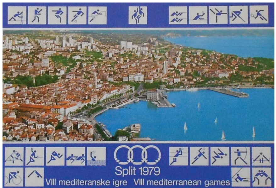
Mediteranske igre 1979. preobrazile su vizuru grada Splita

Split je tada vrlo pametno iskoristio titulu domaćina Igara te se iz zapuštenoga primorskog gradića transformirao u moderan grad, najveći i najvažniji na istočnoj obali Jadrana. Probijali su se tuneli, asfaltirale prometnice, izgrađen je stadion Poljud i kompletna sportska infrastruktura, uređivale su se pješačke zone i izranjalo je novo, dotad nepoznato urbano lice grada. Izgrađeni su veliki putnički terminal na aerodromu u Resniku, pomorsko-putnički terminal u Gradskoj luci i novi RTV centar, tunel Marjan, že-