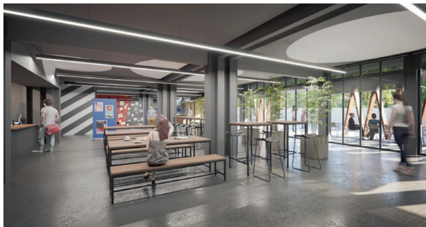
Vizualizacija novog atrija u studentskom domu

gradnju samo novih studentskih domova, no nakon što su im iz Splita dostavljene fotografije stanja u kojima se nalaze postojeći BB, promijenili su stav.