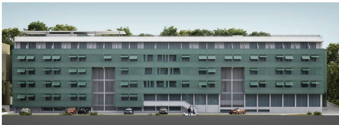
Pogled na sjeverno pročelje zgrade

Studentski dom Bruno Bušić imao je dvostruko stubište koje u slučaju požara nije bilo zaštićeno. Zato će se postojeće stubište pregraditi kao posebni požarni sektor. Stubište je odvojeno od hodnika na svakome katu vatrosigurnosnim staklenim stijenama s dvokrilnim vratima. U slučaju požara evakuacija će se osim glavnim stubištem provoditi evakuacijskim otvorenim stubištima na istočnoj i zapadnoj strani studentskog doma. Dizalo će se ugraditi u zapadnome krilu zgrade, a pokrivat će