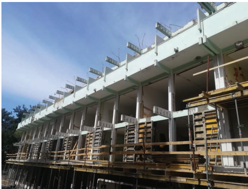
Detalj s gradilišta