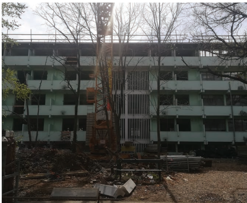
Tijekom 2018. pokrenuta je hitna sanacija SD Bruno Bušić

Trošni studentski dom bio je i povod da Europska unija u planove o sufinanciranju za razdoblje od 2013. do 2020. uključi obnovu i ostalih dotrajalih hrvatskih studentskih domova. U početku su članovi Europske komisije bili voljni sufinancirati