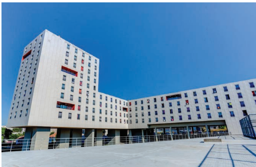
SD Dr. Franjo Tuđman smješten je na Sveučilišnom Kampusu u Splitu

uključeni apartmani za profesore i smještaji za studente iz inozemstva). Studenti ostvaruju pravo na smještaj u domu putem javnog natječaja, odnosno Pravilnika koji propisuje MZO, a sve prema rang-listi ostvarenog broja bodova. Studenti koji ostvare pravo na smještaj ostvaruju ga u periodu od 1. listopada do 15. srpnja u tekućoj akademskoj godini. Svi su smještajni kapaciteti cijelu akademsku godinu popunjeni studentima, no manjak ležajeva sve je izraženiji. Za smještaj u nekome od studentskih domova Sveučilišta u Splitu prijavila su se ukupno 1983 studenata, a samo ih je 862 ostvarilo pravo na smještaj. No, taj će se broj znatno povećati za nepunih godinu dana kada SD Bruno Bušić zasja u novome ruhu.