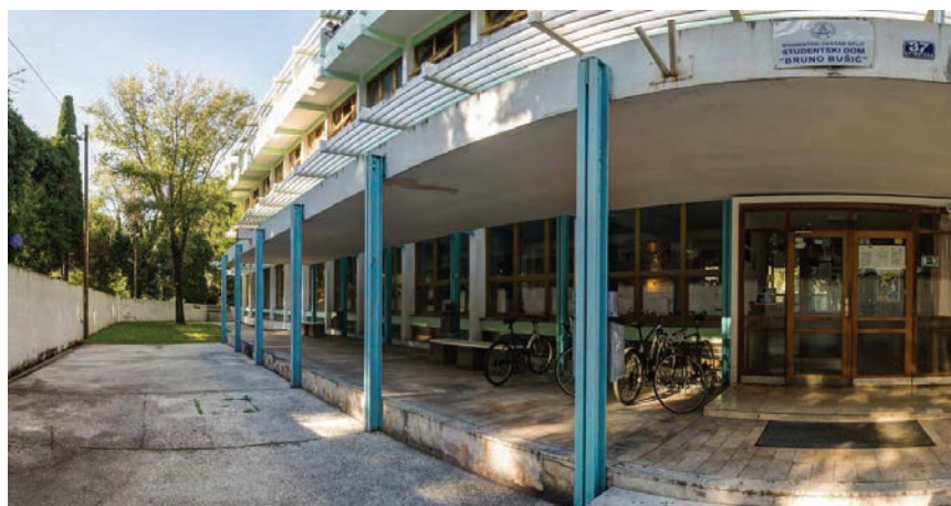
Glavni ulaz u studentski dom

Sveučilište u Splitu danas posjeduje tri studentska doma. Na Spinutu je osim SD-a Bruno Bušić smješten SD Hostel Spinut , a na sveučilišnome kampusu 2013. izgrađen je SD Dr. Franjo Tuđman . Te tri zgrade, koje su pod upravom SC-a Split, imaju ukupno 1189 ležajeva (u taj broj nisu