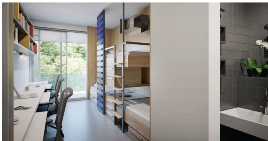
Vizualizacija trokrevetne studentske sobe