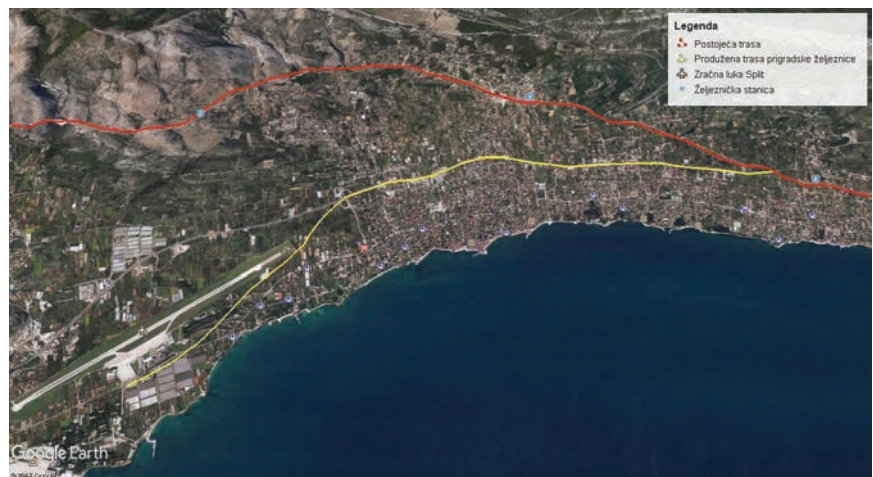
Položaj trase prigradske željeznice

Implementacija sličnih projekata može se vidjeti na brojnim primjerima gradova u Europi i širom svijeta koji su nedavno uveli sličan način prometovanja i povezivanja gradskih i prigradskih naselja.