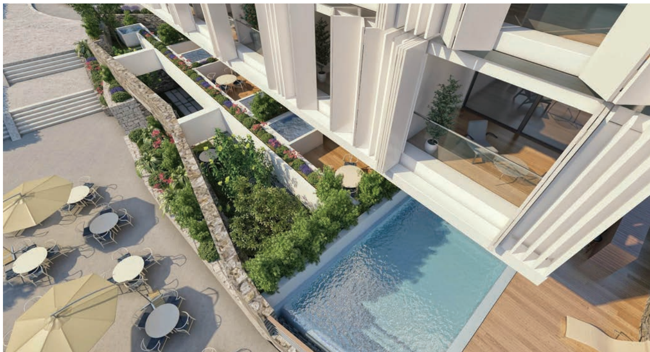
Izgled Ville Harmony nakon dovršetka izgradnje

Osim nedostatka hotelskog smještaja, jedan od gorućih problema u Splitu jest dramatičan nedostatak parkirališ-