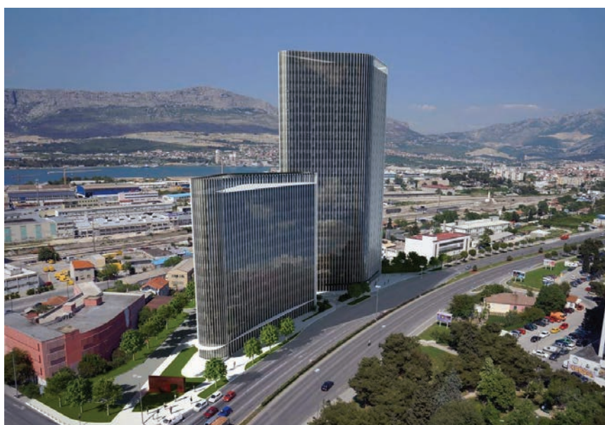
Vizualizacija hotela Marriott International u splitskom West Gate-u

nom, nizom ugostiteljskih sadržaja, ali i tri bazena i raskošnim wellnessom . Hotel će se sastojati od dva dijela; Amfora Resort je glavni objekt na osam katova, a Amfora Resident sadržavat će apartmane veličine od 30 do 100 kvadrata. Tri četvrtine svih