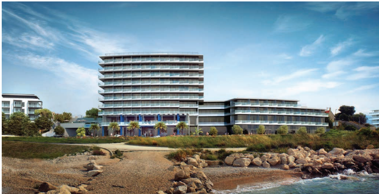
Vizualizacija hotela Amfora na Žnjanu

sobu i apartman, 240 sjedećih mjesta u restoranu, spa, teretanu, noćni klub i podzemnu garažu s 59 mjesta, a njegovo otvorenje najavljeno je za ljeto 2019. Na zemljištu smještenome istočno od mosta koji spaja Gradsku luku Split i gradsku plažu Bačvice gradi se Vila Harmony