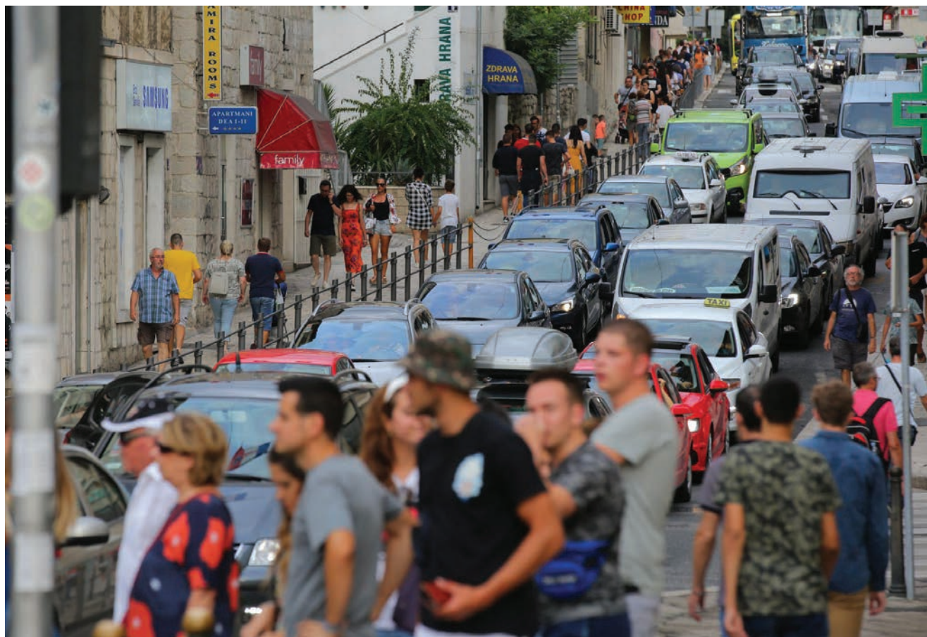
Prometni kolaps u Splitu postao je svakodnevnica

nih mjesta na području cijeloga grada. U siječnju 2019. komunalna tvrtka Split parking započela je gradnju šest javnih garaža ukupnoga kapaciteta 1200 mjesta, što će uz garaže koje upravo gradi ili priprema Grad Split (oko 600 mjesta) smanjiti pritisak u najopterećenijim gradskim četvrtima.