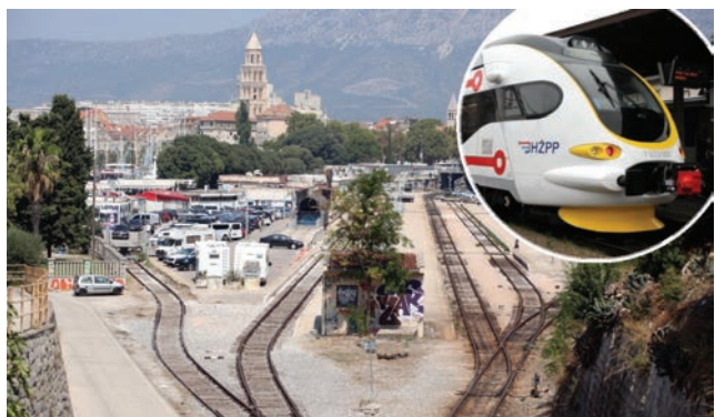
Splitski metro spajat će trajektnu luku u Splitu i zračnu luku u Trogiru

koji su preduvjet za preseljenje autobusnog kolodvora u Splitu. Do početka turističke sezone 2019. Split bi tako trebao dobiti novi autobusni kolodvor u prigradskome naselju Kopilici.