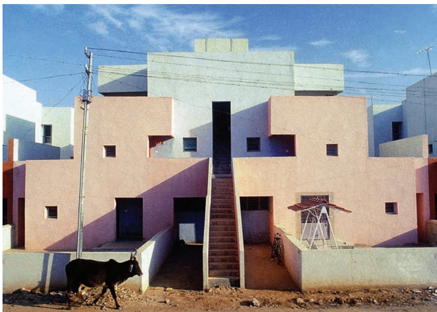
Kompleks socijalnih stanova Aranya

Doshi smatra kako je dodjela Pritzkerove nagrade koju je dobio velika stvar za Indiju. Možda napokon indijske vlasti shvate to da se mogu graditi jeftini socijalni stanovi za jako velik broj ljudi i polako početi rješavati gorući indijski problem – ljudi bez krova nad glavom.