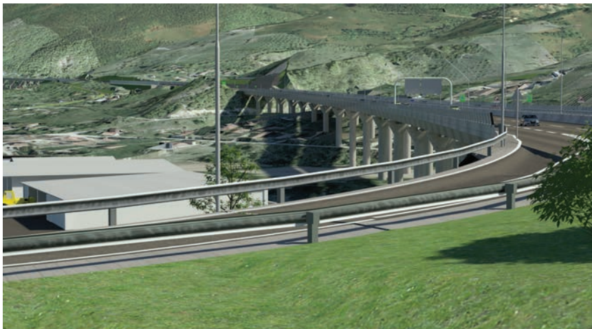
Vizualizacija mosta Drivuša

Nažalost, Bosna i Hercegovina godinama je bila među najnerazvijenijim europskim zemljama koje vabe za infrastrukturnim projektima, ponajprije autocestama. Dok su Mađarska i Hrvatska planirale svoju mrežu autocesta i pripremale projekte na koridoru V.c, u BiH je trajao rat, što je uz nepovoljne političke odnose unutar zemlje i druge razloge bio ključan čimbenik zbog kojeg taj dio autoceste još nije dovršen. Do sada je izgrađeno nešto više od 120 kilometara od ukupno 337 kilometara autoceste kroz BiH. Trasa u duljini od 285 km prolazi kroz Federaciju BiH, a u duljini od 51 km kroz Republiku Srpsku, i to kroz općine Doboj, Modrič i Vukosavlje).