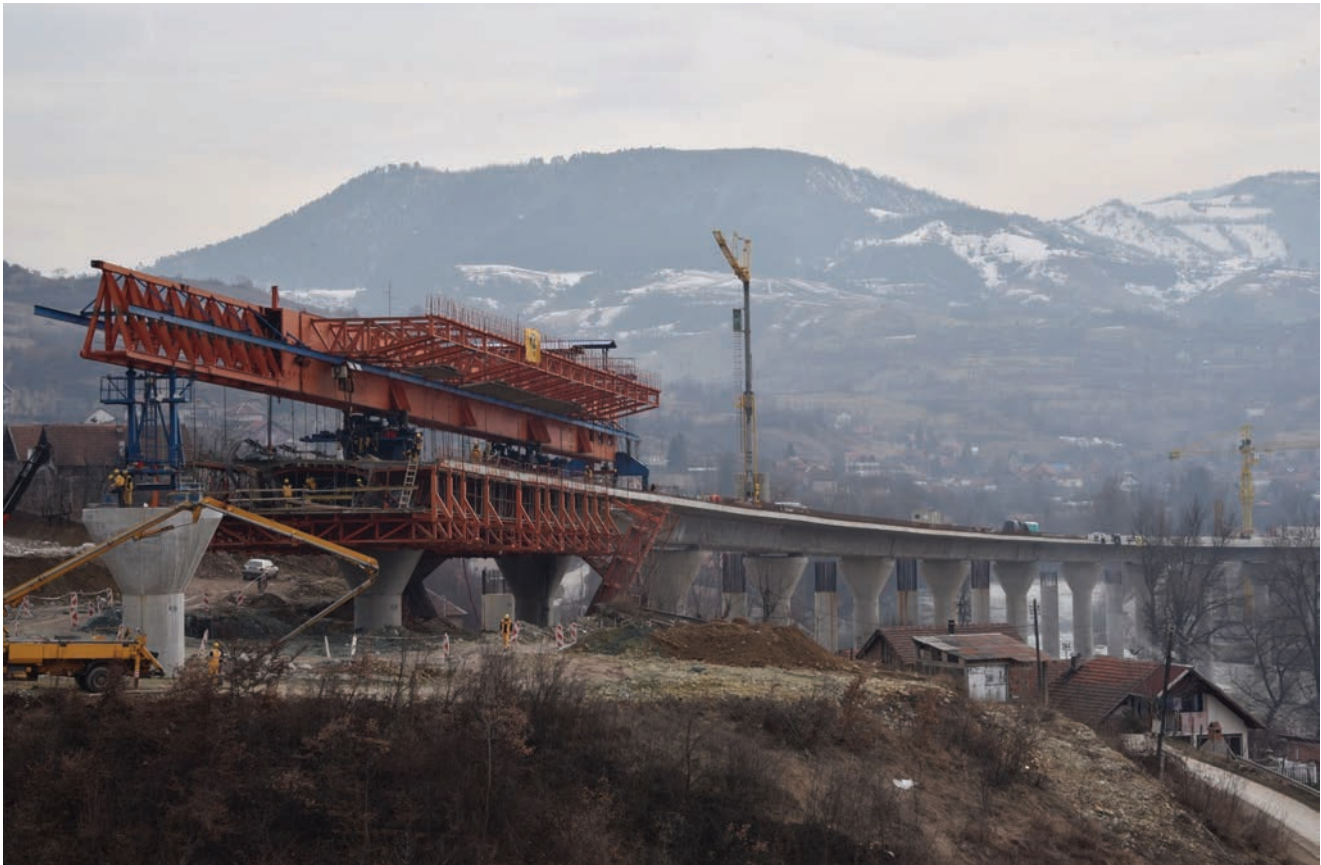
Detalj s gradilišta

tisuću metara dug tunel Pečuj na poddionici Klopče – Pečuj te 512 m dug tunel Ričice na poddionici Drivuša – Klopče kod Zenice. Izgradnja dionice Mostar sjever – Mostar jug, kao i tunela Prenj, kako su nam rekli iz Autocesta FBiH , trebala bi početi u proljeće 2018. godine. Građevinari, na temelju vlastitih iskustava, procjenjuju da će za izgradnju preostalih kilometara autoceste kroz BiH, zbog složenosti projekata i opsega radova, trebati još deset godina, i to pod uvjetom da se istodobno radi na više lokacija.