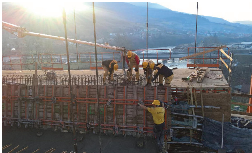
Prikaz montaže MSS skele na gradilištu