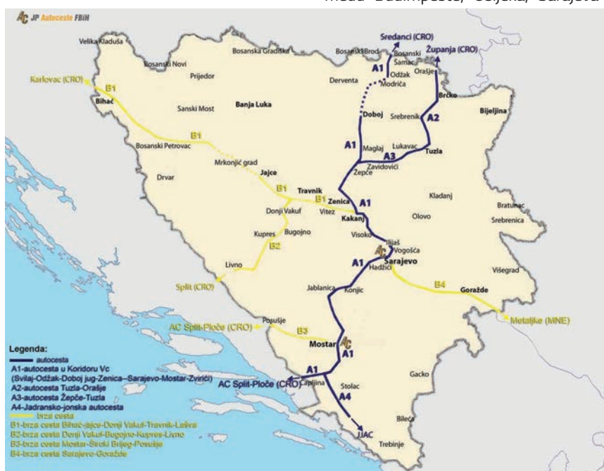
Koridor V.c na zemljovidu

Kroz Republiku Hrvatsku prolaze V., VII. i X. koridor. U ovome prilogu opisat ćemo važnost koridora V.c na kojemu se trenu-