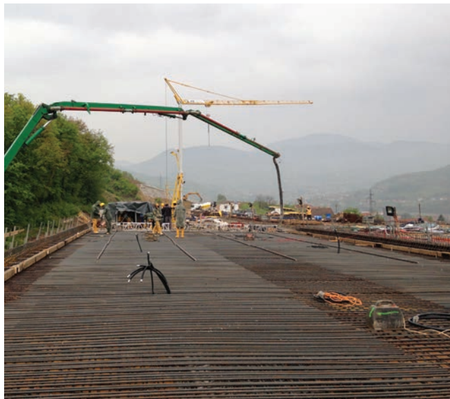
Radovi na vijaduktu Perin Han

dokumentaciju, što je uzrokovalo neželjene zastoje na izgradnji otvorene trase autoceste. Na dvije lokacije aktivirana su klizišta.