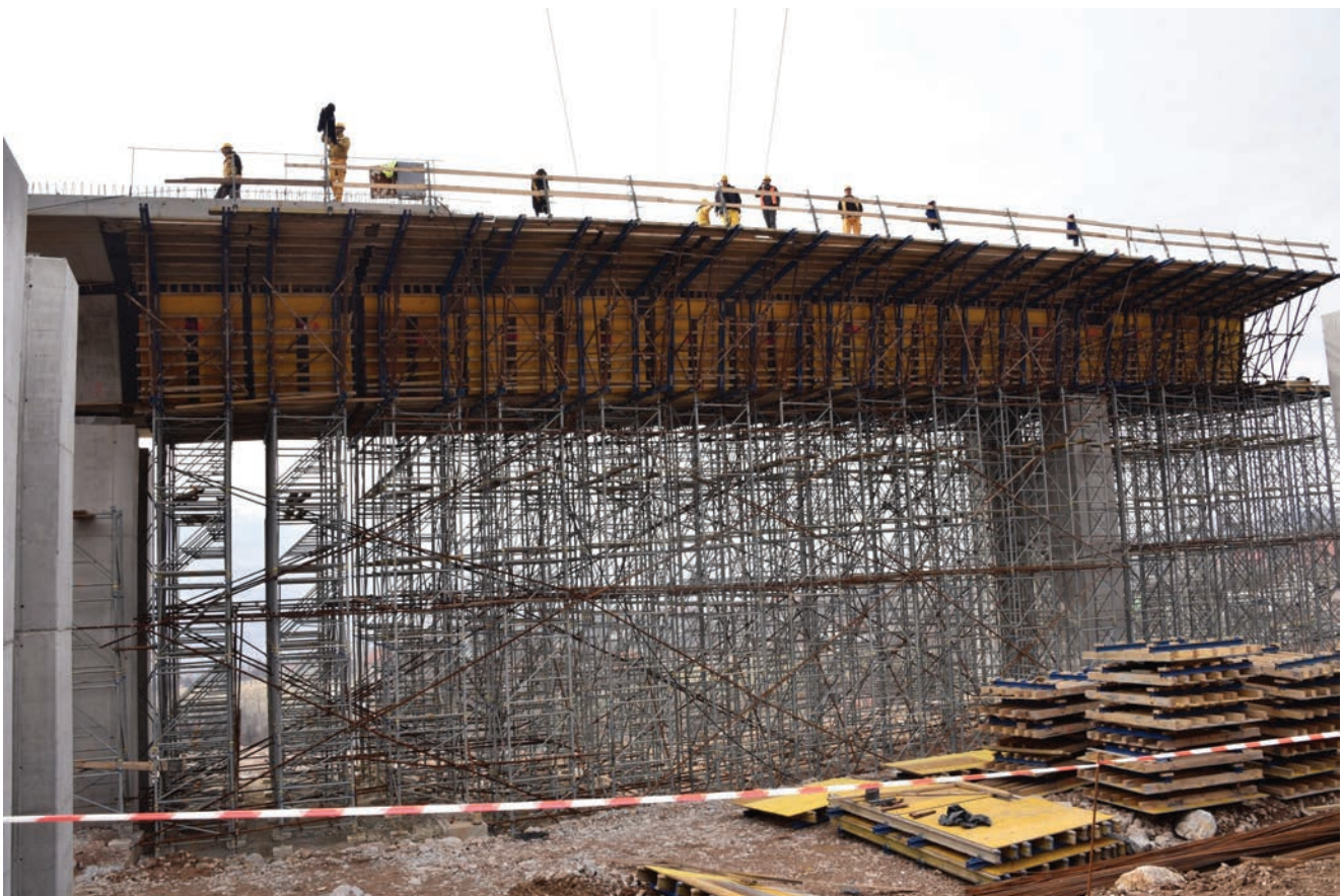
Staxo skela na vijaduktu Perin Han

Inženjer Zulić objasnio nam je to da se na području na kojemu se gradi most nalaze rijeka Bosna, lokalne prometnice, postojeći plinovod i Đulanov potok, zbog čega je cijeli proces implementacije tog projekta vrlo složen. Na cijeloj duljini poddionice Drivuša – Klopče radi se u geološki vrlo složenim terenskim uvjetima koji nisu detaljno obrađeni u glavnemu projektu pa je trebalo mijenjati projektne