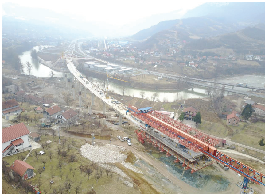
Pogled na gradilište

je ugovorena vrijednost nadzora nad radovima približno 2,5 milijuna eura.