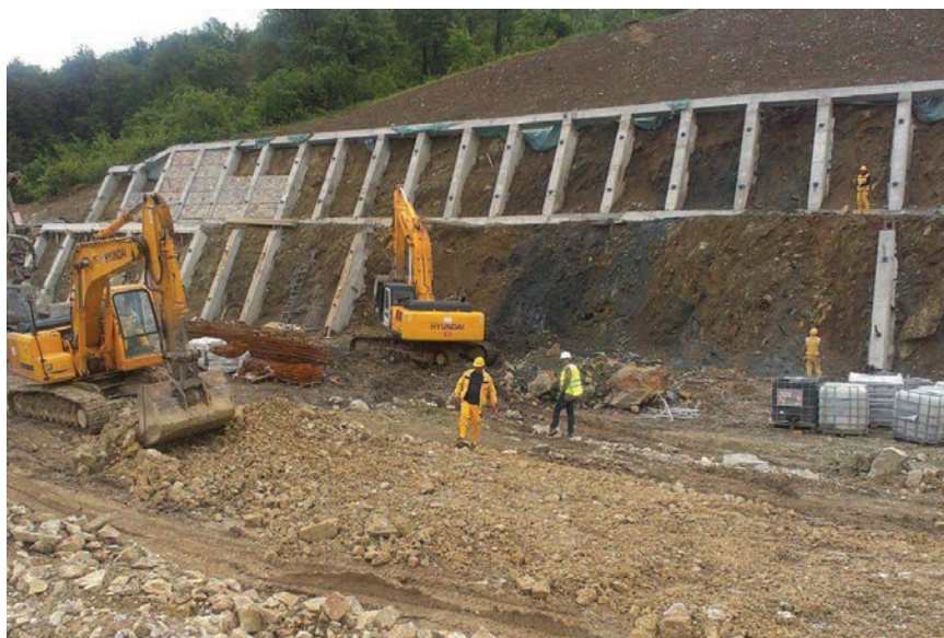
Osiguravanje stabilnosti zasjeka izvođenjem armiranobetonska roštiljne konstrukcije

Vijadukt Perin Han projektiran je kao dvije odvojene građevine: lijevi vijadukt duljine 386,78 m i desni duljine 393,22 m