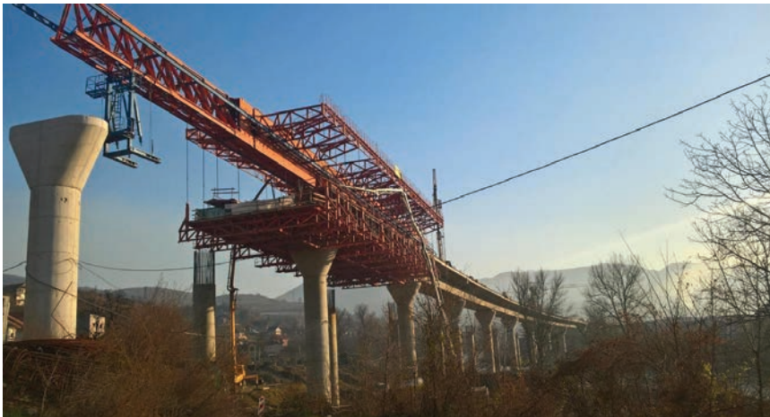
Ugradnja betona na osmom rasponu mosta Drivuša

MSS sustav gradnje omogućava lakšu gradnju rasponske konstrukcije mosta ili vijadukta. Najveća posebnost te tehnologije jest to što nosiva konstrukcija MSS skele prekoračuje raspon bez dodatnog oslanjanja. Oslanja se samo na postojeće stupove mosta. Demontaža i montaža oplata znatno je olakšana jer je i oplata