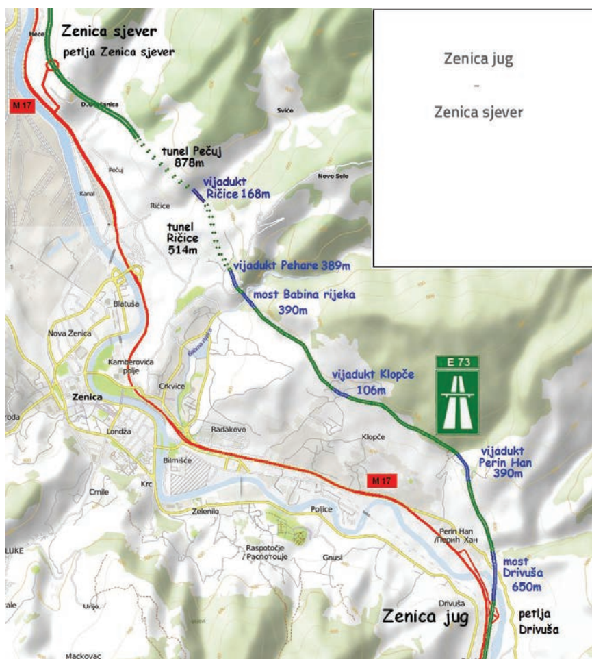
Prikaz građevina na tzv. Zeničkoj zaobilaznici

Ključan čimbenik u izgradnji koridora V.c jest bosanskohercegovačka trasa, a dovršetak izgradnje preostalih dionica kroz BiH temeljni su preduvjet isplativosti i svrsishodnosti cijelog tog projekta