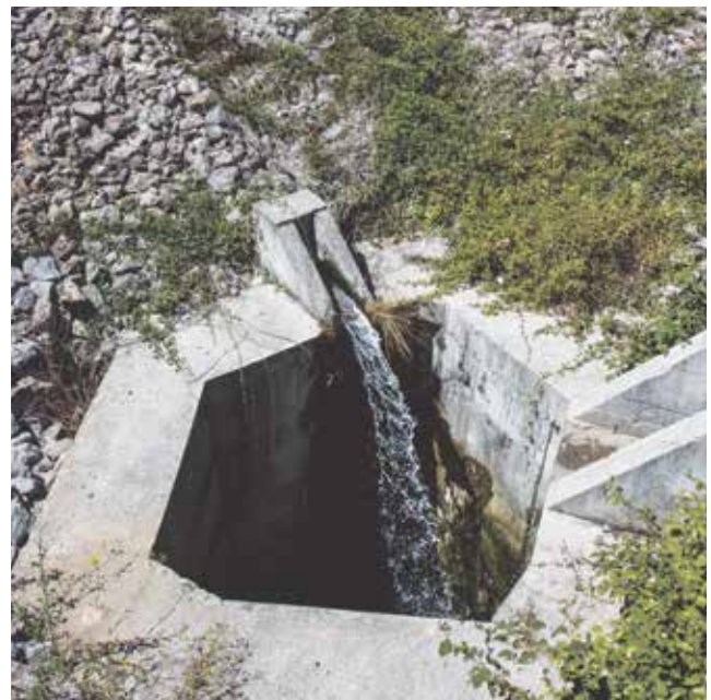
Ispuštanje pročišćenih otpadnih voda u podzemlje