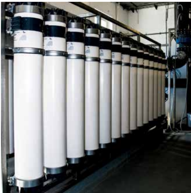
Membranska tehnologija pročišćavanja otpadnih voda UPOV-a Ogulin

To se dokazuje kontrolnim ispitivanjima parametara onečišćenja u pročišćenoj vodi. Uređaj je projektiran tako da se omogućiti jednostavna i brza provedba druge faze. Pritom svakako treba poštovati dinamiku proširenja kanalizacijskog sustava i prateću izvedbu novih priključaka, što se u idućem razdoblju planira ostvariti uz pomoć fondova Europske unije.