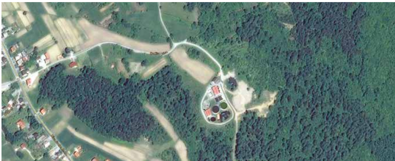
Lokacija UPOV-a u Ogulinu

zajednički projekt Unutarnje vode (Inland Waters Project) Međunarodne banke za obnovu i razvoj (IBRD) i Republike Hrvatske za poboljšanje vodoopskrbe, odvodnje i pročišćavanja otpadnih voda te zaštite od poplava u slivovima Save, Drave i Dunava. Ukupna je vrijednost projekta bila 105 milijuna eura, a bilo je predviđeno da se 45 posto novca osigura iz državnog proračuna, a ostatak su trebale osigurati Hrvatske vode i isporučitelji vodnih usluga odnosno jedinice lokalne samouprave. Projekt je završen u cijelosti, a trajao je od 2009. do 2013. godine.