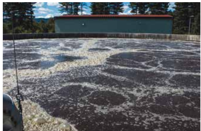
Pročišćavanje otpadnih voda u SBR reaktoru