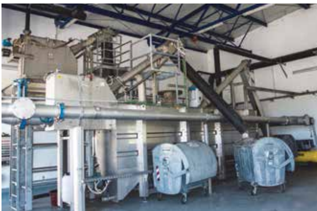
Mehaničko pročišćavanje otpadnih voda

masnoće. Pridodana mu je i fekalna stanica za prihvata sadržaja septičkih jama s automatskom rešetkom za izdvajanje krutina, induktivnim mjeračem protoka i automatskim uzorkivačem efluenta. Svi su ti tehnički uređaji priključeni na središnji ven-