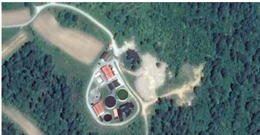
Položaj UPOV-a Ogulin i razmještaj građevina

Među građevinama ističe se upravna zgrada, smještena na sjevernome dijelu lokacije, a u njoj se nalaze oprema za nadzor, upravljanje i održavanje UPOV-a, laboratorij i soba za sastanke. Radi se o