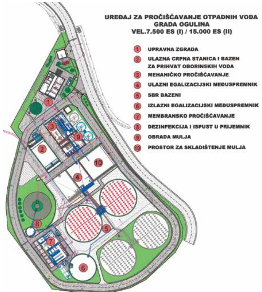
Tehničko rješenje UPOV-a Ogulin

S obzirom na to da je ogulinski kanalizacijski sustav izveden kao mješoviti, u ulaznu crpnu stanicu dotječu otpadne i oborinske vode. Zbog toga je, prema projektu, crpna stanica u prvoj fazi opremljena dvjema crpkama (radnom i rezervnom), a pritom se u sušnome razdoblju crpi do 30 l/s, a u kišnome 60 l/s vode prema građevini s mehaničkim pročišćavanjem. Kada je količina dotoka veća od 60 l/s u prvoj fazi (120 l/s u drugoj fazi), vodno se lice u crpnoj stanici podiže i višak se vode preko preljevne praga odvodi do retencijskog spremnika za oborinske vode zapremine 300 m 3 . Nakon što oborine prestanu, zadržana se voda iz spremnika gravitacijski povratno ispušta u