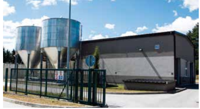
Zgrada mehaničkog pročišćavanja

manjoj prizemnici tlocrtnih dimenzija 13 x 10 m s dvostrešnim krovom.