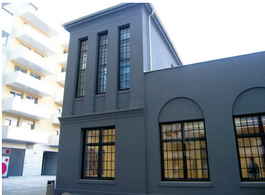
Sačuvani dio ljevaonice

Novinski su protesti potaknuti rušenjem kompleksa uzrokovali da je manji dio Tvornice braće Ševčik ipak sačuvan, a riječ je o dijelu ljevaonice koja je pretvorena u svojevrsno predvorje trgovačkog centra Spar u dvorištu stam-