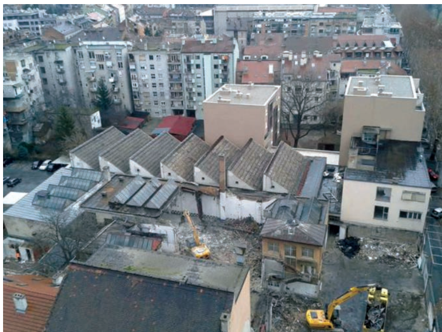
Početak rušenja kompleksa

Zagrebačka je Prvomajska , posebno njezin dio za proizvodnju alatnih strojeva, postala pravi rasadnik novih tvornica po Hrvatskoj, Vojvodini, Makedoniji i Bosni i Hercegovini, a nakon što su zatvoreni ugljenokopi, nove su tvornice nastale u Raši, Ivancu, Golubovcu, Čakovcu, Kutini, Splitu... Zagrebačka je tvornica na njih prenijela svoje znanje, organizirala proizvodnju i uvela nove sustave te osposobljavala radnike za rad. To je, među ostalim, bilo potaknuto i osnivanjem posebnog Instituta za alatne strojeve u Zagrebu te odgovarajućih razvojnih službi, ali i suradnjom s Fakultetom strojarstva