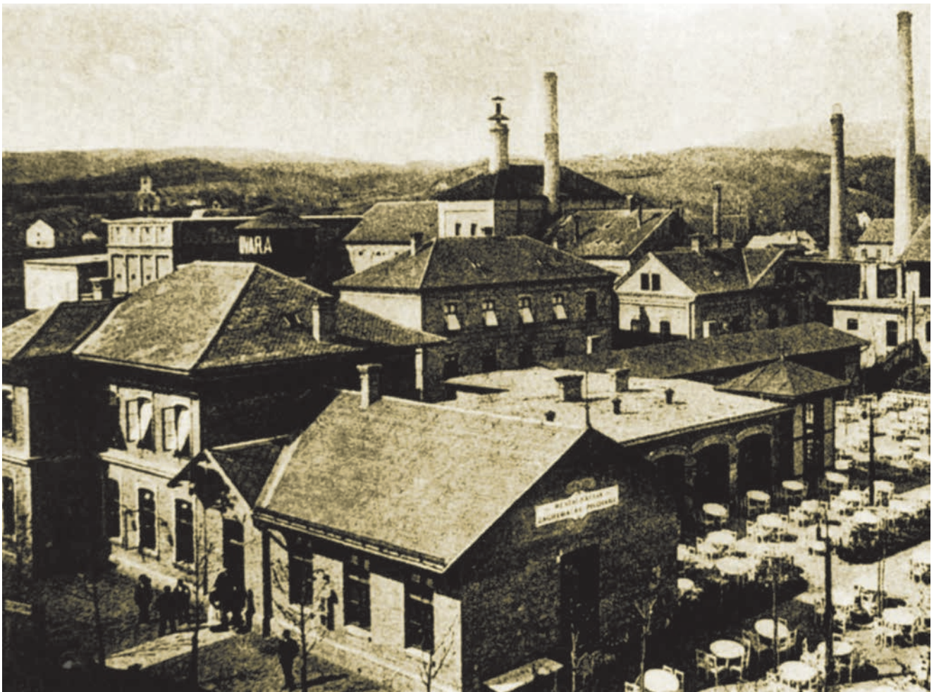
Dio sklopa Zagrebačke pivovare na staroj fotografiji

Svečano je otvorenje bilo organizirano 12. srpnja 1893. i na njemu se okupio zaista velik broj građana koje su cijelo poslijepodne dovozili tramvaji te je procijenjeno da je do zatvaranja toga dana pivovaru posjetilo ukupno do 8000 posjetitelja koje je zabavljala i vojnička glazba. Gotovo petnaest godina prije nego što je Zagreb dobio električnu struju, vrt u sklopu pivovare bio je osvjetljen raskošnom električnom rasvjetom.