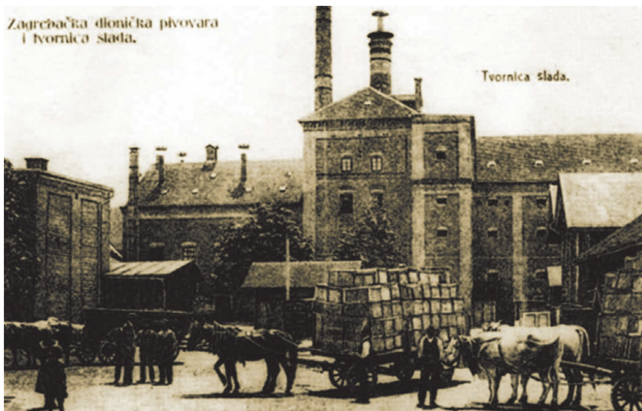
Jedna od najstarijih sačuvanih fotografija Zagrebačke pivovare

obljetnice djelovanja. Na izložbi su bile prikazane lijepo izrađene čaše za pivo, a objavljen je i prilog o statistici ratarske produkcije u posljednjih nekoliko godina, gdje je bilo uočljivo da je ječmom bilo zasijano 6,24 posto oranica, što je dovoljno za hranu za konje, ali i za potrebe pivovare i tvornice Franck . To su bile možda i najuspješnije zagrebačke godine, doba kada su Zagrebom vladali uspješni gradonačelnici dr. Milan Amruš (1848. – 1919.) i Adolf pl. Mošinsky (1843. – 1907.), ali i vrijeme kada je predstojnik Odjela za bogoštovlje i nastavu bio Isidor Iso Kršnjavi (1845. – 1927.). Zagreb je tada bio golemo gradilište, ali u grad su dolazili i drugi radnici iz Štajerske i Češke. U nekoliko se godina zbilila preobrazba Zagreba u suvremeni i privlačan europski grad. Štoviše, tada je gospodarstvenik i financijski stručnjak Adolf Hudovski (1828. – 1900.) izdao i prvi turistički vodič Zagreb i okolica – kažiput za urodjenike i strance .