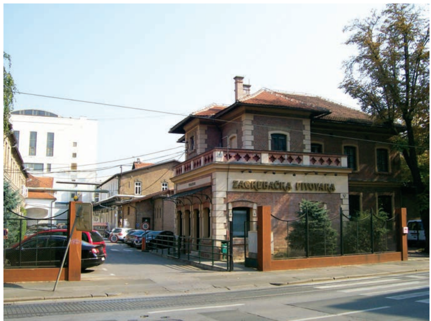
Ulaz u Zagrebačku pivovaru sa zgradom portirnice

Zagrebačka pivovara počela se graditi 1882., a temeljito je dograđivana od 1913. do 1928. Osnovni projekt izradio arhitekt Kuno Waidmann, a projekt proširenja i dogradnje građevinsko poduzeće Pilar, Mally i Bauda . Nakon Drugoga svjetskog rata izvedena su brojna rušenja, dogradnje i gradnje. Gradski je zavod za zaštitu spomenika kulture i prirode 2002. izradio konzervatorski