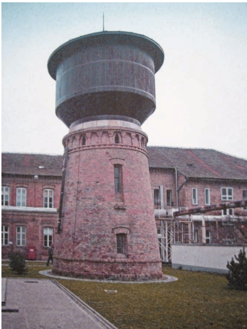
Zaštićeni vodotoranj u sklopu Zagrebačke pivovare

(Pametni). U Sisku je biran za gradskog zastupnika i bio je predsjednik Štedne i predujamne zadruge za grad i kotar Sisak. U tom je gradu kupio pivovaru i osnovao tvornicu slada, a bio je i vlasnik keramičke tvornice Titanit , kemijske tvornice Danica , tvornice cementa Croatia , ugljenokopa Mirna u Radoboju i Prve hrvatske tvornice ulja Zagreb (danas Zvijezda , koja je dio Agrokora ), a s bratom je bio i većinski dioničar Zagrebačke pivovare . Suosnivač je Sekcije za robu i vrednote (danas Zagrebačke burze ) i Zagrebačkog zbora (danas Zagrebačkog velesajma ). Posjedovao je više kuća u središtu Zagreba, godine 1919. izabran je za predsjednika Ze-