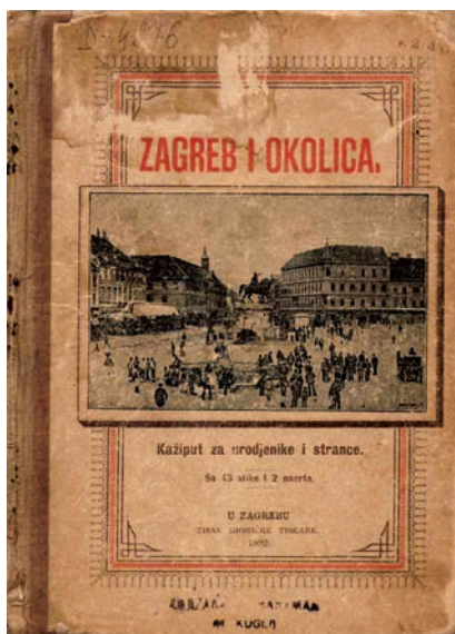
Naslovna stranica prvoga zagrebačkoga turističkog vodiča

Nešto je prije bila osnovana Hrvatska eskomptna banka (1868.), koja je okupila najuglednije trgovce karlovačkog i sisač-