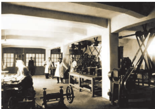
Detalj iz rada karlovačke tvrtke Kaštel d.d.

Najveći dio zapadnog dijela prostora južno od Prilaza baruna Filipovića, točnije