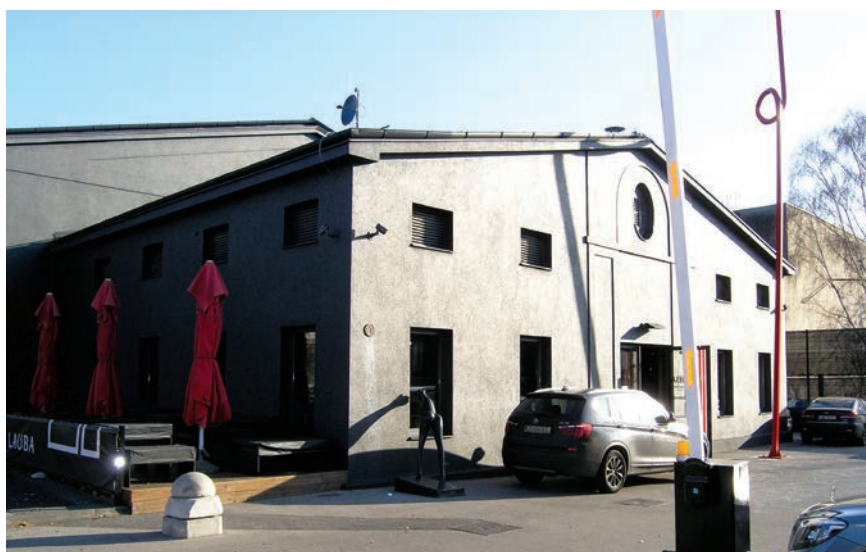
Ulazno pročelje Laube

Radovi su započeli 2010. i trajali sve do ožujka 2011. godine. Jahaonica je kao jedina sačuvana građevina iz cijeloga vojnog i industrijskog kompleksa, a obnovom je postala naš prvi primjer uspješne prenamjene vojne kulturne baštine. U suradnji sa stručnjacima iz Građanskog zavoda za zaštitu spomenika kulture i prirode pretvorena je u živi i suvremeni izložbeni i kulturni prostor koji je neobično popularan među mladima. Zanimljivo je da su ostale sačuvane vrijedne povijesne značajke, čak je građevina danas, stotinu godina nakon nastanka, prvi put u cijelosti izvedena u skladu s izvornim nacrtima. Na nju je s istočne strane bila naslonjena