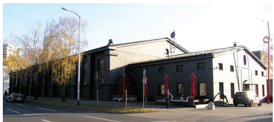
Pogled sa sjeverozapada na negdašnju jahaonicu, a današnju Laubu – kuću za ljude i umjetnost

Tvornica se tijekom gradnje 1924. proširila na prostor konjaničke vojarnje koja je s vremenom adaptirana za industrijsku namjenu, a adaptaciju je također