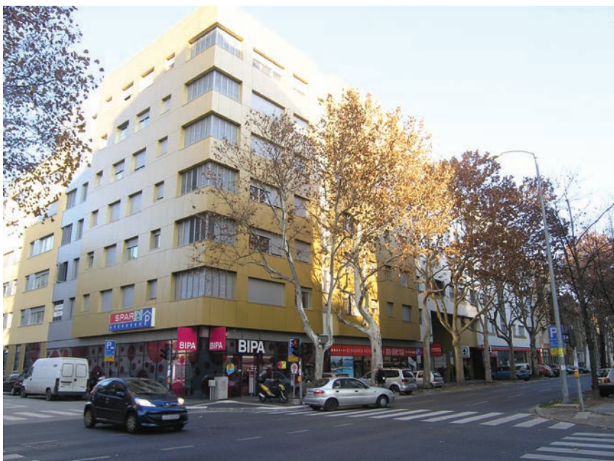
Nova zgrada na uglu Grahorove i Ulice grada Mainza

Osnivanje je pivovare potaknula izložba Hrvatsko-slavonskog gospodarskog društva 1891. u povodu polustoljetne