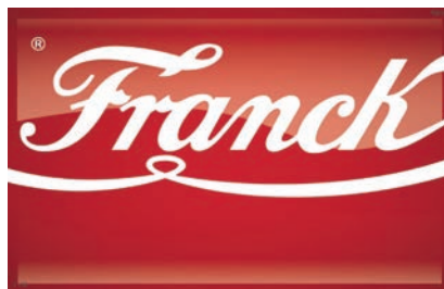
Prepoznatljiv logotip koji je zapravo potpis utemeljitelja

podružnica u Vodovodnoj ulici u Zagrebu, gdje je i danas sjedište istoimene kompanije. Tada je u Zagrebu započela i gradnja tvornice za preradu cikorije. Valja dodati da je nakon nekoliko godina otvorena i podružnica u SAD-u, a da je 1900. otvorena i prva sušionica cikorije u Bjelovaru.