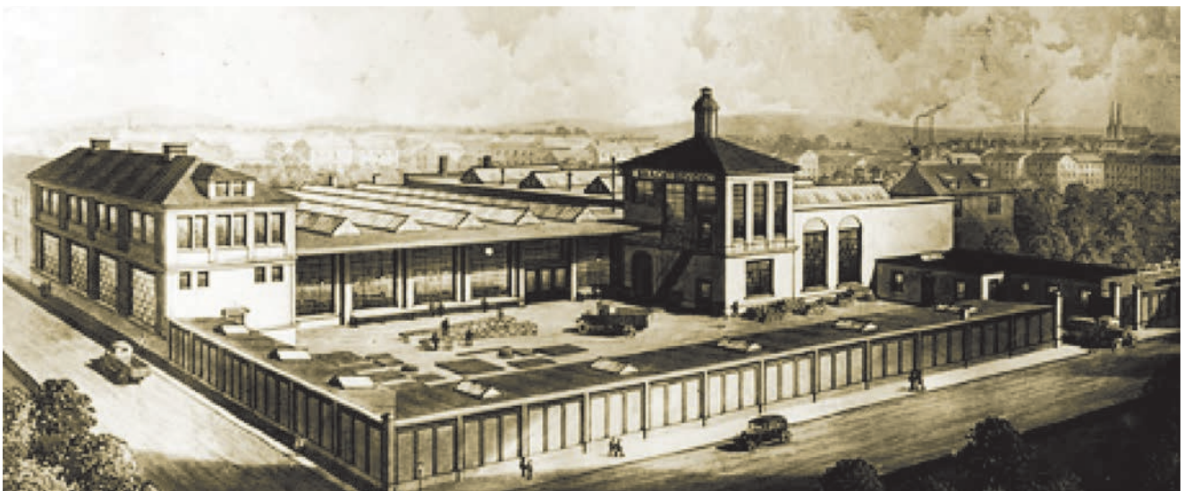
Crtež Tvornice braće Ševčik iz tridesetih godina prošlog stoljeća

Kao osnovna djelatnost radionice navedena je proizvodnja strojnih dijelova i željeznih konstrukcija za mlinove, ciglane, pilane i slično te popravak strojeva, a dobila je naziv Braća Ševčik – tvornica strojeva i ljevaonica metala . Ipak, tvornica je izvedena u prilično smanjenom opsegu jer su izgrađene samo radionice i prizemlje stambene jednogkatnice (u Grahorovoj ulici, u zapadnome dijelu kompleksa), dok druga stambena zgrada nikad nije izgrađena. Dvokatna je skladišna zgrada izvedena od opeke, s armiranobetonskim stropnim gredama i pločama te nadvojima, a krov je bio izveden kao kombinacija kosoga drve-