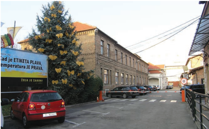
Glavna komunikacija u kompleksu Zagrebačke pivovare

nik, a kroz Hrvatsko akademsko društvo podupirao je i pomagao siromašne sveučilištarce. Svako društvo koje je imalo sreću da im Šandor bude blagajnik nikada nije imalo financijskih problema. Za Prvoga svjetskog rata organizirao je, vodio i velikim dijelom financirao "Odbor za potpomaganje nezaposlenih i invalidnih namještenika trgovačko-industrijskih struka i novčanih zavoda". U jesen 1914. u sklopu vlastitoga dobrotvornog društva Prehrana osnovao je javnu kuhinju za siromašne građane i obitelji čiji su muškarci bili pozvani na bojište tijekom Prvog svjetskog rata. Prehrana je podijelila na milijune obroka, prema nekim procjenama više od 15 milijuna obroka. Početkom je rata donirao i milijun zlatnih austrijskih kruna kao nepovratni zajam državi, a za što mu je kralj Karlo I. Austrijski dodijelio plemstvo s predikatom Sesvetski.