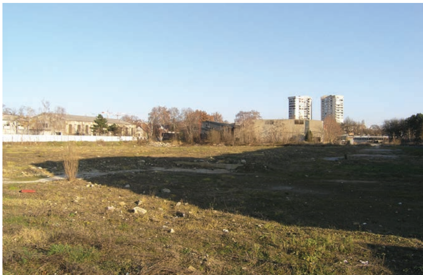
Prostor na kojemu je nekad bila Konjanička vojarna i Tekstilni kombinat Zagreb

izvelo poduzeće Eisner & Ehrlich prema nacrtima inženjera Đure Ehrlicha. Zgrade su vojarnu uklopljene u industrijsko postrojenje doživjele znatne preinake i prenamijene pa se u građevinskoj dozvoli iz 1924. spominju prostori tvorničke tkalnice, bjelačnice i strojarnice. S obzirom na novu namjenu, izvedene su brojne prilagodbe vezane uz vodovod, ventilaciju i konstrukciju.