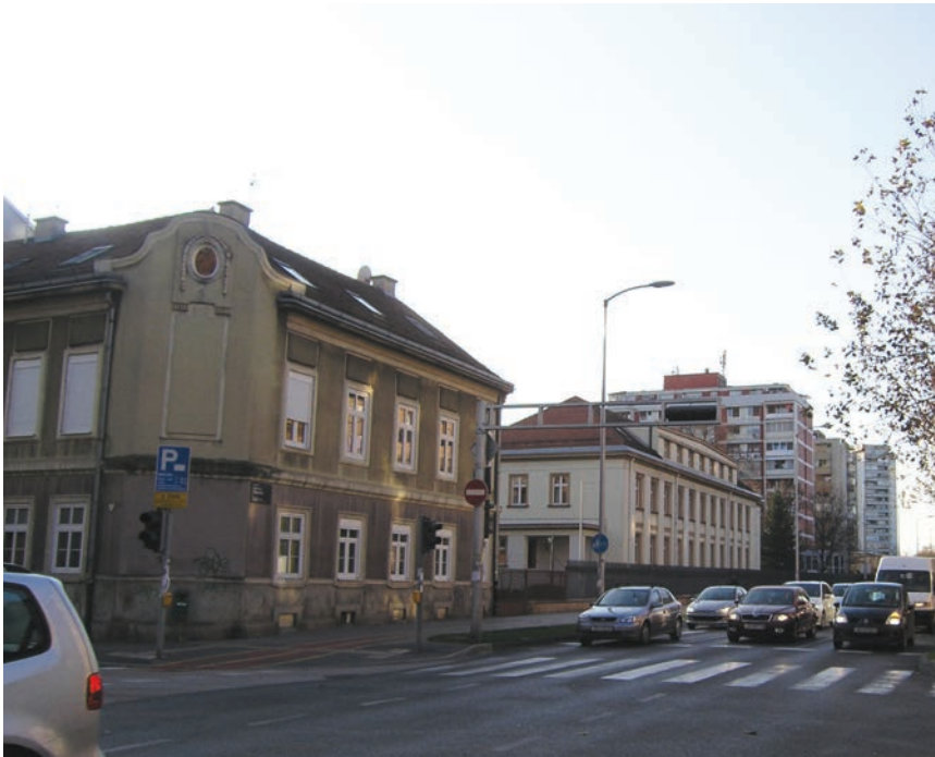
Pogled na dio tvorničkog kompleksa Francka iz Prilaza baruna Filipovića