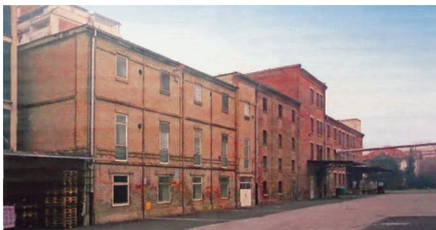
Zgrada tvornice slada unutar Franckova kompleksa

Franckov se industrijski kompleks nalazi na području kulturnog dobra nazvanog Povijesna urbana cjelina grada Zagreba, na dijelu za koji je utvrđen poseban sustav zaštite. Dakle, štite se elementi