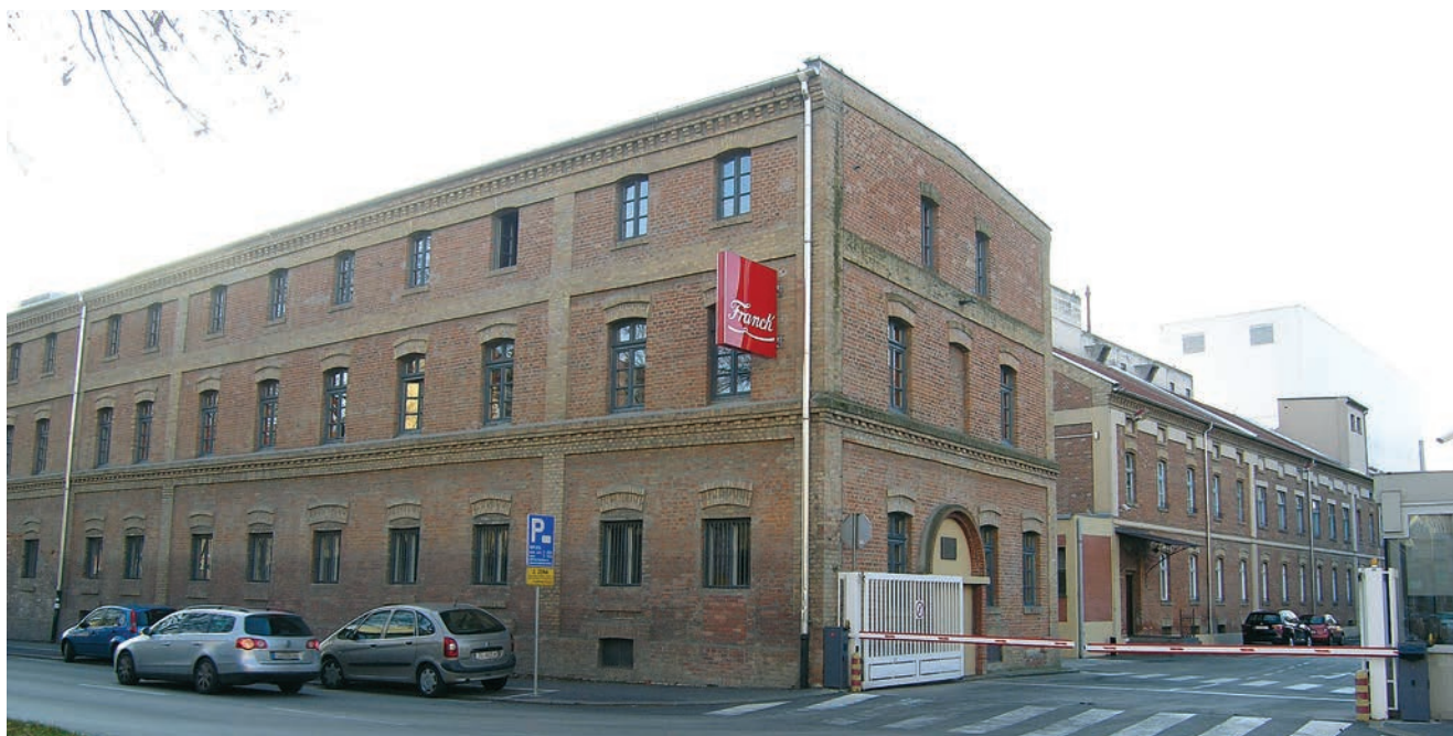
Današnji ulaz u tvornicu Franck

Projektant je osnovnog dijela tvornice Franck bio slavni Kuno Waidmann (1845. – 1921.), njemački arhitekt historizma koji je najveći dio svog opusa ostvario u Hrvatskoj. Naime, godine 1877. povjeren mu je gradnja bolnice za umobolne u ondašnjem Stenjevcu, pokraj Zagreba, pa se s obitelji preselio u Zagreb, gdje je živio i djelovao tridesetak godina, a ostvario je opus koji je znatno utjecao na razvoj hrvatske arhitekture s kraja 19. i početka 20. st. Po njegovim su projektima 1892. izgrađene Franckova tvornička zgrada, skladište sirovina te zgrade za otpremu i punjenje, ali i sa stanovima za radnike, te vratarnica, stolarija, daščara i drvarnica, a godinu potom činovnička zgrada i sušionice. Naknadno su 1895., prema projektima građevinskog poduzeća Pilar, Maly i Bauda , dograđene sušionice, a 1904. skladišta i radnički stanovi prema projektu arhitekta Martina Pilara (1861. – 1942.). Manje su intervencije u kompleksu ostvarene 1927. prema projektima Lava Kalde (1880. – 1956.), hrvatskog arhitekta šleskog podrijetla, projektanta zgrade Hrvatskog sabora (1909. – 1911.).