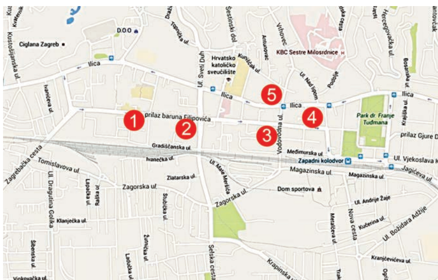
Industrijski sadržaji opisani u ovom nastavku (1 – Pliva , 2 – Lauba , 3 – Franck , 4 – Tvornica braće Ševčik , 5 – Zagrebačka pivovara )

Tvrtka Kaštel naziv je dobila prema dvorcu Dubovcu u kojemu je započela s radom, a koji je u dvadesetim godinama 19. st. kupio i preuredio feldmaršal Laval Nugent, oduševljeni Ilirac i vojni zapovjednik Hrvatske. Zadržala je naziv i nakon što je 1927. proizvodnju preselila na današnju lokaciju u Zagrebu. Kaštel je počeo istraživati i proizvoditi nove vrste lijekova pa je već 1936. u suradnji s prof. dr. sc. Vla-