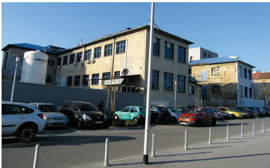
Najstariji sadržaji Plivina kompleksa uz Cankarevu ulicu

dimirom Prelogom, dobitnikom Nobelove nagrade za kemiju 1975., među prvima u svijetu počela proizvoditi sulfanilamid, spoj koji se sastoji od anilina nastalog na sulfanamidonoj skupini, koji je pod nazivom Streptazol doživio golem tržišni uspjeh u cijelome svijetu. Godine 1940. osnovan je Plibah , Banovinski zavod za proizvodnju lijekova biološkog i kemijskoga sastava, koji je 1941. preimenovan u Plivu , Državni zavod za proizvodnju lijekova i vakcina, a od 1945. u njegovu je sastavu i tvrtka Kaštel . Treba još dodati da je 1952. utemeljen Plivin Istraživački institut, a da su 1953. vlastitom tehnologijom proizvedene prve količine vitamina C koji je potom postao Plivin najvažniji proizvod. Daljnja su istraživanja 1980. omogućila patentiranje makrolidnog antibiotika azitromicina, poslije poznatog pod nazivom Sumamed .