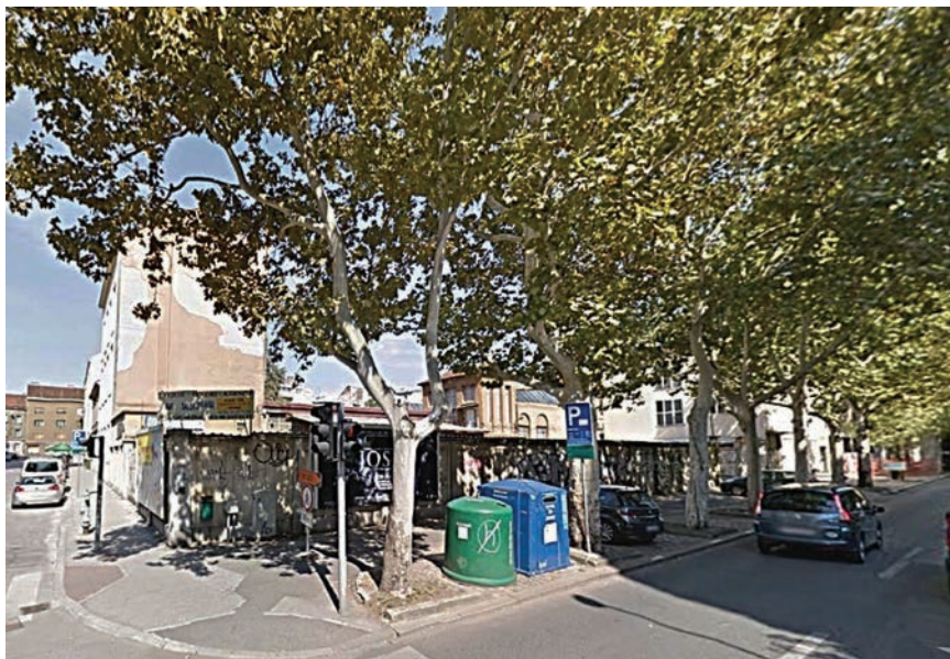
Prostor negdašnje Tvornice braće Ševčik prije rušenja

nog krovništva prema ulici i ravnog krova s armiranobetonskom konstrukcijom nad drugom polovicom zgrade. Na tu se zgradu prema istoku nastavljala strojar-ska radionica pravokutnog tlocrta čiji su zidovi bili betonski, a raspon je svladan metalnom rešetkastom konstrukcijom, na koju se oslanjala metalna dvostrešna krovna konstrukcija ispunjene staklom, čime je omogućeno dobro osvjtljenje proizvodnih prostora. Jedina građevina koja je dominirala prostorom bio je prostor ljevaonice u visini dvokatnice s dimnjakom koji je poslije srušen. Sve su zgrade imale krovne vijence i jednostavnu plitku plastiku oko vanjskih otvora. Oko cijelog je kompleksa bio izgrađen betonski zid visok 2,8 m.