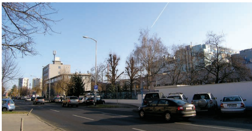
Dio Plivina kompleksa s upravnom zgradom u Prilazu baruna Filipovića

Pliva je bila vlasnik više od 380 patenata. Od 2005. svoje je istraživačke aktivnosti usmjerila na razvoj generičkih lijekova. Dioničko je društvo postala 1993., kada je imala 7500 zaposlenih, a 1996. dionice su joj uvrštene na Zagrebačku i Londonsku burzu. Poslovanje je proširila pripajanjem više farmaceutskih kompanija u Poljskoj, Češkoj, Njemačkoj, Velikoj Britaniji i SAD-u i sredinom je prošlog desetljeća ostvarivala prihod od 4,5 milijardi kuna. Prodana je 2006. za 2,3 milijarde dolara američkoj kompaniji Barr Pharmaceuticals, Ltd. , koja je danas također u Teva Grupi .