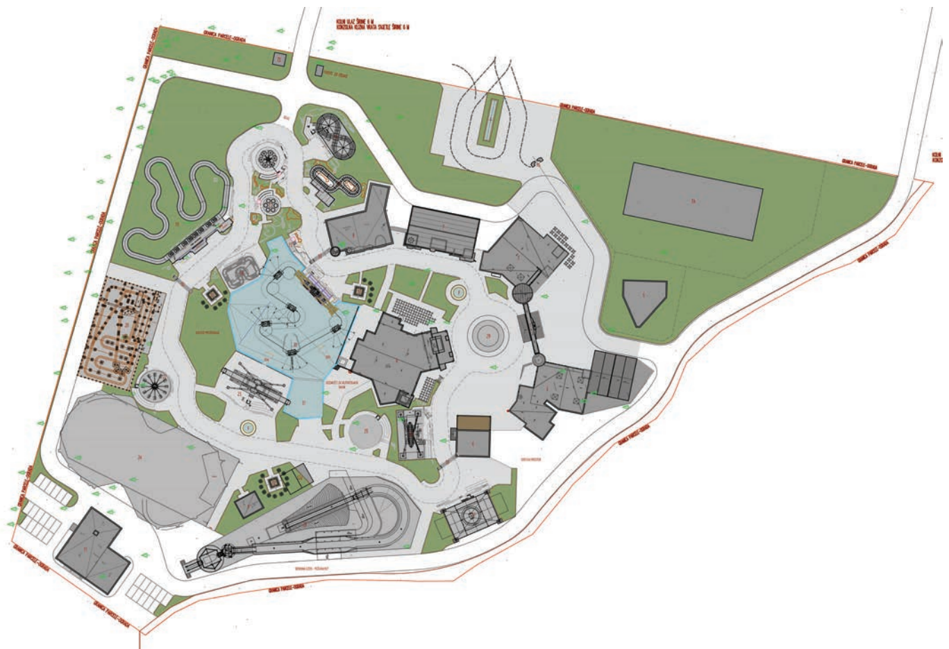
Situacija zabavnog parka Mirnovec (M: 1:1000)

kojemu će vožnje biti najbrže i najveće. Svaka cjelina imat će svoje ulaze. Doznali smo i to da je Spillwater jedna od glavnih atrakcija obiteljskog dijela, dok će se u svemirskome dijelu nalaziti vlakovi smrti te panoramsko kolo visoko 30 m po uzoru na bečki Prater .