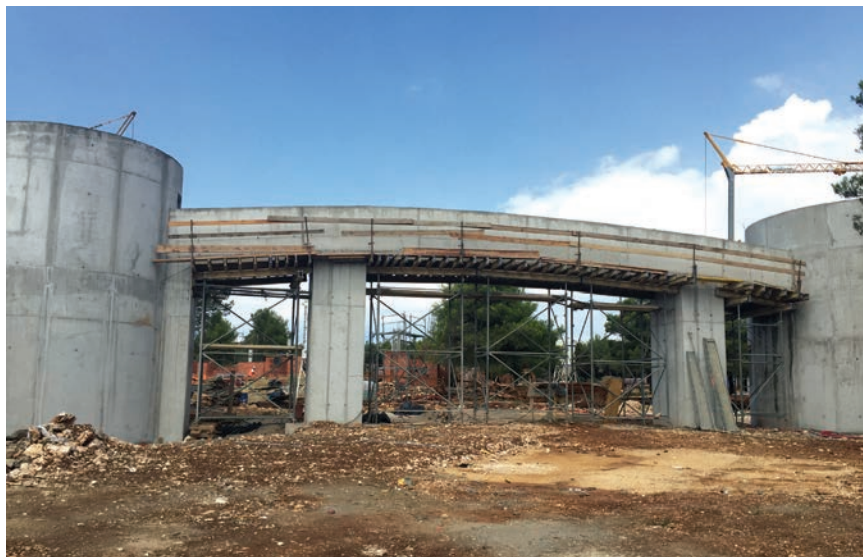
Izvođenje glavnog ulaza u park Mirnovac

Lociran je uz Jadransku magistralu i spojni cestu do turističkog naselja Crvena luka, a prostirat će se na 4,5 hektara površine s mogućnošću širenja.