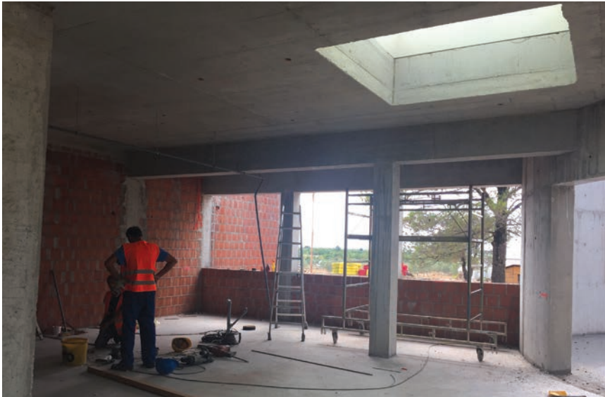
Detalj s gradilišta

takozvanim Gunita postupkom (polistirenska izvedba s odgovarajućom zaštitom i bojanjima kako bi kulise bile vodootporne, a istodobno ne bi opterećivale konstrukciju svojom masom). Ispričao nam kako, tematski gledano, pojedine građevine pripadaju različitim razdobljima iz povijesti i budućnosti, a vizualizacija konačnog izgleda građevina dio je autorskog rada talijanskog arhitekta Franca Barazzonija.