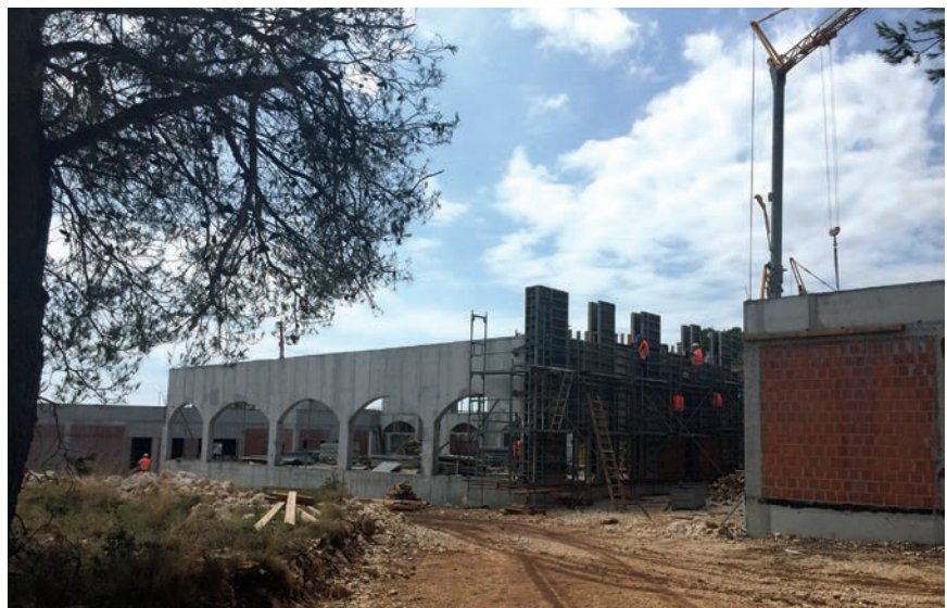
Izvođenje zgrade u kojoj će biti električni automobili

Obilazak smo započeli pokraj buduće-ga glavnog ulaza u park Mirnovac , koji je smješten s južne strane parcele i do njega vode prilazne ceste s jugoistoka. Na ulazu u park nalazit će se zaštitni znak svakoga tematskog parka – karusel. Glavni ulaz zapravo je spojni most koji povezuje građevinu sa zabavnim igrama na zapadnoj strani te zgradu Uprave s istočne strane. Taj most ima dvoja bočna vrata, a u središnjem dijelu nalazi se šest ulaznih kontrolnih prolaza i tri izlaza. Ulazna vrata izvedena su od kovane bravarije, a ulazni i izlazni prolazi opskrbljeni su uređajima za