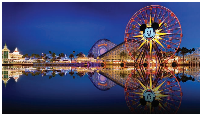
Sadašnji najčešći izgled tematskog parka Disneyland u Kaliforniji

Veliki procvat zabavnih parkova dogodio se krajem 19. stoljeća, a poticaj su im bile prve svjetske izložbe koje su privukle velik broj posjetitelja. Tako je nakon Svjetske izložbe u Beču 1873. na istome prostoru izrastao zabavni park Prater s