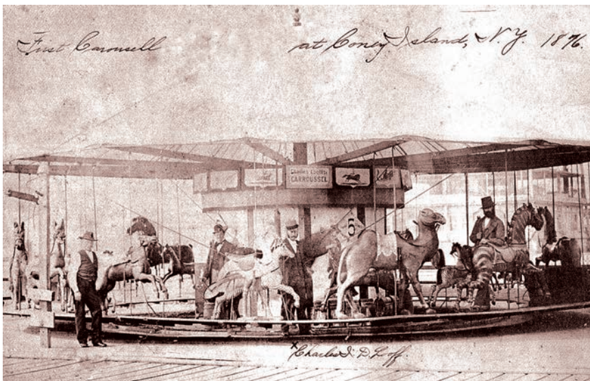
Najpoznatiji tematski park u 19.st. - Coney Island

cijama ondašnjeg doba: prikazanjima relikvija i čuda iz života svetaca, egzotičnim životinjama i sličnim stvarima.