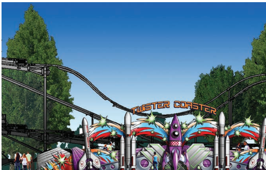
Adrenalinska atrakcija Twistercoaster

Na sjevernom dijelu predviđen je hostel za smještaj zaposlenika unutar zabavnog parka koji će biti izgrađen kao dvoetažna građevina maksimalnih dimenzija 24 x 24 m, a zaposlenicima će na raspolaga-