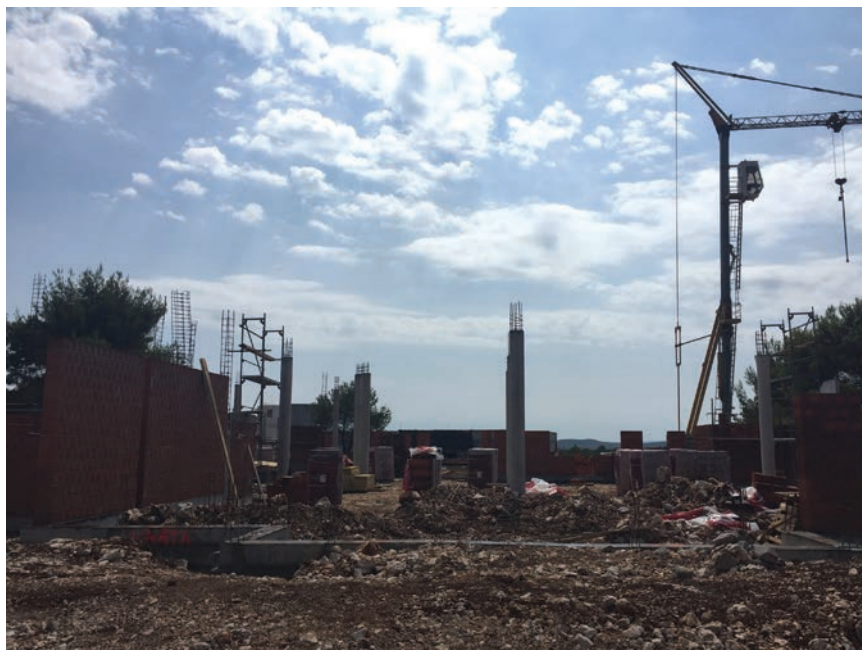
Detalj s gradilišta

Hrvatska je u svijetu prepoznata kao turističko odredište, osobito po moru, lijepim plažama i izvrsnim restoranima, a tematski Zabavni park Mirnovac bit će "pun pogodak" i pravo osvježenje na turističkoj sceni. Osim što će biti važan za lokalnu zajednicu, osobito zbog zapošljavanja lokalnog stanovništva, ta investicija ima iznimnu važnost za daljnji razvoj obiteljskog i gastronomskog turizma u regiji, ali i cjelokupne ponude turističkih sadržaja Hrvatske. Projekt prate velika očekivanja jer je atipičan upravo zbog sadržajnog proširenja turističke ponude kakva još nije bila viđena u Hrvatskoj. Prema procjenama investitora, ta bi se investicija trebala isplatiti za od osam do devet godina, ne računajući pritom tržišta iz susjednih zemalja.