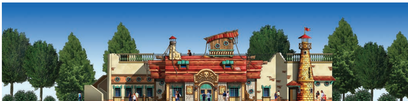
Vizualizacija zgrade restorana