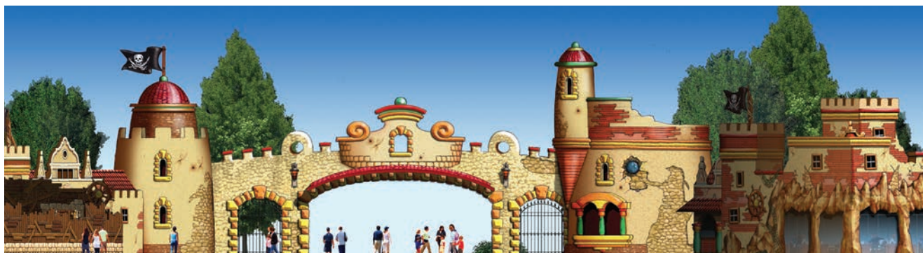
Vizualizacija glavnog ulazak u Park