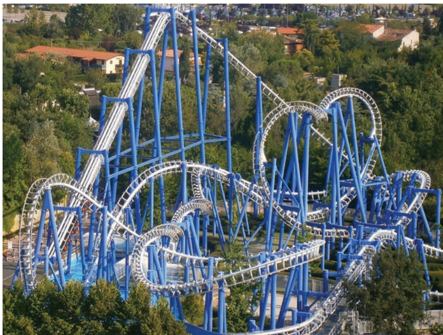
Popularna atrakcija Blue Tornado u talijanskom Gardalandu

mačkoj te Tivoli Gardens u Danskoj. Gardaland u Italiji već je tradicionalno odredište Hrvata, a brojne turističke agencije nude paket-aranžmane za odlazak u to popularno talijansko odredište.