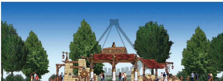
Vizualizacija gusarskog broda

nju biti i smještaj sa 42 parkirališna mjesta. Na prvome katu smještene su sobe i dva apartmana, dok će se u prizemlju nalaziti prostorije za popravke i servisiranje raznih aparata i uređaja.