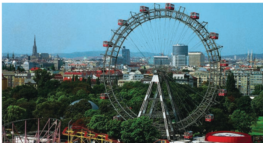
Panoramsko kolo se gradi po uzoru na bečki Prater

U zabavnom će parku biti i kazalište koje čine otvoreno gledalište amfiteatralnog oblika i natkrivena pozornica