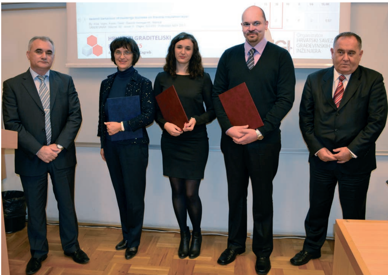
Dobitnici nagrada Hrvatskog graditeljskog foruma 2015

U radu je dan pregled ugovornih modela koji se pojavljuju u građevinskoj praksi. Za svaki su model iznesene njegove prednosti i mane te prijedlozi moguće primjene. Opisani su sudionici u gradnji u funkciji određivanja njihovih među-