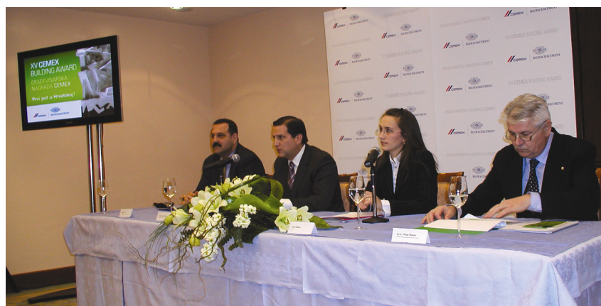
S konferencije za novinare

Pobjednici međunarodnog natječaja za Građevinarsku nagradu Cemex proglašavaju se na velikoj svečanosti u Monterreyu, u Meksiku, gdje je i sjedište tvrtke. Ovogodišnja završna svečanost u Monterreyju održat će se 3. studenoga. Građevinarska nagrada Cemex potvrđuje i predanost kompanije Cemex i Dalmacijacementa društveno odgovornom poslovanju, jer je jedan od kriterija po kojima se ocjenjuju radovi i zaštita okoliša.