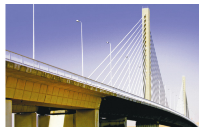
Slika 3. Prošlogodišnji pobjednici Infrastructure, Aswan Bridge, Egipat

s ostalim radovima koji sudjeluju u međunarodnom natječaju uključuju u Zbornik Cemex Building Award .