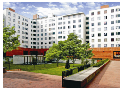
Slika 1. Prošlogodišnji pobjednici Housing, Altgracia Residential Complex, Kolmbija

Pobjednici u pojedinim kategorijama nagrađuju se posebnom Cemex plaketom i njihovi se radovi zajedno