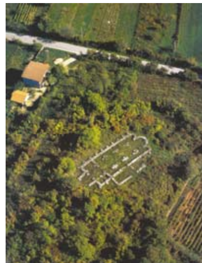
Pogled iz zraka na ostatke crkve u Biskupiji kraj Knina

Drugom razdoblju predromaničkoga crkvenog graditeljstva pripada ono od početka 9. do početka 11. st., vrijeme u kojem se Hrvatska konstituirala kao franačka pogranična pokrajina, a potom kao samostalna država. Za vladavine Vladislava i Mislava, a dijelom i Trpimira, za vjerske se potrebe preuređuju prijašnje crkvene građevine (poput crkve Sv. Marije na Crkvini, samostanskog kompleksa u Rižinicama i crkve u Žažviću), a za vladavine kneza Trpimira započinje, za ondašnje prilike, gradnja monumentalnih crkvenih građevina. Njima glavno obilježje daju jaki zabljeni potpornji naslonjeni na plohu vanjskog zida, potom westwerki i aksijalni zvonici, troapsidalna svetišta te bogati crkveni namještaj s imenima darovatelja, na temelju kojih je utvrđena kronologija gradnje [14], [15], [16]. Zajednička stilska obilježja, društveno podrijetlo investitora (uglavnom hrvatski vladari i drugi visoki hrvatski dostojanstvenici, poput banova i župana) te smještaj u političko središte hrvatske ranosrednjovjekovne države (okolica Knina i Zadra), te su crkve istraživači ranosrednjovjekovne kulturne baštine nazvali "vladarskom predromaničkom skupinom" [18] ili "vladarskom predromanikom" [14].