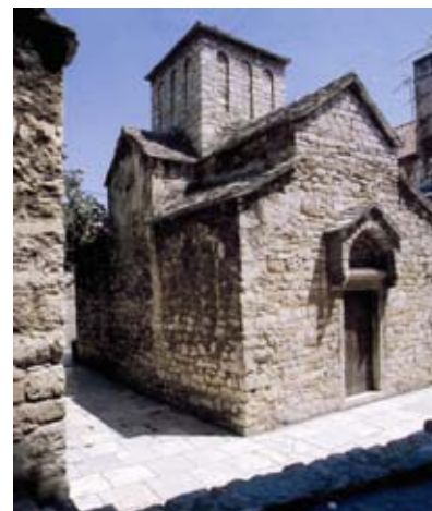
Crkva Sv. Mikule u Splitu

(1930.), koji je godinama istraživao Salonu, a uzore ranosrednjovjekovne umjetnosti, posebno crkvene graditeljske baštine, pronalazio u kontinuitetu i tradiciji antičke umjetnosti. Između tih je suprotnosti Ljubo Karaman [3] koji sve tumači relativnom slobodom stvaralaštva nastalom u jednoj periferijskoj sredini. Karaman je inače kritički pobio sve jednoznačne izvore dalmatinske predromanike: bizantsku, italsku, maloazijsku ili perzijsku, ali je najoštrije i najuspješnije napao svog bivšeg profesora