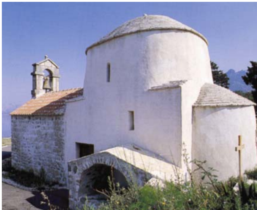
Crkva Sv. Jurja u Rovanjskoj

Na teorije i povijest umjetnosti značajno su utjecali teoretičari tzv. "bečke