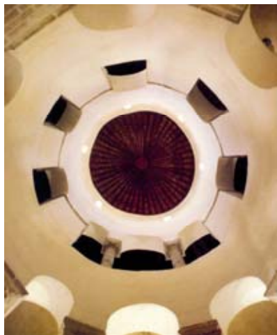
Pogled na unutrašnjost i rotondu crkve Sv. Donata u Zadru

očuvana na cijelome području Hrvatske – crkva Sv. Donata u zadarskoj katedralnoj sklopu. Tu je rotondu, izvorno posvećenu Sv. Trojici, izgradio zadarski biskup Donat na prijelazu iz 8. u 9. st., barem kako tvrdi tradicionalna hrvatska historiografija. 2 Crkva svjedoči o gospodarskoj snazi tadašnje zadarske komune i njezine kršćanske zajednice, dovoljno bogate da izgradi takvo monumentalno crkveno zdanje, ali stilskim i graditeljskim značajkama ukazuje na mogućnost da je tijekom gradnje (najvjerojatnije za dugogodišnjega franačko-bizantskoga rata) Zadar bio i pod franačkom vlašću. Iako o