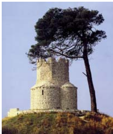
Crkva Sv. Nikole pokraj Nina

Trećemu razdoblju ranosrednjovjekovnoga crkvenog graditeljstva, koje je zapravo prijelaz iz predromaničke u ranoromaničko stilsko razdoblje, pripada razdoblje od početka 11. pa do početka 12. st. To je vrijeme u kojem je Hrvatska samostalna država pod vlašću kraljeva iz dinastije Trpimirović i Svetoslavić i kada doživljava pun politički, gospodarski i kulturni prosperitet. Pod utjecajem benediktinaca grade se crkve s ranoromaničkim obilježjima, a na predromaničkoj tradiciji crkve koje pripadaju regionalnom dalmatinskom ranoromaničkom graditeljstvu [4], [6], [7]. Prvu skupinu, koju pripadaju crkve Sv. Petra u Osoru, Sv. Marije u Ninu, Sv. Marije u Zadru, Sv. Ivana u Biogradu i Sv. Petra u Supetarskoj Dragi na Rabu [4], [6], [7], karakteriziraju tri broda, tri apside, istaknuti zvonik i pojava skulpture na pročelju, druga skupina, u koju pripadaju crkve Sv. Petra i Mojsija u Solinu, Sv. Nediljice te Sv. Lovre u Zadru, Sv. Eufemije i Sv. Nikole u Splitu [4], [17], uza sve graditeljske