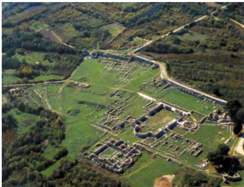
Pogled iz zraka na episkopalni crkveni kompleks u Solinu

ra Strzykowskog i njegovu tezu da se staro crkveno graditeljstvo razvilo iz drvene gradnje poznate na nordijskom prostoru.