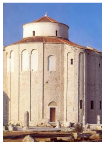
Crkva Sv. Donata (prije Sv. Trojice) u Zadru

Osim preuređenja starih građevina za liturgijske potrebe preživjeloga rimskog stanovništva i tek pokršte- nih Hrvata, u tom se razdoblju gradi jedna od najvećih hrvatskih predro- maničkih crkava, ujedno i najbolje