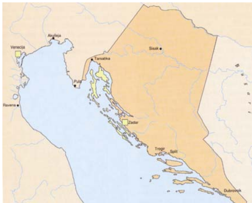
Hrvatska kneževina s pridruženom piše Neretvanskom u 9. st.

Graditeljstvo kršćanskih vjerskih građevina na hrvatskome prostoru započinje još u vrijeme rimskih careva Konstantina I. Velikog (oko 306.-337.) i Valerija Licinija (308.-