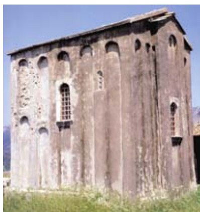
Crkva Sv. Mihajla u Stonu

Sve u svemu, predromaničko i ranoromaničko crkveno graditeljstvo na hrvatskome prostoru, s više od stotinu građevina raznolikih tipova i oblika, sačuvanih u cijelosti ili u skromnim arheološkim ostatcima, nastalo je pod snažnim kulturnim utjecajem Franačkoga i Bizantskog Carstva te redovnika benediktinskoga reda. Trajanje tih stilskih razdoblja na hrvatskome prostoru od 8. pa sve do kraja 11. st. poklapa se s razdobljem političko-teritorijalnog konstituiranja i egzistiranja Hrvatske kao neovisne države pod vodstvom knezova i kraljeva iz dinastije Trpimirović. Kako se predromaničko i ranoromaničko crkveno graditeljstvo, zajedno s drugim oblicima umjetnosti toga doba, razvijalo u neovisnoj Hrvatskoj, sta