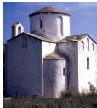
Crkva Sv. Križa u Ninu

U 10. st. uočljivo je miješanje franačkoga i bizantskoga graditeljskog stila na hrvatskome prostoru. O snažnom franačkome kulturnom utjecaju na gradnju predromaničkih crkava u bizantskim kneževinama (Neretvanskoj, Zahumskoj i Travunjskoj) svjedoče i adaptacije starijih crkava kojima se prigraduju aksijalni zvonici i westwerki , a o bizantskom utjecaju svjedoči pojava kupola iznad uzdužnih brodova. Postojanje "franačkoga" westwerka i aksijalnog zvonika na crkvicama slavenskih jadranskih kneževina, kao što je slučaj s crkvom Sv. Mihajla pokraj Stona ili s crkvom u obližnjem Ošlju [18], te "bizantskih" kupola na crkvama Hrvatskoga Kraljevstva, kao što je to slučaj s mauzolejom hrvatskih kraljeva – crkvi Sv. Petra i Mojsija u