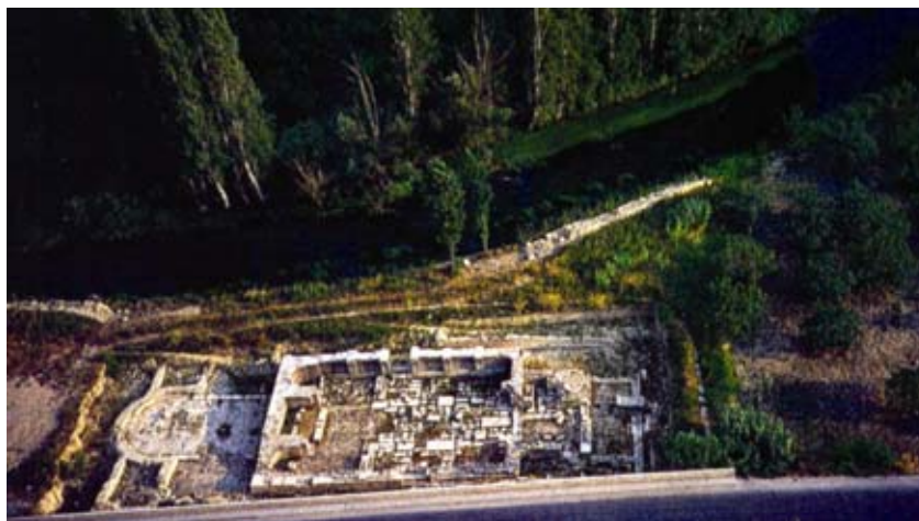
Ruševine crkve Sv. Petra i Mojsije (tzv. Šuplja crkva) – krunidbena crkva kralja Zvonimira

Osim tih velikih crkava, koje podižu knezovi, kraljevi i drugi dostojanstvenici, na području ranosrednjovjekovne Hrvatske u 9. st. grade se i brojne male crkve raznolikog tlocrta. Među njima su po originalnosti oblika najdojmljivije crkve peterolisonog, šesterolisonog i osmerolisonog tlocrta, čiji je središnji prostor pokriven