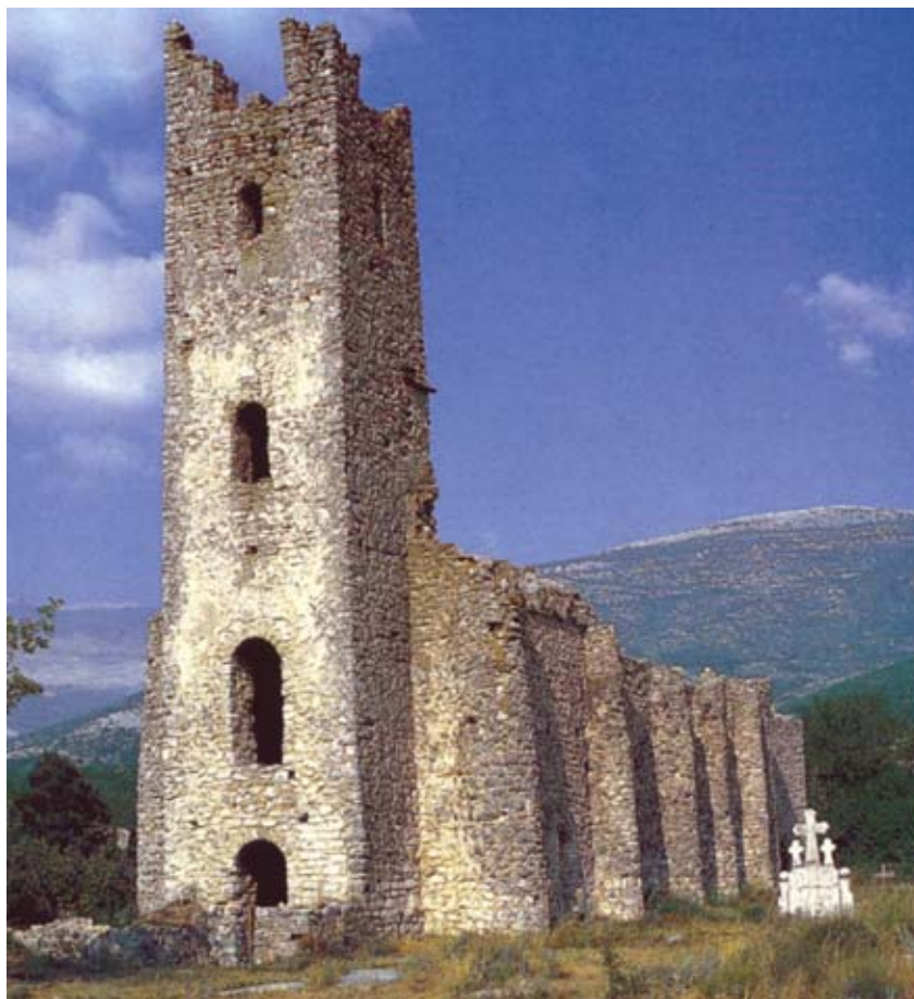
Ostaci crkve Sv. Spasa na vrelu Cetine

Velika brojnost predromaničkoga i ranoromaničkoga crkvenog graditeljstva na području današnje Hrvatske, uglavnom na obali, otocima i nepo-