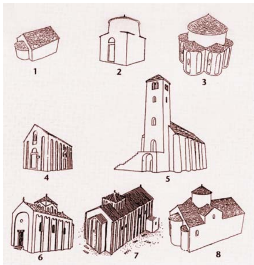
Rekonstrukcija izvornog izgleda nekih predromaničkih crkava u Dalmaciji. 1. Sv. Juraj u Splitu, 2. Sv. Pelegrin na Dugom otoku, 3. Sv. Trojica u Splitu, 4. Sv. Juraj u Paštel Starom, 5. Sv. Spas na vrelu Cetine, 6. Sv. Petar u Omišu, 7. Sv. Stjepan u Solinu, 8. Sv. Eufemija u Splitu

324.), za čije je vladavine 313. Milan- skim ediktom kršćanstvo izjednače- no s rimskom vjerom. Osobito se razvija za cara Teodozija Velikog (379.-395.), za čije je vladavine 380. kršćanstvo proglašeno državnim religijom. Ti su događaji potaknuli veliku graditeljsku aktivnost kršćana široj Rimskoga Carstva, pa i na pod- ručju današnjega hrvatskoga držav- nog prostora. Razdoblje prve polo- vice 4. st. na tom prostoru obilježav- aju kršćanski oratoriji podignuti u privatnim kućama (poput tzv. orato- rija A u Saloni), a drugo razdoblje kršćanskoga graditeljstva koje je, uz prekide, nastavljeno do druge polo- vice 6. st., obilježavaju velike krš- ćanske bazilike. Najpoznatiji su sklop tzv. gradske bazilike (uključu- je episkopij, katekumenij i baptiste- rij) u antičkoj Saloni, ostatci triju