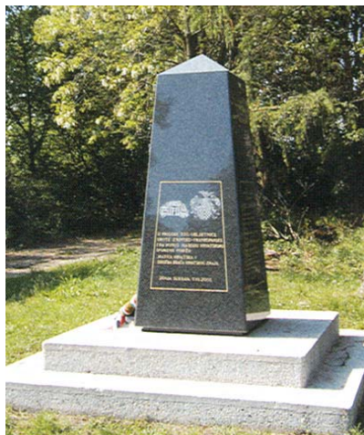
Obelisk na mjestu utvrde Novi Zrin

Bili smo i na obali Mure gdje je u blizini skelarskog prijelaza postavljeno spomen-obilježje na 330. obljetnicu Zrinsko-frankopanske urote. Tamni je obelisk postavila družba Braće hrvatskog zmaja , a čini se da će mjesto utvrde uskoro s druge strane obilježiti i Mađari koji inače obavljaju velike istražne radove. Na kraju smo bili u Legradu. Tu dakako nismo tražili utvrdu jer bi se njezini ostaci, da ih uopće ima, morali nalaziti na drugoj obali Drave. To je inače do 1918. bilo veliko trgovačko i cehovsko središte s više od 5000 stanovnika, tada znatno veće i razvije-