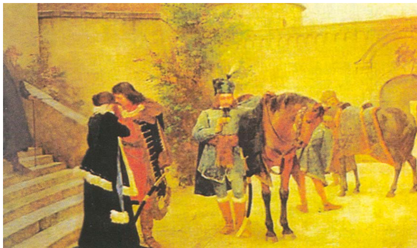
Oproštaj Katarine i Petra Zrinskog na slici Otona Ivekovića

bedeme i kamena plastika, a u konstrukciju su ugrađene zatege. Tada je ulazni bastion natkriven zaštitnim krovijem. Program sanacije prekinut je 1995. i nastavak bi trebao uslije-