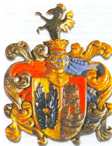
Grb obitelji Zrinski

su obnovljene i posvećene stare i zapuštene crkve. Juraj V. je 1622. proglašen hrvatskim banom. Odmah se počeo isticati u borbama s osmanlijskom vojskom, ali su Turci dvaput (1623. i 1625.) provalili u Međimurje i vratili se u Kanižu s bogatim plijenom i mnogo zarobljenika. Juraj V. je na poziv kralja Ferdinanda II. sudjelovao u Tridesetogodišnjem ratu, gdje se isticao hrabrošću i vojnom vještinom. U vojnom ga je taboru 1626. (imao je 27 godina) u Požunu (Bratislavi) iz zavisti otrovao vrhovni zapovjednik carske voj-