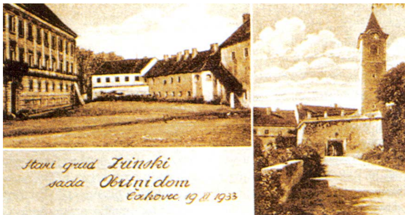
Stara razglednica Čakovca s motivima utvrde

nije od petnaestak kilometara udaljene Koprivnice. Danas zbog smanjenog prometa Dravom i prometne izoliranosti ima manje od 1500 sta-