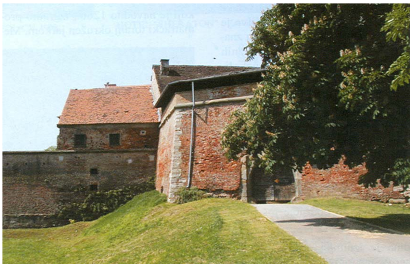
Glavni ulaz u utvrdu

se spominju već u 11. st. Jedna je grana Bribirskih poslije dobila vlastelinstvo Zrin i od tada se dio te velikaške obitelji potpisuje kao Zrinski. S vremenom su stekli veliko bogatstvo, a na vrhuncu slave su bili upravo u doba Nikole Šubića Zrinskog. Posjedi su im se protezali u cijeloj Hrvatskoj, od Bakra do Čakovca, pa dalje u Prekmurje i Mađarsku. Međimurje je bilo najvrednije i najveće vlastelinstvo, a Čakovec sjedište cijeloga golemog posjeda.