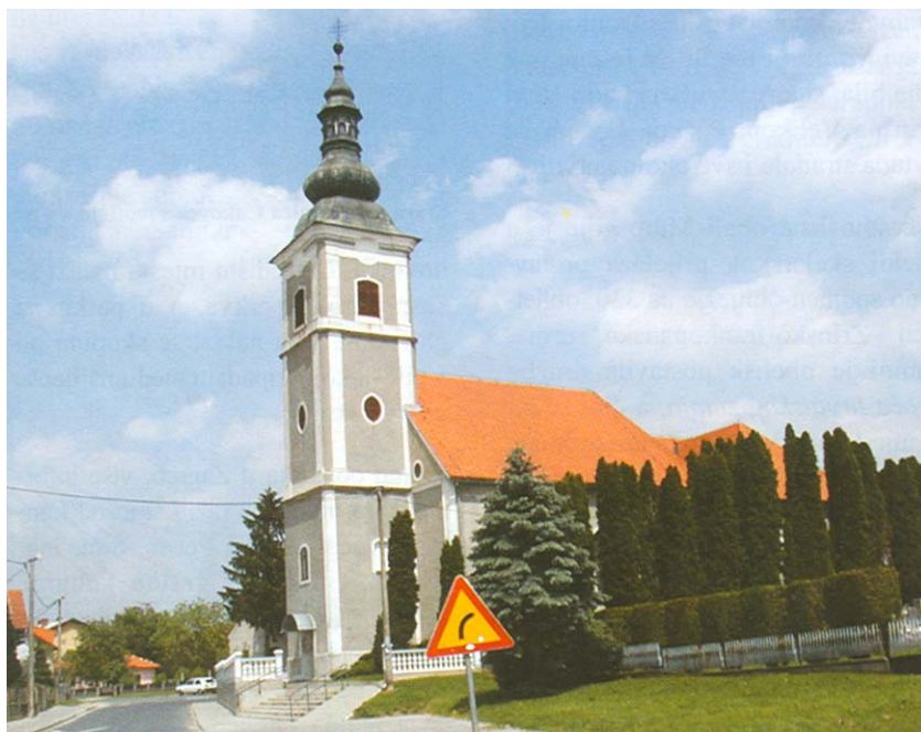
Crkva u središtu Podturena

Nakon Prvoga svjetskog rata Međimurje je ostalo u sastavu Mađarske, ali je spontananim oružanim akcijama priključeno Kraljevini SHS i poslije Jugoslaviji. Na odluku mirovne konferencije o pripojenju matičnoj državi utjecala je činjenica da je etnomuzikolog dr. Vinko Žganec uspio skupiti 15.000 lokalnih napjeva koji su svjedočili o slavenskom podrijetlu stanovništva. Međimurje je bilo od Mađarske okupirano i u Drugom svjetskom ratu. Tada su mnogi bili mobilizirani, a krajem rata potpuno