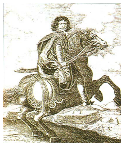
Ban Nikola VII. Zrinski u grafičkom prikazu Johanna Hoffmanna

Nikola VII. Zrinski (1620.-1664.) zajedno je s bratom završio humanističke znanosti u Grazu i retoričke znanosti na isusovačkom sveučilištu u Trnavi. Već je 1637. proglašen punoljetnim, a nakon deset godina postao je hrvatskim banom i to ostao do smrti. Nikola je bio nesumnjivo inspiriran slavnim djelima svog pradjeda čije je i ime nosio. I on se borio u Tridesetogodišnjem ratu gdje je zbog izuzetne hrabrosti dobio naslov "general svih hrvatskih četa". Proslavio se u mnogim bitkama s Turcima, izgradio jednu novu i jaku tvrđavu,