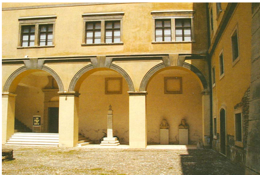
Dio aule četvrtaste palače s kipovima

Legrad je bio samo prva u nizu utvrda uz Muru koji su još činili Dubrava, Kotoriba, Goričan, Podturen, Sveti Martin na Muri, Lapšina i Štrigova. Turci su u dva navrata 1586. opustošili Međimurje, spalili mnoga sela te gotovo 2000 stanovnika odveli u roblje. Ipak se nisu usudili napasti utvrđeni Čakovec. Još su veći problemi kad je nakon višemjesečne opsade 1600. pala Kaniža, snažna utvrda s ugarske strane rijeke Mure. Kaniža je postala središtem Kaniškog sandžakata, a Međimurje istureni jezičac u osmanskome teritoriju. Tu