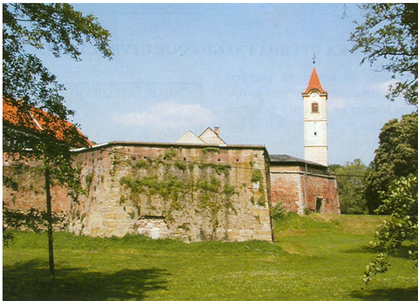
Dio zidina utvrde i zvonik crkve

Kralj nije nikad otkupio Međimurje i Celjski su ga držali do 1456. i svog nestanka. Svim je njihovim posjedima vladao hrvatski ban Ivan Vitovec, a nakon što su njegovi nasljednici izgubili sva imanja, kralj Matija Korvin prodao je Međimurje budimskom veletrgovcu i bankaru Ivanu Ernuštu, inače švedskom Židovu. Ernušt je potom imenovan doživotnim hrvatskim banom, a obitelj je uzela naziv Čakovečki. Gašpar kao posljednji Ernušt umro je 1540. bez nasljednika. Posjede je pokušao oteti grof Petar Keglević, bivši hrvatski ban. Njega je 1547. iz čakovečke utvrde istjerao Nikola Zrinski, slavni sigetski junak, kojemu je kralj namijenio Međimurje za nikad namireni dug vezan uz održavanje konjaničke postrojbe. Dolazak Zrinskih u Čakovec i Međimurje značajno je obilježio cijeli kraj i čakovečku utvrdu te