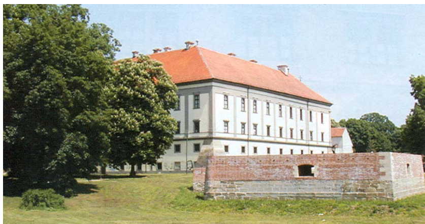
Palača u utvrdi i obnovljeni bastion

Nikola Šubić Zrinski bio je nadaleko poznat po svojim velikim vojničkim uspjesima u borbama s Turci-