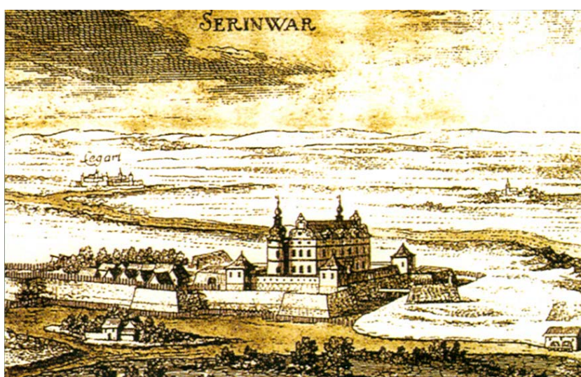
Novi Zrin od nepoznatog autora

petija, spašen dio biblioteke Zrinskih (424 sveska) i nalazi se u Nacionalnoj i sveučilišnoj knjižnici u Zagrebu. Valja se malo zadržati na gradnji utvrde Novi Zrin koja je danas prešla u legendu, posebno stoga što su s njom usko povezani tragični događaji koji će kasnije uslijediti. Godine 1661. bile su zidine legradske utvrde toliko potkopane da se vojska htjela iseliti. Stoga je Nikola Zrinski odlučio izgraditi novu utvrdu koja bi mogla djelotvorno zaštititi Međimurje. Ona je izgrađena nešto istočnije od Legrada, ali se unatoč sačuvanim vedutama povjesničari i danas spore oko