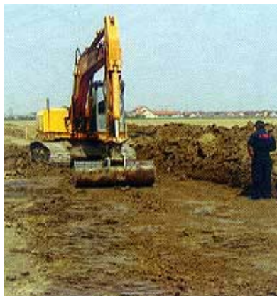
Zemljani radovi na prvoj fazi vinkovačke obilaznice

U sklopu rješavanja prometnih problema Osijeka predviđa se i dogradnja južnog kolnika na manjem dijelu