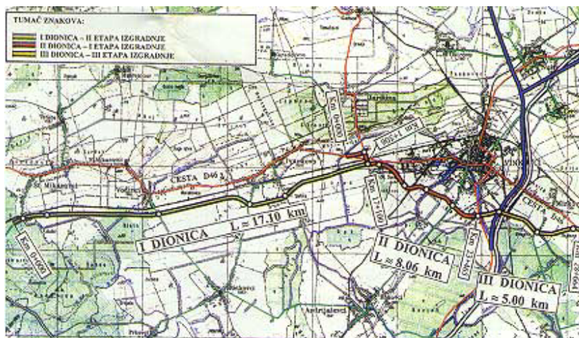
Južna obilaznica Vinkovaca

Nedavno se počela graditi i prva faza južne obilaznice Vinkovaca koja će, tranzitni promet skrenuti izvan grada. Radi se o premještanju državne ceste D46 na potezu Đakovo – Vinkovci – Tovarnik, koja je paralelna s europskim cestovnim pravcem E70, a sastavni je dio koridora 10. U cestovnoj je mreži Hrvatske ta cesta važna za povezivanje sjeveroistočnih dijelova Hrvatske, odnosno Osječko-baranjske i Vukovarsko-srijemske županije u smjeru istok-zapad. Na potezu od Starih Mikanovaca do Mirkovaca ta važna prometnica gotovo cijelom duljinom prolazi kroz naseljena područja tako da djeluje kao urbana prometnica. Nametnula se stoga potreba da se postojeća cesta na tom dijelu dugom otprilike 30 km premjesti te tako omogući normalniji život stanovnicima Starih i Novih Mikanovaca, Vođinaca, Ivanškova, Vinkovaca i Mirkovaca.