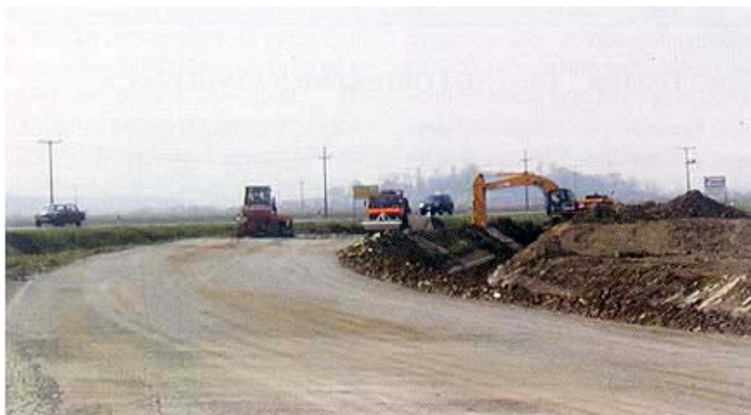
Radovi u tijeku na zapadnoj obilaznici Osijeka

dva denivelirana čvorišta – čvorište Osijek-zapad i čvorište Strossmayero-va ulica. Ima i četiri čvorišta u razini što omogućuju spoj zapadne obilaznice s prigradskim naseljima (Čepin i Livanu), predviđena su i denivelacije obilaznice i željezničke pruge Dalj – Varaždin.