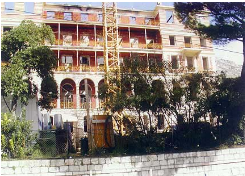
Pogled s ulice na gradilište hotela Imperial

ni do travnja 2003. Najviše je problema u građenju stvaralo to što je trebalo sačuvati stare gabarite kojima se trebalo prilagođavati. Također je velik problem za organizaciju gradilišta predstavljalo to što je ono smješteno uz usku i vrlo prometnu ulicu pa je bilo problema s dopremom gradiva i opreme. Arheološki radovi