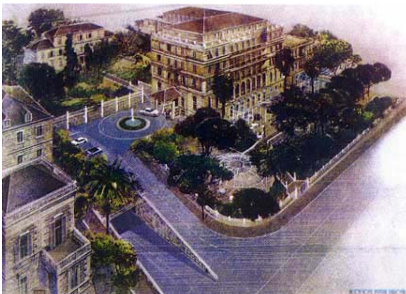
Maketa novog hotela i okolnog uređenja

i vlasništva u preuređenom hotelu. Najavljeno je da će se u obnovu i dogradnju hotela uložiti više od 20 milijuna dolara, a u izvještajima je spominjan i iznos od 23 milijuna dolara. Atlantska plovidba će s gotovo 65 posto dionica zadržati većin-