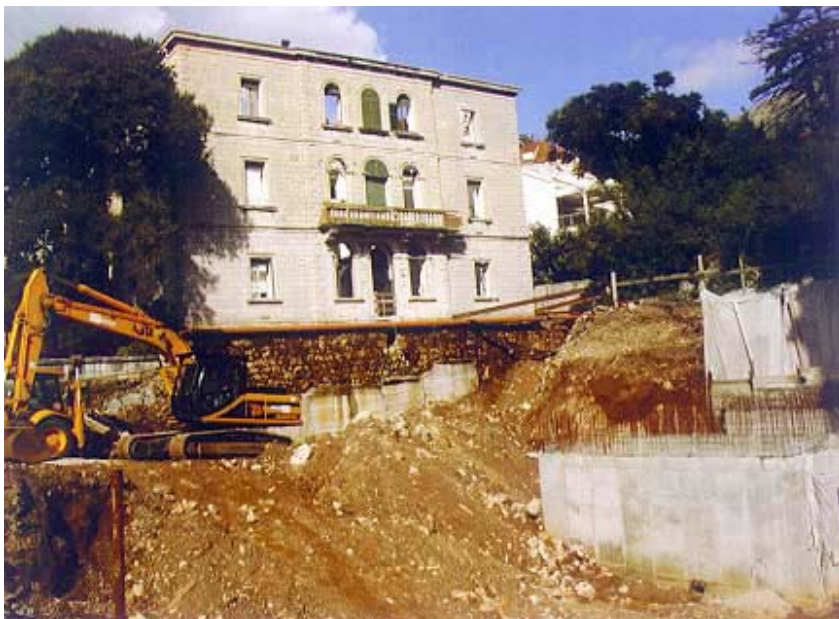
Gradilište Malom Imperiala

Neto je površina građevine 13.340 četvorna metra, a bruto 17.814.