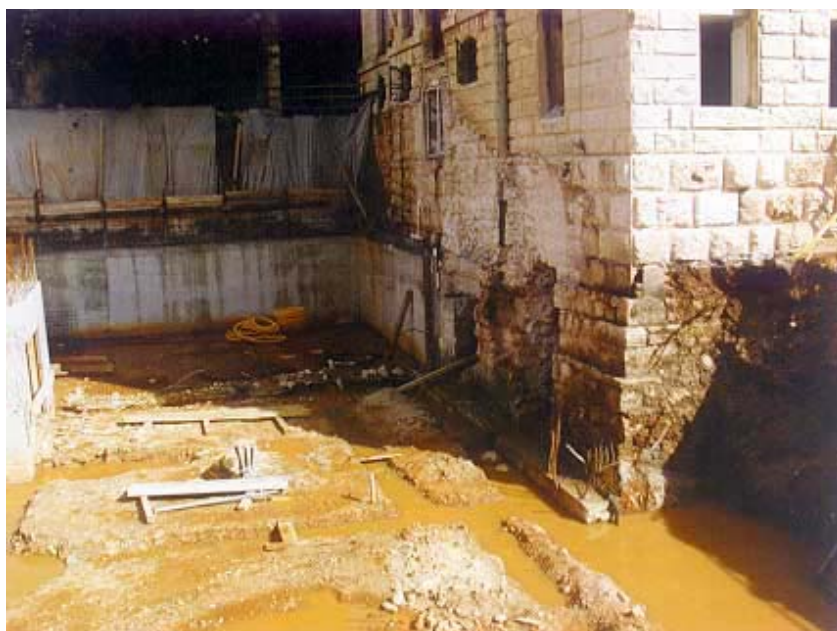
Građevna jama sa zaštitnim zidom

Zgrade velikog i malog Imperiala međusobno su povezane garažnim prostorom u dvije razine sa 45 mjesta za parkiranje. Taj će prostor ujedno služiti i kao servisni između dviju zgrada. Ujedno će gornja garažna razina služiti za opskrbu hotela te kao veza sa sobama u obje zgrade hotela. Mali Imperial je odvojena zgrada sa 49 soba u četiri razine, u prizemlju i tri kata.