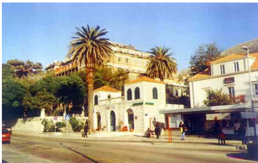
Hotel Imperial snimljen s Pila prije početka obnove

Izvorno je hotel imao samo dva kata, ali jedan mu je kat nadograđen u tridesetim godinama prošlog stoljeća. U velikoj rekonstrukciji 1987. nadodana su mu dva kata u novoj krovnoj konstrukciji koja je kao kapa smještena na vrh zgrade, a to je rješenje još u vrijeme izgradnje bilo i hvaljeno i osporavano. U blizini je u prvim desetljećima dvadesetog stoljeća izgrađena vila obitelji Kostadinović , u kojoj je poslije bila smještena kockarnica, inače prva na prostorima nekadašnje Jugoslavije. Ta je vila