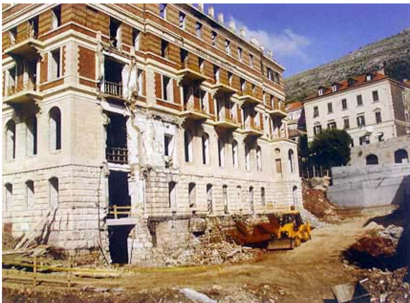
Pogled na gradilište uz istočno pročelje hotela