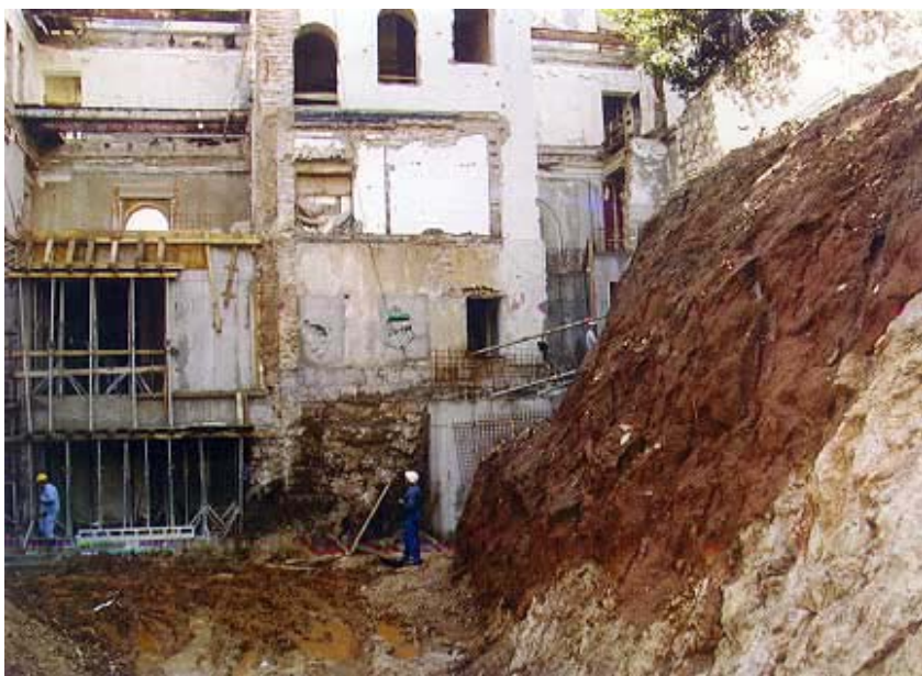
Radovi u podzemnom dijelu građevine

Nedavno smo posjetili ovo veliko i složeno gradilište te se u društvu projektanta i nadzornih inženjera temeljito upoznali s njegovim značajkama. U tijeku razgovora potpuno smo razriješili dvojbu svrstati li ovaj napis u rubriku gradilište ili u rubriku obnova. Iako se radi o zgradi koja je izgorjela u ratom izazvanom požaru, i koja je dodatno stradala od padalina, upravo je uključivanje u hotelski lanac Hilton uvjetovalo toliko mnogo promjena da se zapravo radi o potpuno novoj građevini. Zadržat će se glavna pročelja i jedne i druge zgrade (velikog i malog Imperiala ), ali će glavnoj zgradi biti dodana posebna dependansa, zapravo aneks s dvoranom i bazenom. Zapravo će se rekonstrukcijom vratiti izvorni izgled glavnog pročelja i srušiti svi kasniji aneksi i oštećeni dijelovi. Obje će se zgrade obnoviti i proširiti, a proširenja će se odvojiti od postojećih zgrada staklenim stijenama zbog naglašavanja razlike staroga i novoga. Riječ je o kompletnoj rekonstrukciji i dogradnji u skladu s lokacijskom dozvolom, konzervatorskim uvjetima i standardima hotelskog lanca Hilton .