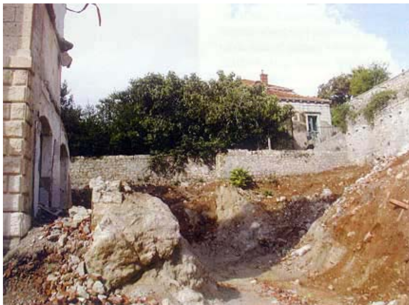
Iskopi uz sjeverni rub gradilišta