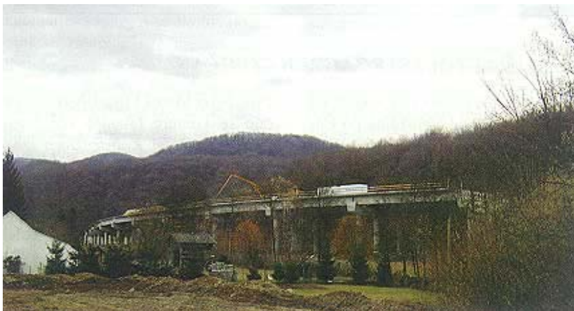
Gradilište vijadukta Paka snimljeno sa stare ceste

dovi i na manjim objektima na trasi i oko nje. Tako se grade preložena cesta Moždenec-Sudovec, paralelni putovi, putni prijelazi Breznički Hum i Paka 4, spojna cesta do čvorišta Novi Marof do državne ceste D3 i sl. Započeo se graditi i cestarinski prijelaz u Novom Marofu. Računa se da je na svim objektima na ovoj dionici obavljeno približno 50 posto radova.