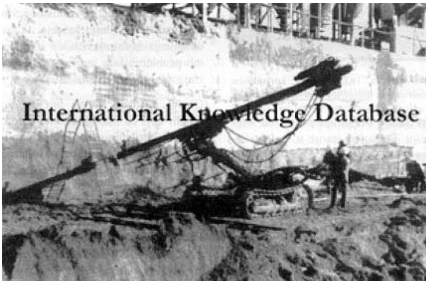
Domicilna web-stranica tehničkog komiteta TC-17 ( http://tc17.poly.edu/ )

Projekt međunarodne strukovne baze podataka za metode poboljšanja tla predstavljen je članovima tehnič-