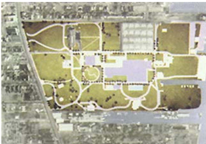
Tloris nove tvornice za preradu vode u Detroitu

Prva detroitska tvornica za preradu vode utemeljena je na obali rijeke 1880. godine na površini od 45 hektara i nazvana je Water Works Park (Park za preradu vode), a zanimljivost jest da je dio površine i danas gradski park. Sadašnje je postrojenje u ovoj velikoj tvornici staro 80 godina, a prerađivalo je svakog dana 450.000 m 3 (450.000.000 litara) vode. Sada se upravo gradi nova tvornica za preradu vode - Water Works Park II, koja će imati najveći kapacitet prerade od 1,2 milijuna m 3 vode na dan. To je najveće i najskuplje (275 milijuna dolara) američko gradilište pojedinačnog postrojenja za preradu pitke vode, a isporučivat će