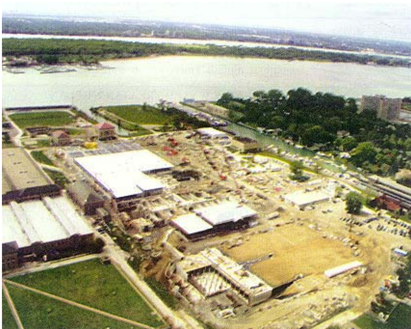
Pogled iz zraka na gradilište i rijeku

vodu za 4 milijuna stanovnika šireg područja Detroita, što čini 42 posto ukupne populacije Michiganana. Ujedno vlasnika - Detroitu upravu za vodoopskrbu i odvodnju ( Detroit Water and Sewerage Department - DWSD ) svrstava po veličini na treće mjesto među vodoopskrbnim poduzećima u SAD-u.