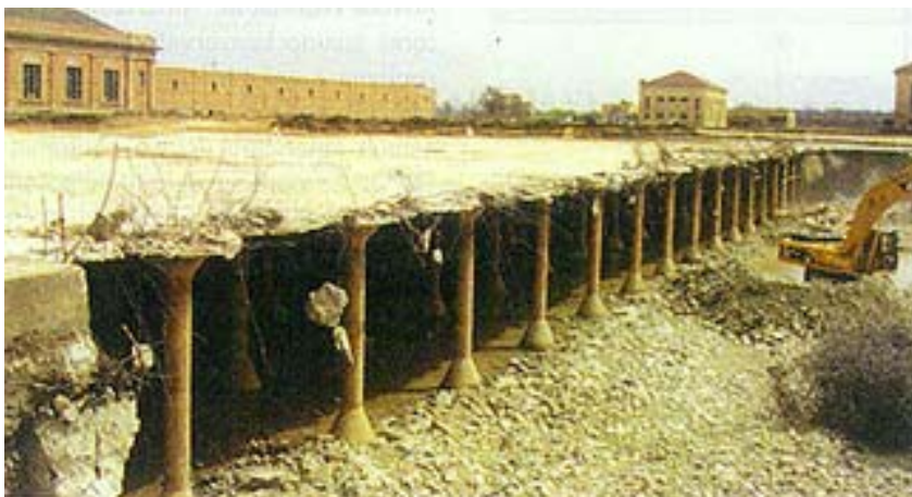
Obnavljanje oštećenih dijelova stare vodospreme

Odlučeno je naime da se izrada projekata i ugovaranje radova pogodi direktno s ponuđačima u budućim pregovorima. Pregovaralo se s tri ponuditelja koji su zadovoljili sve uvjete, ali se strogo pazilo da ti pregovori budu tajni kako bi se zaštitilo inženjersko intelektualno vlasništvo (bilo je zabranjeno voditi bilo kakve bilješke), a i sve su cijene, uključujući i one pojedinačne, bile strogo čuvana tajna. Održano je tako mnogo zajedničkih sastanaka na kojima su se razjašnjavali raznoliki oblici ovoga složenog projekta. Kako tvrdi Gary Meyerhorffer, direktor projekta u DWT -u i potpredsjednik Montgomery Watsona , takvi su sastanci višestruko korisni. Mogu se razmijeniti mišljenja, iznijeti nove ideje i odmah uočiti reakcije na njih te na kraju upoznati sudionike u odlučivanju s njima uspostaviti i utvrditi poslovne odnose. A Bob Harbron, voditelj inženjerskog tima u DWT -u i menadžer u Black & Veatcha tvrdi da su u tom slučaju naponi projektanta mnogo veći nego što je to slučaj u klasičnom projektiranju, ali da su i rezultati mnogo bolji. Tako je tvornica postala mnogo lakša za građenje, a vlasnik će dobiti upravo ono što je tražio.