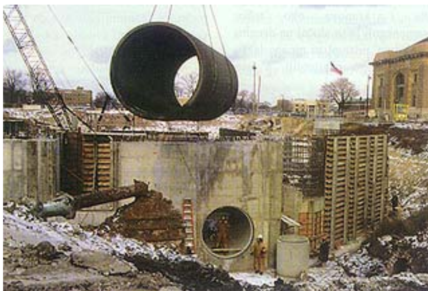
Izgradnja bazena za ozonizaciju

No pred projektante i graditelje nove tvornice za preradu vode u Detroitu postavljen je još jedan zanimljiv zahtjev, koji je predmet proučavanja mnogih organizatora građenja. Kako je u Detroitu s golemom automobilskom industrijom gotovo nemoguće pronaći dobre radnike za održavanje kakve grad priželjkuje, odlučeno je da se ugovor proširi i na održavanje tvornice za prvih sedam godina nje-