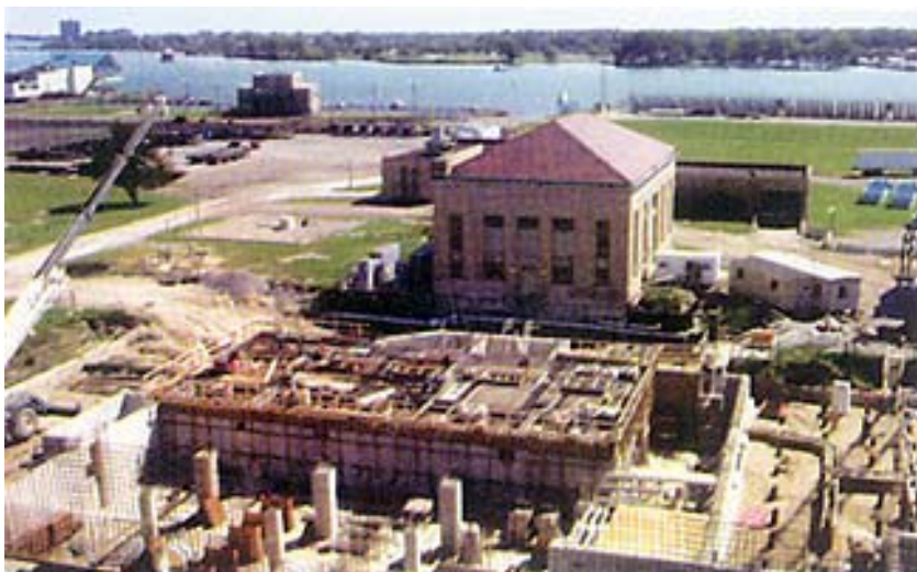
Dio gradilišta na mjestu nove crpne stanice

U DWSD -u tvrde da je to bila hrabra odluka i da je sličila odluci vlasnika starog automobila koji konačno shvati da su mu troškovi održavanja tako visoki da se mnogo više isplati nabaviti novi. No još je hrabrija odluka, također donesena 1996. godine, a značajno je utjecala na cijeli projekt, da se gradi pokraj stare tvornice i da se ne ide na klasični postupak koji uključuje izradu projekata, razmatranje ponuda i odabir izvođača. To je učinjeno u uvjerenju da je taj postupak i sporiji i skuplji i unatoč činjenici da su već bila izrađena 22 projekta. Očekivanja su se u potpunosti ispunila. Nova će tvornica biti završena u proljeće 2003., čak 42 mjeseca prije procijenjenih 8 godina, i bit će 89 milijuna jeftinija od tvornice koja bi se gradila uobičajenim načinom.