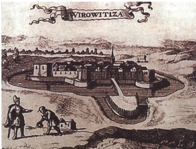
Virovitička tvrđava nakon oslobođenja od Turaka (početak 18. stoljeća)

Virovitički zaštitnici sv. Florijan, sv. Emigdije i sv. Rok stoljećima su čuvali grad od požara potresa i kuge, koji su nerijetko razarali grad. Posljedica tih razaranja jest najstarija sačuvana arhitektura, ona iz doba baroka. Razvivši se na važnoj rimskoj prometnici Via Magna, koja je povezivala Poetovio (Ptuj) na zapadu i Mursu (Osijek) na istoku, i to na južnom završetku velike panonske ravnice kojom su harali Mongoli i Turci, nakon kojih se grad ipak uvijek iznova podizao - Virovitica se smjestila na sredini između dvaju oduvijek važnih hrvatskih gradova, Varaždina i Osijeka. Između sjevernih obronaka pitome Bilogore i hirovite rijeke Drave, koja je oduvijek dijelila Hrvatsku od Ugarske (Mađarske), stoji grad i u njemu jedan od najreprezentativnijih i najvećih dvoraca sjeverne Hrvatske. Podravina počinje s Ludbregom na zapadu, a završava s Viroviticom, jer istočnije od nje stanovnici se i danas nazivaju i smatraju Slavoncima, a ne Podravicima.