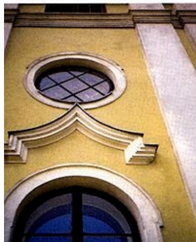
Detalji: južnoga perivojnog pročelja (gore) i sjevernog pročelja (dolje)