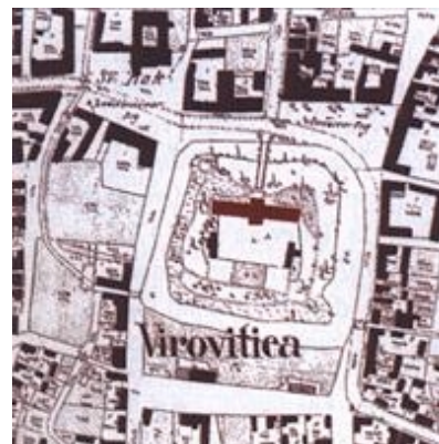
Dorisana katastarska karta, 1862. (1900.)

Virovitica se spominje među prvim naseljima u sjevernoj Hrvatskoj. Od slavonskoga hercega Kolomana, brata ugarsko-hrvatskoga kralja Bele IV., dobila je 1234. godine položaj povlaštenoga trgovišta, a to je značilo gradske povlastice i slobostine koje tada još nije imao ni Gradec (Zagreb). Da je Virovitica u srednjem vijeku imala izuzetan položaj i značenje u prostoru sjeverne Hrvatske, potvrđuju mnogi povijesni podatci. Ugarsko-