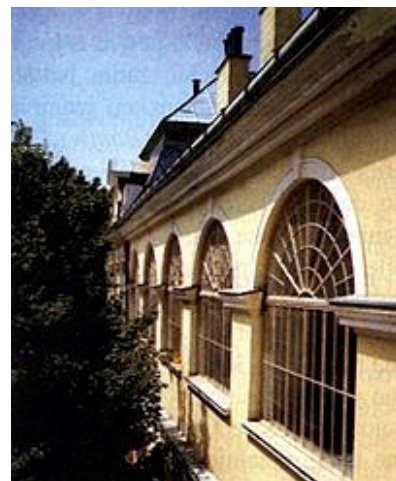
Istočno krilo ulaznog pročelja