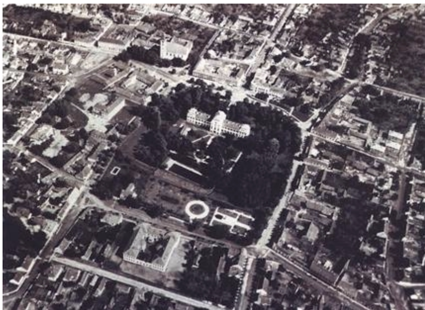
Središte Virovitice snimljeno 1956. godine

kralja Sigismunda izgrađeni su (vjerojatno početkom 15. stoljeća) novi kraljevski dvori (kraljeve i kraljičine kuće). Vlastelinska tvrđava (castrum) spominje se prvi put u darovnici kralja Matijaša Korvina iz 1474., a vjerojatno je izgrađena između 1453. i 1474. godine. O njezinu izgledu i veličini ne znamo mnogo. Pretpostavlja se da su vanjske granice tvrđave bile oko 90 x 100 metara. Bila je opasana debelim zidovima i s četiri kule, te okružena širokim, vodom ispunjenim grabištem. Pošto su Turci osvojili tvrđavu 2. kolovoza 1552., pretvorili su je u pravi islamski grad koji se ničim nije osobito isticao osim što je imao vojnu vrijednost na sjevernoj granici Osmanlijskoga Carstva. Evlija Čelebija doživio je oko 1663. godine Viroviticu kao tijesan grad četverouglastog oblika, obzidan čvrstim zidovima i smješten među drvećem. Brojni bakropisi koji prikazuju Viroviticu kad je bila oslobođena od Turaka 1684. godine, ali i poslije, nikada nisu bili istraženi i potvrđeni arheološkim iskopavanjima. Nakon 132 godine turske vlasti, Viroviticu je 25. srpnja 1684. oslobodila carska vojska s generalom Jakobom Lesliejem na čelu. Odmah su počele pripreme za obnovu tvrđave, osobito na-