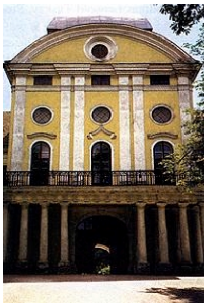
Sjeverno pročelje - ulaz u dvorac

plemića Mihalovića) i Špišić Bukovica (kupljena 1861. godine). Posjed knezova Schaumburg-Lippe protezao se od Drave na sjeveru do obronaka Bilogore i Papuka na jugu te od granice đurdevačke krajiške pukovnije na zapadu do našičkoga vlastelinstva na istoku. Virovitičko vlastelinstvo zapremalo je 77.450 jutara i 962 četvornih hvati zemlje, od čega je bilo oko 60.000 jutara šume, oko 8500 jutara oranica, oko 3000 jutara livada, 2850 jutara pašnjaka i 177 jutara vinograda. Vlastelinstvo je bilo podijeljeno u osam majura: Antonovac, Korija, Rogovac, Miholac, Senkovic, Slatina, Mikleuš i Bukovica. Gotovo sva gospodarska zemljišta bila su u ravnici s plodnim tlom (crnicom). Nije bilo moguće obrađivati svu zemlju pa je oko 40 posto oranica bilo u zakupu. Zbog pomanjkanja pruga i dobrih cesta izvoz proizvoda bio je otežan sve do kraja 19. stoljeća. Glavni je prihod bio od šuma kojima je virovitičko vlastelinstvo obilovalo. Godine 1846. na vlastelinstvu postoji omanja šećerana na parni pogon, radio je i paromlin, a utemeljene su tvornica žeste, pecara rakije i nekoliko manjih ciglana. Svoj gospodarski vrhunac posjed je doživio potkraj 19. i početkom 20. stoljeća, kada su izgrađene šumske željeznice