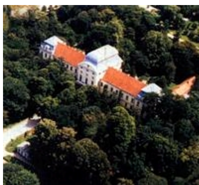
Pogled na dvorac i park sa sjevera (1980. godine)

kog rata, tadašnja općina trgovišta Virovitice nije iskoristila priliku za kupnju dijela nekadanjega vlastelinstva na području Virovitice, nego su imanja dospjela u posjed doseljenih Nijemaca, koji su te posjede držali do 1945. g. U međuvremenu, Virovitica je 31. prosinca 1921. dobila položaj grada. Gradsko je zastupstvo 5. svibnja 1930. donijelo odluku o kupnji dvorca sa šest jutara perivoja. Nakon Drugoga svjetskog rata veći je dio virovitičkoga vlastelinstva postao državno odnosno društveno vlasništvo.