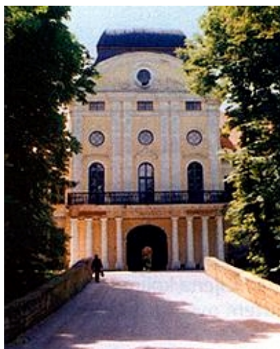
Sjeverni i glavni ulaz u dvorac, sadašnje stanje

1984. godine uređeno je i istočno krilo I. kata. Njemu je, kao i prije zapadnom dijelu, vraćen raspored prostorija prema tlocrtu iz 1909. go-