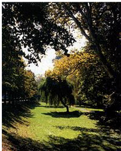
Istočni dio perivoja

urbanističke i arhitektonske kompozicije te slike grada. Iako se osjeća i odčitava barokno-klasicistički pristup u urbanističkoj zamisli dvorca, perivoja i glavne gradske osi, ipak perivoj nosi obilježja pejzažne parkovne arhitekture druge polovice 19. stoljeća. Na starim fotografijama, među kojima je najstarija iz 1896. godine, vide se skromni dvorišni historičistički cvjetni nasadi. Nekoliko veoma starih stabala (npr.: platane, katalpe, javori, jaseni, topole) ukazuju da je perivoj mogao biti začat prije 150-200 godina, ali ne treba isključiti ni mogućnost da su unutar grabišta neka stabla bila samonikla