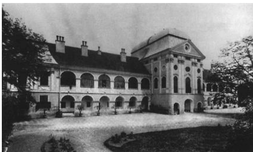
Južno perivojno pročelje iz 1896. godine

U posljednjih sedam i pol stoljeća Virovitice, urbanističko-arhitektonska jezgra mjesta jest srednjovjekovna tvrđava koja je početkom 19. st. zamijenjena dvorcem. Usprkos novim, arhitektonski i urbanistički neuspjelim i za Viroviticu previsokim zgradama iz šezdesetih godina 20. st., dvorac je i nadalje glavno kompozicijsko obilježje grada. Svojim položajem na blagom uzvišenju u središtu grada i usred dravske ravnice, dvorac je glavni nositelj identiteta Virovitice. Kao sjedište feudalne gospoštije, najprije u srednjovjekovnoj tvrđavi, a poslije u dvorcu, te kao naselje kojega su se stanovnici grčevito borili za očuvanje olakšica, Virovitica se razvijala kao dvostruki grad - feudalni i građanski. Zbog toga je dolazilo, osobito od 18. stoljeća, do čestih sukoba koji su najčešće završavali pobjedom i nadmoći zemaljskoga gospodara, virovitičkoga feudalca. Tijekom duge povijesti u Virovitici su se izmijenili mnogi gospodari. Virovitica je bila dugogodišnji posjed ugarskih kraljica i kraljeva. Kralj Sigismund založio je 1429. kraljevsku palaču i gospoštiju za 10.000 forinti domaćim plemićima Mirku i Ivanu, sinovima Nikole vojvode od Marczalyja. Kada su Marc-