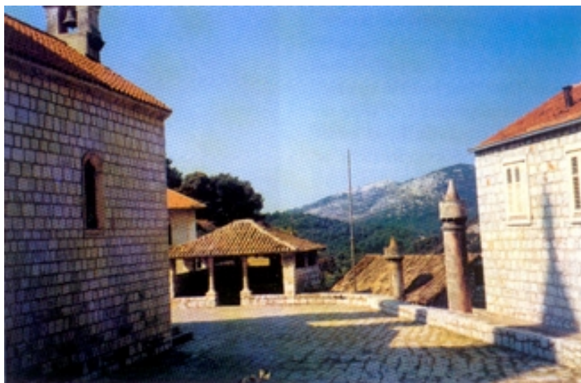
Plokata ispred crkve

i iseljavanje, pa se pretpostavlja da se ukupan broj stanovnika otoka znatno smanjio i da ih ima približno 860. No to će precizno utvrditi tek novi popis stanovništva. Glavno je otočko naselje Lastovo smješteno na strmoj padini amfiteatralno oko plodnog polja, a današnje je obrise dobilo u 15. i 16. stoljeću. Iz 15. stoljeća potječu i najstarije kuće. One su sta