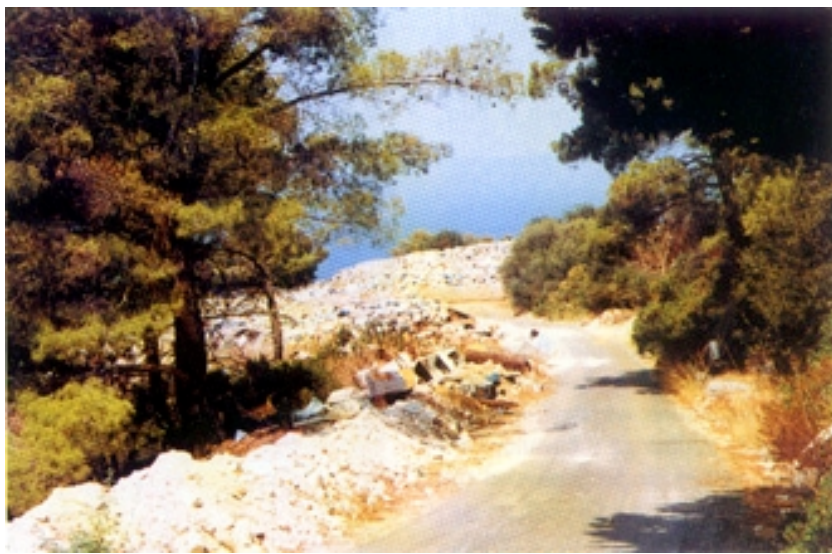
Odlagalište otpada uz cestu Ubli - Lastovo

žili i od Lastovaca predaju. Lastovci su se ipak naoružali, a žene i djecu poslali su na molitvu u crkvu Sv. Jure na Humu. Tada oluja u lastovskom kanalu rasprši gusarsko brodovlje, a Lastovci uhvate glasnika i na magarcu ga sprovedu kroz selo te ga osude i spale. U ovoj se pokladnoj stilizaciji lastovska vojska pretvara u pokladare, a 'lijepje maškare' u nesuđeno roblje.