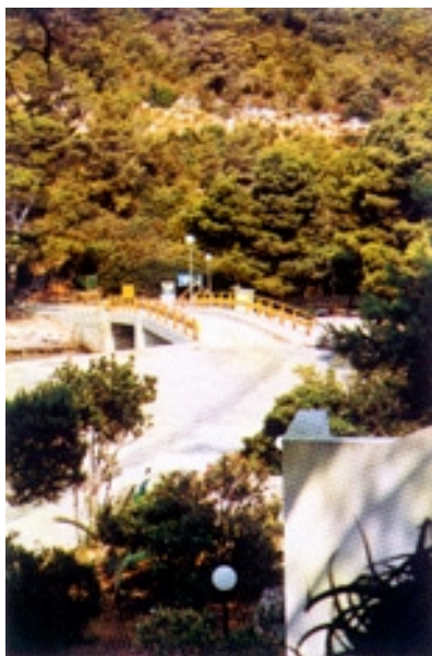
Most između Lastova i Prežbe

zapadu): Makarac, Prežba, Maslovnjak veli, Maslovnjak mali, Bratin, Vlašnik, Rutvenjak mali, Rutvenjak veli, Mrčara, Crnac, Kopist, Pod Kopist, Bijalac i Sušac te hridi Pod Mrčaru, Hljeb i Karlovića Tovari.