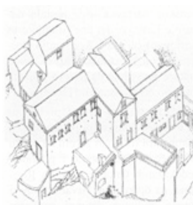
Crtež renesansno-baroknog sklopa kuća obitelji Jurica - Hropić

dočenje stranaca u sudskim sporovima nije se uopće uvažavalo. Ujedno dubrovački knez nije smio kupovati posjede na otoku, a bilo je ograničeno i gomilanje crkvenih posjeda. Statut je zapravo prema novim standardima uobličio staro otočko običajno pravo.