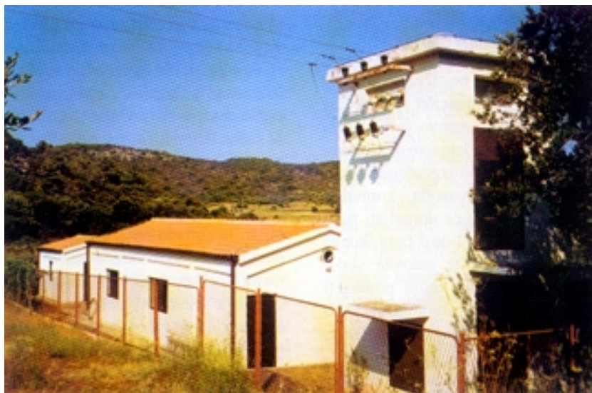
Uređaj za desalinizaciju vode u Prgovu polju

javno napadajući ondašnju zatvorenost otoka za strance. Ta je odluka inače nedugo potom, 1989. godine, i ukinuta, ali bez "blagoslova" vojnih vlasti. Kasnije je bio voditelj općinskog poduzeća Komunalac , čijim je radom, kao i gotovo svim na otoku, dijelom upravljala i vojska. Nakon odlaska vojske 1992. raspisani su prvi demokratski izbori i bio je načelnik do 1996. kada je smijenjen.