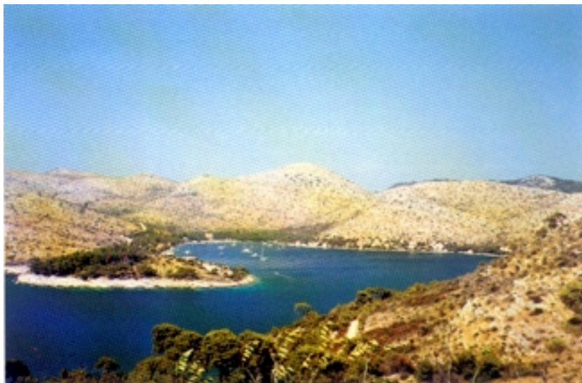
Skrivena luka s u požaru stradalom okolicom

U građi otoka prevladavaju donjokredni vapnenci. Osim najvećih uzvisina, koje jedva prelaze 400 m (Hum 417 m, Mali Hum 415 m, Pleševo brdo 400 m) ima mnogo odvojenih brežuljaka i krških dolomitskih udolina s brojnim plodnim poljima. Najveća su Vinopolje na zapadnom