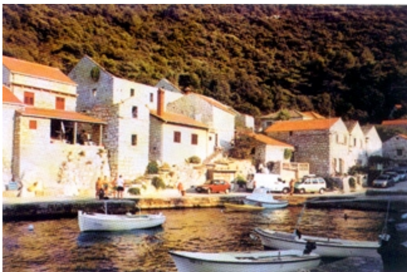
Uvala Lučica ispod Lastova

Rekli smo već da je mjesto Lastovo smješteno unutar otoka, ali je od mora na sjevernoj otočkoj obali udaljeno nekoliko stotina metara zračne linije. No do mora se spušta vrlo strma padina, koja je uz utvrde bila najbolja obrana od gusarskih napada. Do obale se spušta krivudava cesta kroz gusto pošumljen predjel. Ispod sela staro je ribarsko naselje Lučica sa natiskanim kamenim sklo-