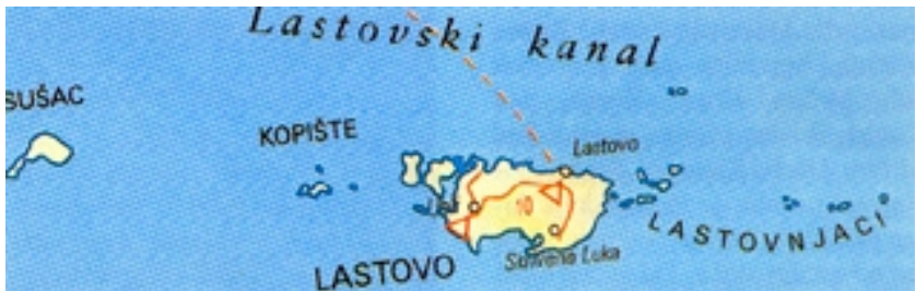
Zemljovid Lastova i okolnih otočića

Lastovo is a distant and sparsely populated island that belongs to the group of south Dalmatian islands. It is surrounded by many smaller islands around which lie habitats of numerous species of high quality fish. Lastovo has some smaller settlements, the most prominent being Ubli which is in fact the main port and the ferry terminal. The biggest and for a long time the only settlement on the island is Lastovo, situated in the northern portion of the island, on the back side of the steep cliff that abruptly plunges into the sea. The town, surrounding a fertile field, is amphitheatric in form. It features valuable gothic, renaissance and baroque stone buildings and assemblages of housing units. Tall and highly unusual chimneys are of particular interest. Lastovo is currently very sparsely populated with weak and decaying economy and acute transportation problems. The water supply has recently been improved through desalinization, and plans have been made to improve the sewerage network and the local waste disposal dump. Lastovo is an abundantly forested island with clean and unpolluted sea and coast.