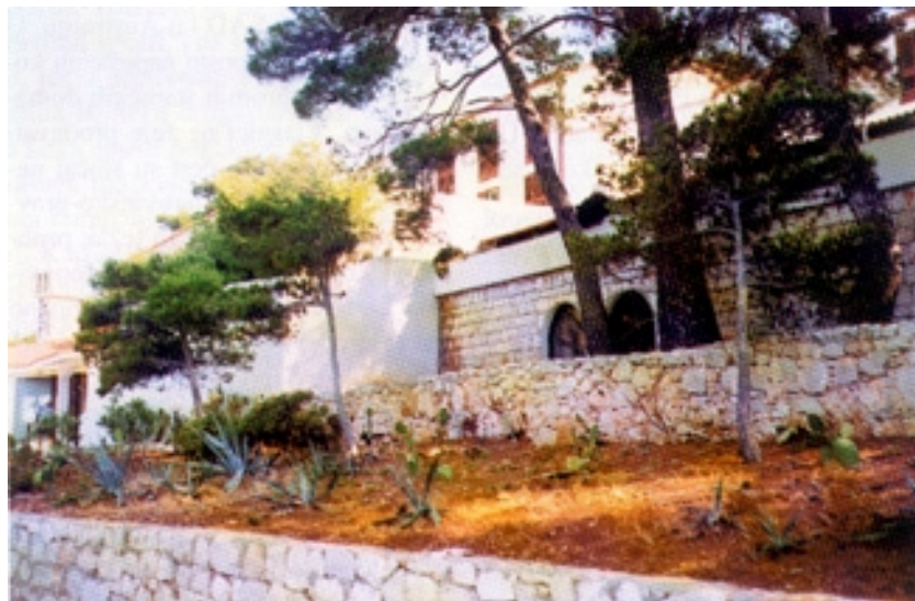
Hotel Solitudo na Lastovu

Načelnik Teo Katić ponosan je što je osobno potaknuo ugradnju desalinizatora. Naime voda iz regionalnog vodovoda Neretva-Pelješac-Korčula-Lastovo usprkos položenom podmorskom cjevovodu nikako ne stiže, a dok dođe proći će još dosta vremena. Vodoopskrba je uvjet svakog pa i najmanjega gospodarskog razvoja, a posebno za razvoj turizma. Stoga je ideju o desalinizaciji ponudio Vladi, naišao je na razumijevanje stručnih krugova te je zahvaljujući agreivnoj tvrtki i povoljnim zajmovima i pomoći Hrvatskih voda Lastovo dobilo pitku vodu. Takav način rješavanja vodoopskrbe može biti vrlo prihvatljivo rješenje za manje i udaljene, a slabo naseljene otoke. Za sigurniju vodoopskrbu Lastova bio bi potreban još jedan desalinizator, a njegova je ugradnja i predviđena pri gradnji crpne stanice.