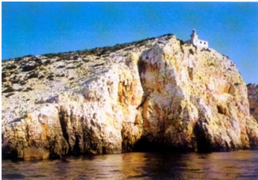
Svjetionik na otoku Sušcu

Lastovo je od kopna najudaljeniji naseljeni hrvatski otok, a okrenut je pučini i nalazi se nadomak velikih dubina Jadranskog mora prema jugoistoku. Otok je u sastavu južnodalmatinske otočne skupine i približno je 32 km (17,3 Nm) udaljen od Mljeta te 13 km (7,7 Nm) od Korčule. Nalazi se južno od Korčule (dijeli ih Lastovski kanal), jugozapadno od poluotoka Pelješca i otoka Mljeta i jugoistočno od Visa. Proteže se u smjeru istok-zapad i dug je 9,8 km i širok do 5,8 km. Površina mu je 46,87 km 2 , iako u mnogim izvorima piše i točno 50 km 2 . Po tome je petnaesti po veličini među hrvatskim otocima. Obala mu je duga 46,4 km s koeficijentom razvedenosti od 1,9. Iako je nešto slabije razvedeno, Lastovo ima izuzetno mnogo otoka i otočića. To je cijeli jedan niz koji se od Lastova nastavlja prema zapadu i istoku, budući da uz sjevernu obalu ima jedan otok (Zaklopatica ispred istoimene uvale), a uz južnu uopće nema otoka, osim dviju hridi (Uska i Mrca). Zapravo se svi ti otočići zajedno s