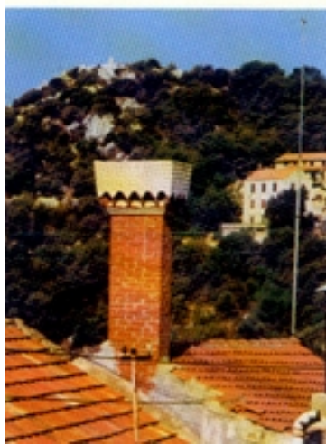
Primjeri Lastovskih dimjaka. Najdonji je restauriran i najstariji je u Dalmaciji

nažalost današnja slika lastovskog sela i njegova osebnog graditeljskog naslijeđa ugrožena je iseljavanjem i novim često i nestručnim zahvatima. Ipak mnogi sklopovi kuća, pregrađeni, povišeni i uokvireni kasnijim adaptacijama, omogućuju uvid u visoku razinu svakodnevnog života nekadašnjih Lastovaca. U posljednje je vrijeme došlo do koncentracije svih bitnih sadržaja na Pjevoru, iznad jugozapadnog ruba naselja. Tu je smješten bijeli blok zgrada koji oblikom i proporcijama potpuno odudara od opće slike naselja. To je slučaj i sa zgradama austrijske škole i talijanske općine što su prije izgrađeni na Dolcu, tradicionalnom središtu mjesta. Posebno su neuspjele neke betonske suvremene višekatanice povrh naselja te poneke adaptacije starih sklopova. Žalostno je što su zapravo najmanje oštećena napuštena kamena zdanja. Lastovo jest zaštićena urbano-ruralna graditeljska cjelina, ali ta zaštita očigledno nije baš osobito djelotvorna.