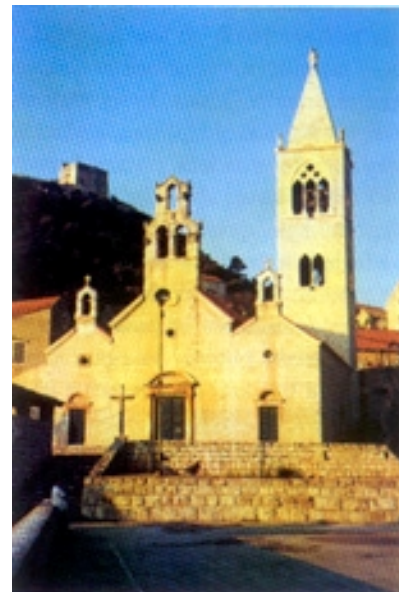
Pročelje crkve Sv. Kuzme i Damjana

ništvu Lastova iz popisa prije nego što je otok napustila ondašnja JNA. S vojskom je otišao i dio s njom povezanog stanovništva, a nastavljeno je