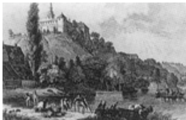
Ilok na grafici iz 1840. godine

Kao najistočnije naselje Hrvatske, Ilok je stoljećima bio političko, trgovačko i kulturno središte zapadnoga Srijema. Njegov izuzetni položaj na istaknutom uzvišenju, pedesetak metara iznad desne obale Dunava, omogućuje vidike na sjeverne pitome vinorodne obronke Fruške gore, na ovdje širok i polagan tok rijeke Dunav te na vojvođansku (bačku) ravnicu s druge strane rijeke. Zbog