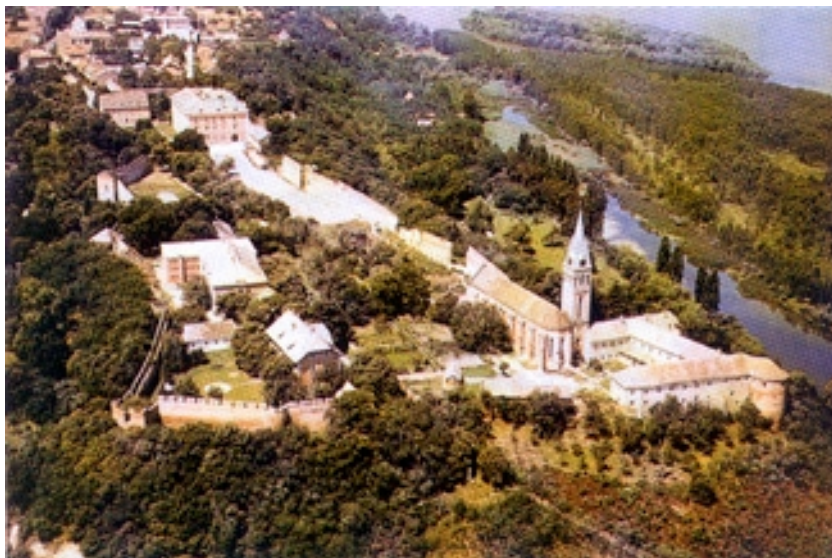
Srednjovjekovna jezgra Iloka

postali državno vlasništvo. Iločko vlastelinstvo bilo je svojom površinom veliko i gospodarski snažno. Bilo je podijeljeno na dva dijela sa središtima u Iloku (Gornji Srijem) i Irigu (Donji Srijem). Često se pod imenom iločkoga vlastelinstva misli na Gornji Srijem. Broj selišta i naselja mijenjao se. Od 121 sesije 1720. godine, iločki posjed povećao se na 712 sesija (selišta) 1722., odnosno na 729 sesija 1726. godine, da bi se 1745. broj selišta smanjio na 535 s 1984 kmeta. Vlastelinstvo Gornji Srijem sa sjedištem u Iloku obuhvaćalo je 1714. godine 17 naselja, a nakon 1745. godine 28 naselja. U prvoj polovici 18. stoljeća zauzimalo je površinu od 14.955,75 hektara s više od 5000 stanovnika.