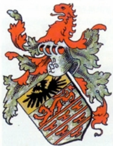
Grb knezova Odescalchi

lazila se kasnobarokna kurija koju su u 18. stoljeću izgradili baruni Brnjaković. Kurija je 1967. godine srušena zbog velikih pukotina u zidovima i svodovima, nastalih nakon