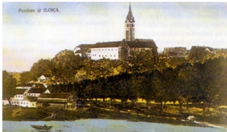
Ilok na razglednici iz 1918. godine

ma Ilok spominje od 13. stoljeća pod različitim imenima: Vlcán, Voilack, Vylok, Villak, Willak, Wylok, Wyhok. Istodobno postoji i posjed Ilok (Ujllak) u okolici Đakova. Naselje se spominje od 1283. godine (nije sigurno o kojemu je Iloku riječ), kao trgovište (oppidum) javlja se 1438., a kao grad (civitas) 1454. godine. Neki povjesničari izvode ime Iloka od mađarskih riječi uj + lalé što znači "novi dvor". Od 1343. u Iloku žive i djeluju franjevci, koji su napustili grad u doba turskoga zaposjednuća. U franjevač-