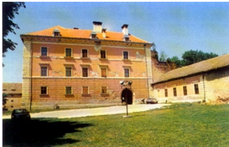
Istočno pročelje dvorca

veliki restoran za 300 gostiju, a kao prenoćište služi depandansa uz dvorac u kojoj ima 16 dvokrevetnih soba. Predsjednik uprave Ilija Pole tvrdi da su se u dvorac vratili 1997., a da njihova tvrtka djeluje tek od 1. listopada 1999. godine i da od tada pokušavaju popraviti što je tijekom