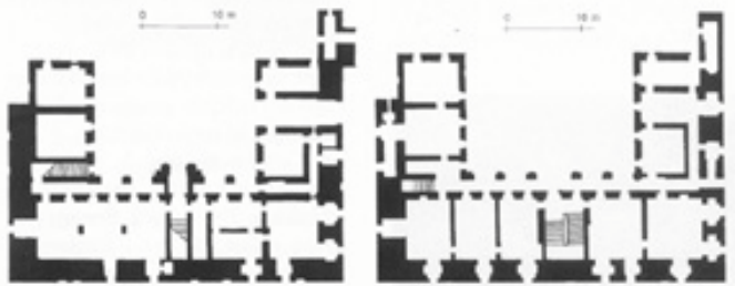
Tloris prizemlja dvorca i I. kata

Na sjeverozapadnom uglu iločke tvrđe, na mjestu današnjega dvorca knezova Odescalchija, nalazio se srednjovjekovni kaštel (stari dvorac), koji je vjerojatno gradio Nikola Iločki. Njegov nam je izgled nepoznat, spominje se samo njegov opseg od 258 koračaja. Razrušen je prilikom austrijske opsade Iloka i njegova oslobođanja od turskoga zauzeća. Dio temelja današnjega dvorca velike je debljine, oko 4,2 metara, a to ukazuje na tragove staroga srednjovjekovnoga kaštela. Buduća istraživanja trebala bi to dokazati.