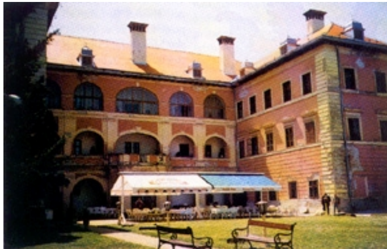
Sjeverno pročelje danas