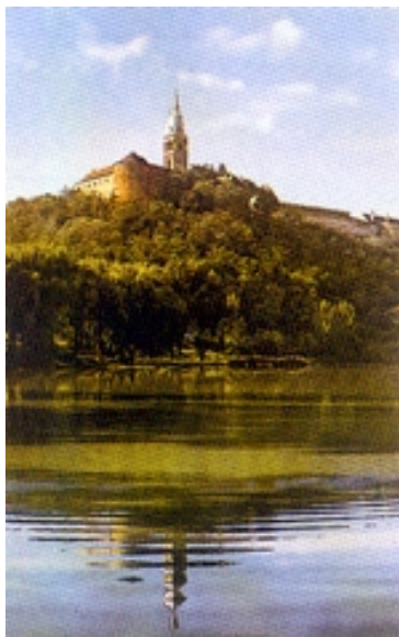
Ilok na razglednici iz druge polovice 20. stoljeća

kom samostanu u Iloku umro je i pokopan u samostanskoj crkvi talijanski franjevac sv. Ivan Kapistran († 1456.). Ilok se svojim izgledom i veličinom ubraja u najveće gradove srednjovjekovne Slavonije. U neko doba srednjega vijeka imao je oko 500 kuća i 4000 stanovnika. Neko je vrijeme bio sjedište srednjovjekovne Srijemske biskupije i županije. U drugoj polovici 15. i početkom 16. stoljeća Ilok je bio dobro ustrojeno gradsko naselje sa šest (prema nekim autorima, s deset) crkava (do danas je očuvana samo jedna), bolnicom, kovnicom novca i utvrdom te podgrađem prema dunavskoj obali. Ilok je dobio 1525. godine gradski statut, jedini poznati u kontinentalnoj Hrvatskoj, kojim je kralj Ludovik II. (vladao 1516.-1526.) potvrdio stare povlastice. Statut je minijaturama oslikao Julije Klović, u to doba slikar na kraljevskom dvoru.