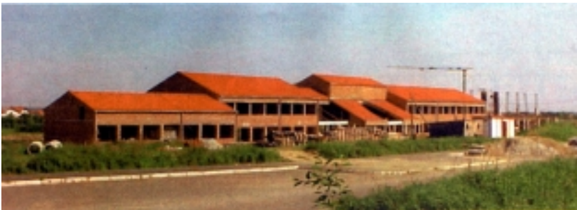
Pogled s juga na gradilište

Dilatacija je temeljena na uzdužnim armiranobetonskim temeljnim trakama. Takav sustav temeljenja uvjetovan je malim razmakom uzdužnih stupova i nagibom terena.