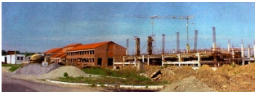
Pogled sa sjevera na gradilište

Za održavanje velikih športskih takmičenja predviđene su i dodatne garderobe s tuševima za čak osam natjecateljskih ekipa. Od toga će četiri garderobe biti opremljene posebnim dodatnim sadržajima za takmičenja invalidnih-športaša, kojima je namijenjen i poseban ulaz s propisanom rampom.