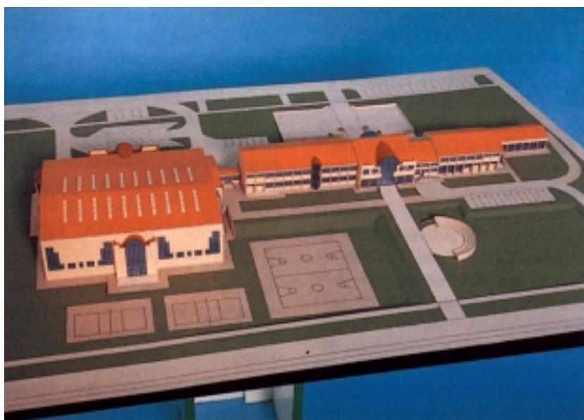
Pogled sa sjeverne strane na maletu nove škole i sportske dvorane

Ta je prva dilatacija duga 21 m, široka 9 m i visoka 3,40 m, a ima i poseban aneks 3 x 3 m. Ima krovnu drvenu konstrukciju, sustava dvostruke stolice. Nosivi je sustav cijele te dilatacije okvima konstrukcija, a poprečno je sklopljen od bezgrednih okvira, raspona 6 x 3 m na razmacima od po 3 m, dok su uzdužni